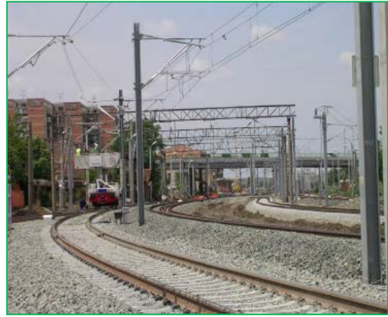
Stația Arad–lucrări LC pentru redeschidere linie Arad–Aradul Nou