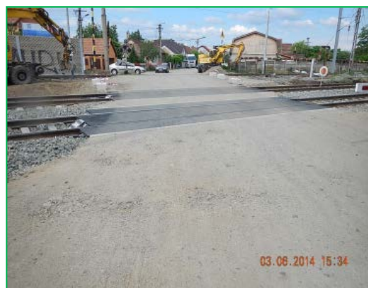
Stația Arad – trecere la nivel km 628+8