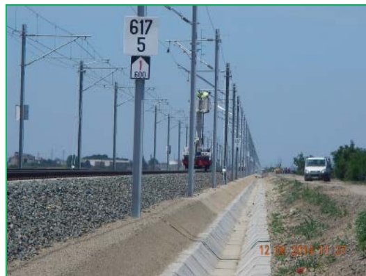
Interval km 614 – Glogovăț – șanț betonat