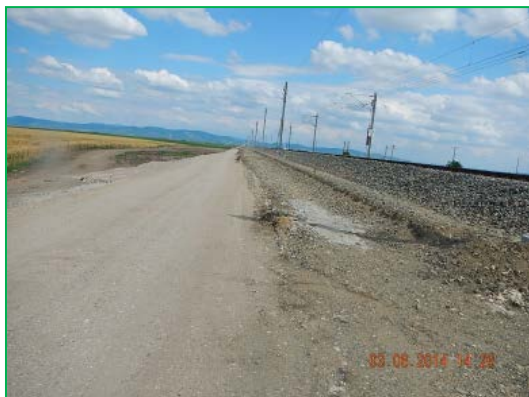
Interval km 614 – Glogovăț – amenajare drum existent