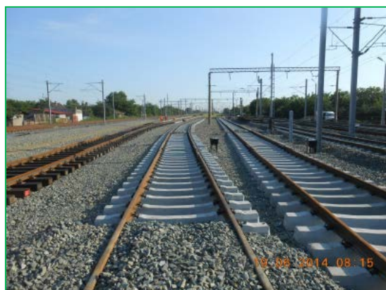
Stația Arad – linii grupa A Cap X