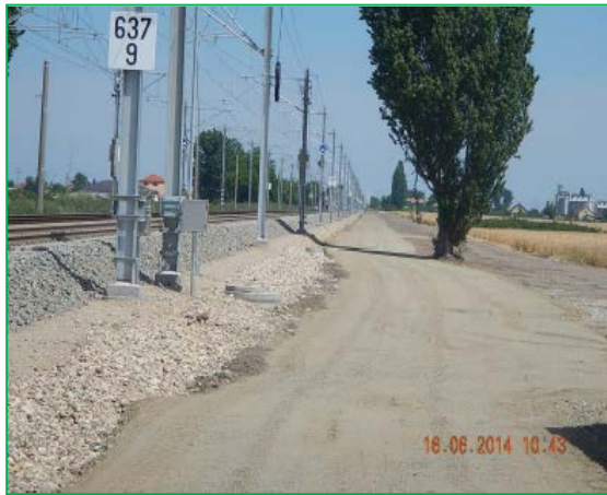
Interval Arad – Șofronea – drum tehnologic