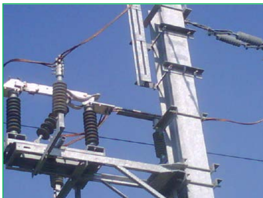
Interval km 614 – Glogovăț – lucrari EA