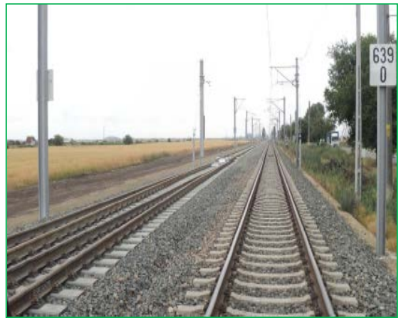
Stația Șofronea – lucrări LC