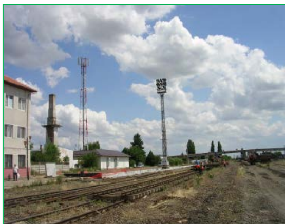
Stația Curtici – demontare suprastructura