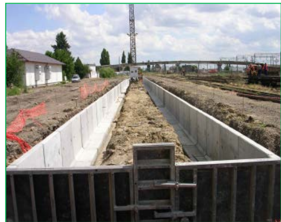
Stația Curtici – execuție peron