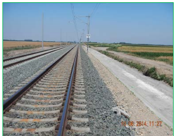
Interval Curtici – Frontiera – drum tehnologic