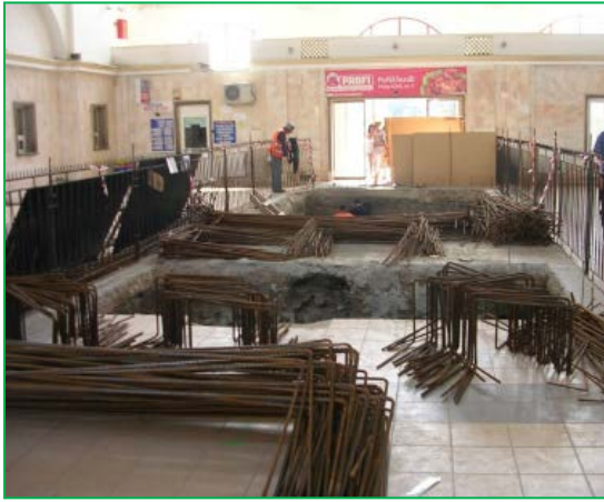
Stația Arad – pasarela – execuție lucrări hol central gară