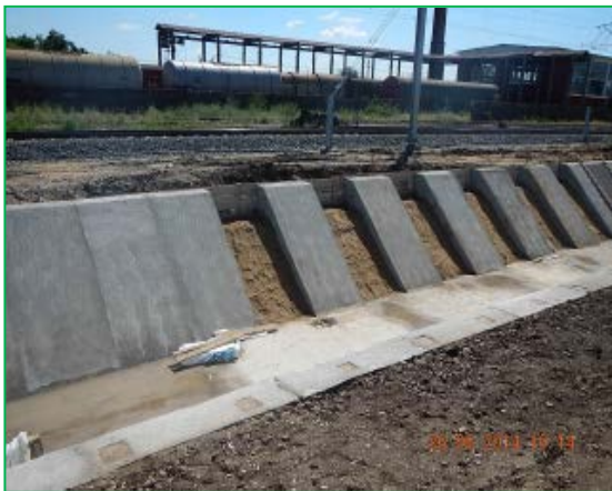
Stația Curtici – bazin de evaporare