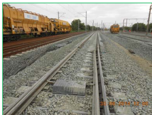
Stația Arad – direcția III