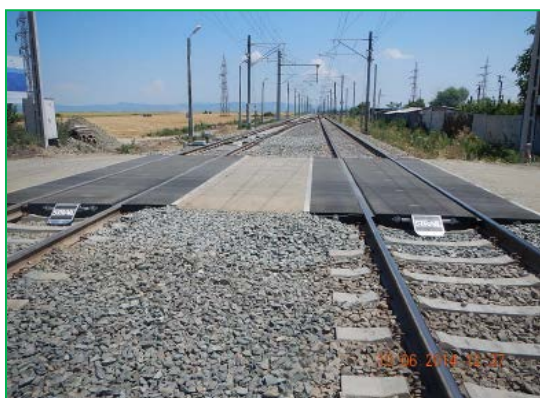
Stația Glogovăț – amenajare trecere la nivel