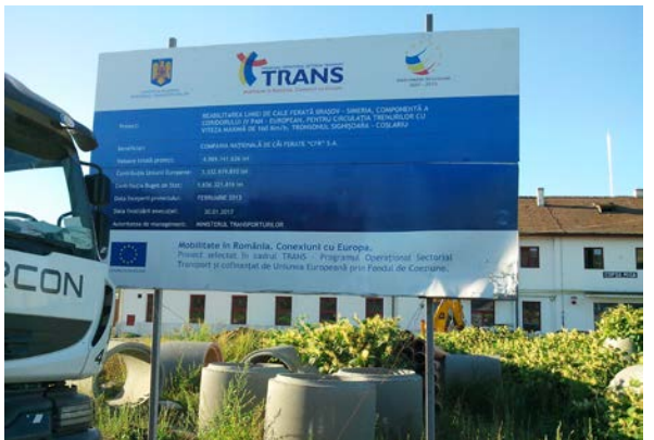
Lot 2, Copsa Mica Km. 348+260 / Km. 344+920