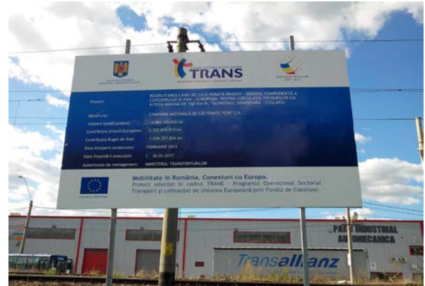
Lot 2, Mediaș Km. 335+350 / Km. 332+161