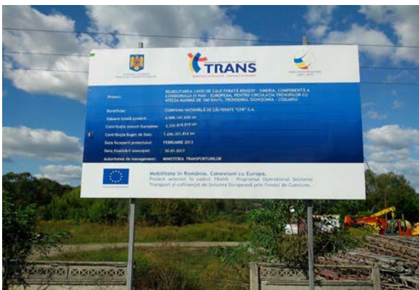
Lot 1, Gara Dumbrăveni Km. 319+820 / Km. 316+646