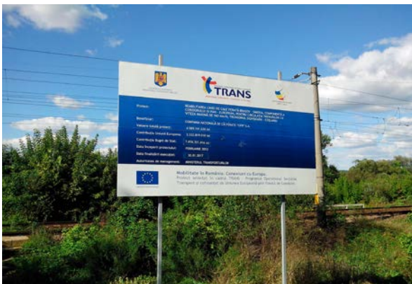
Lot 2, Halta Brateiu Km. 331+830 / Km. 329+258