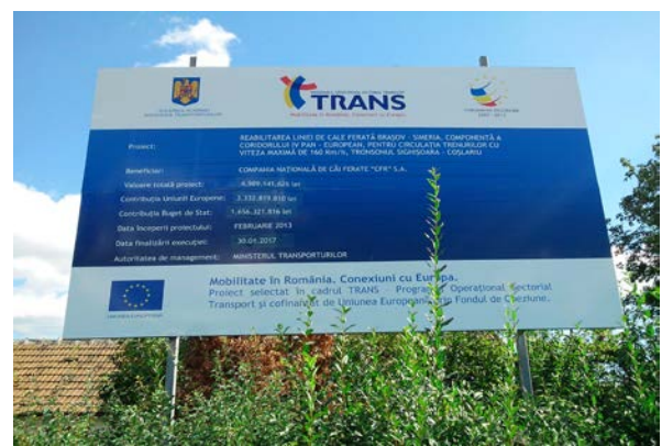
Lot 1, Așel trecere la nivel Km. 327+290 / Km. 324+329