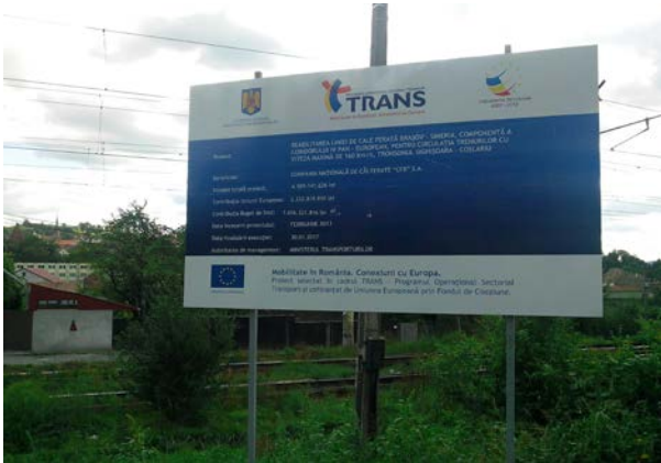
Lot 1, Sighișoara Km 299+000