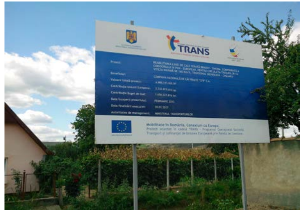
Lot 1, Stația CF Daneș Km. 308+910 / Km. 305+735