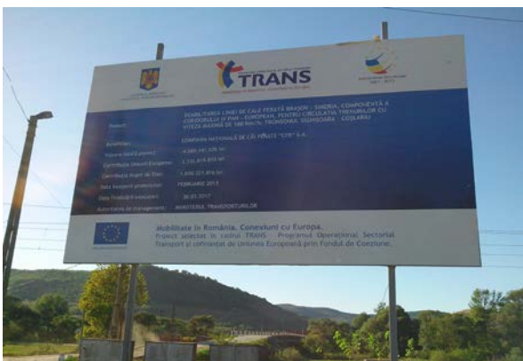
Lot 2, Halta Tarnava Km. 342+870 / Km. 339+617