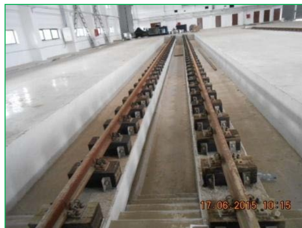
Stația Arad – suprastructură canal tehnic