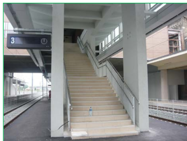
Stația Arad – pasarela – mână curentă