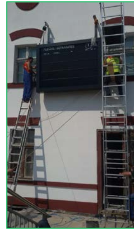
Stația Șofronea – montare panou de informare publică