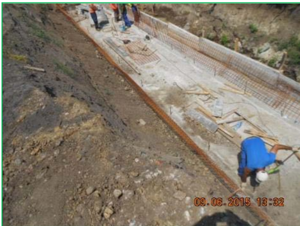
Stația Curtici – execuție bazin de evaporare