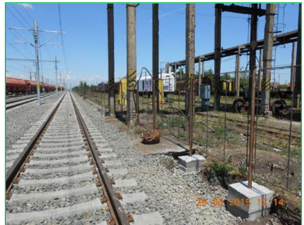
Stația Curtici – refacere gard IRV