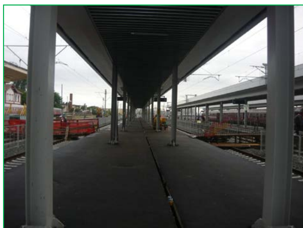
Stația Arad – pasarela – peroane