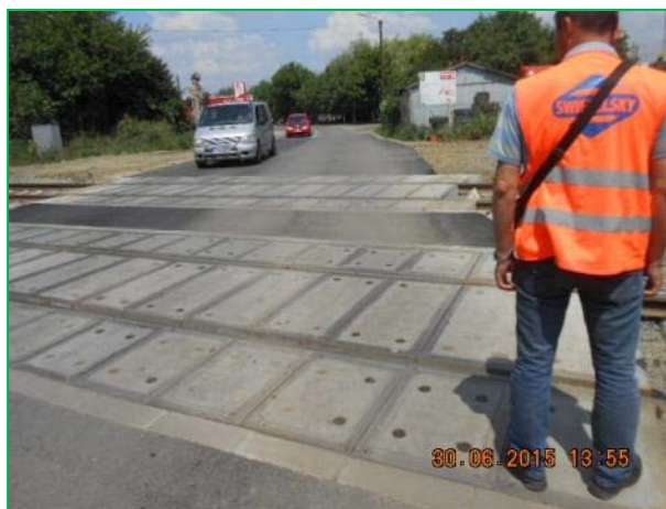
Stația Arad – amenajare trecere la nivel cu dale de beton