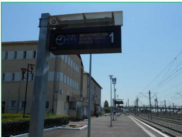
Stația Curtici – panou de afișare cu 3 linii