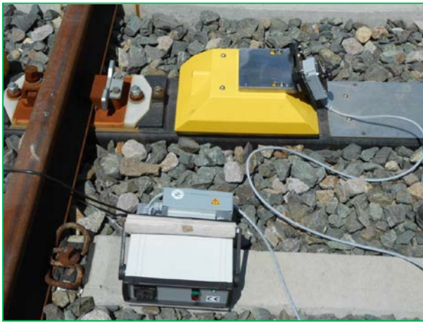
Interval Arad – Șofronea - testare senzor HBD