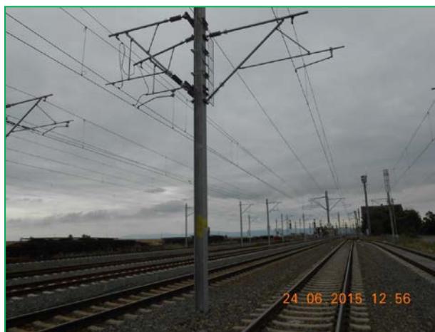
Stația Glogovăț – montare panouri protecție