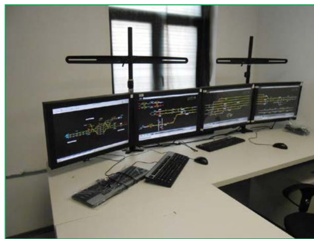
Stația Glogovăț – Post de operare IDM