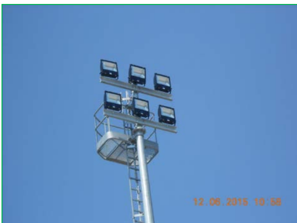
Stația Curtici – bază de montaj - pilon echipat