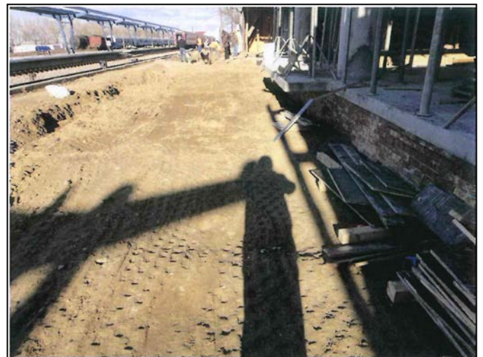
Realizare umplutură perimetrală corp A1 clădire călători