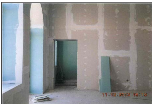
Placare cu ghips-carton în holul central parter clădire călători