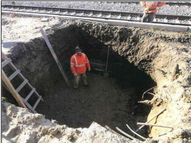
Săpătura pentru realizarea fundației stâlpului copertinei peronului principal