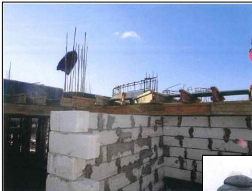
Realizare pereți de compartimentare din BCA corp A1 clădire călători