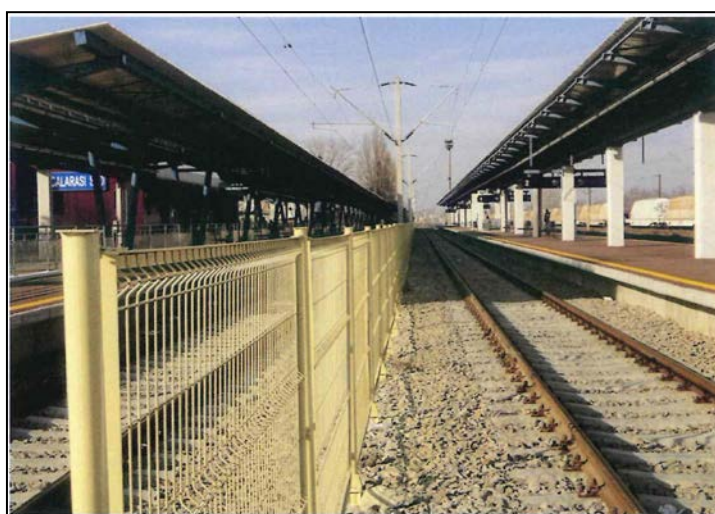
Gard de protecție între linii