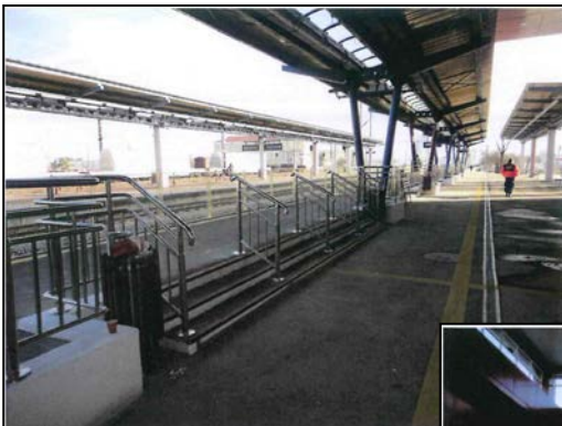
Acces peron principal Linia 1