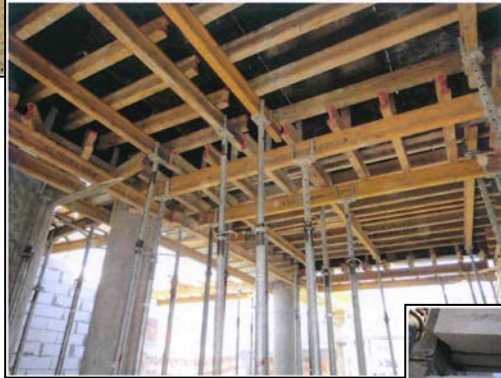
Realizare buiandrug de beton la corpul A1 clădire călători