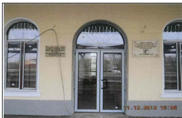
Montare tâmplărie exterioara de aluminiu