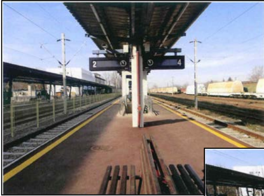
Peron intermediar linia 2 - 4