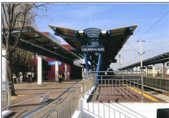
Copertină nouă peron principal linia 1 cap Y