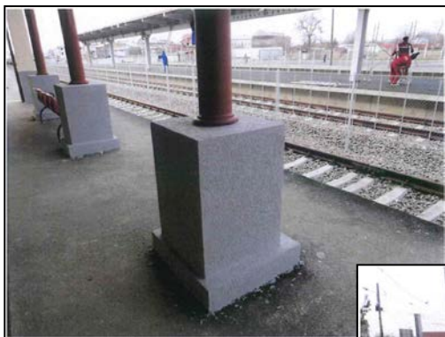
Finisare stâlpi copertină peron principal