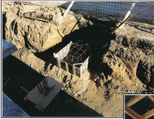
Realizare fundație stâlp copertină peron principal