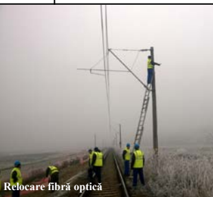
Relocare fibră optică