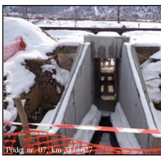
Podet nr. 07, km 311 + 627