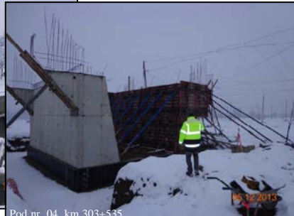
Pod nr. 04, km 303+535