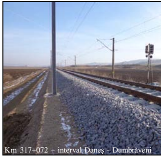
Km 317+072 - interval Daneș - Dumbrăveni