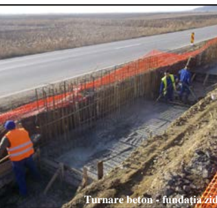
Turnare beton - fundația zidului tip L