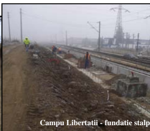
Campu Libertatii - fundatie stalpi de iluminat