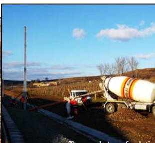
Turnare beton - fundație stâlp metalic