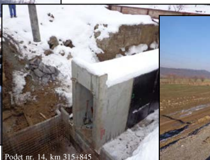
Podet nr. 14, km 315+845