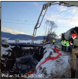
Pod nr. 14, km 321 + 657