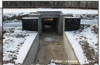
Podete - camere de cadere