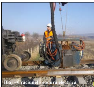
Blaj - Crăciunel - sudură electrică