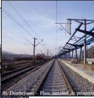
St. Dumbrăveni - Plase metalice de protecție