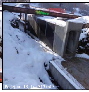
Podet nr. 13, km 315+603