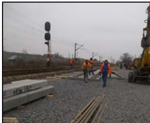
St. Crăciunel - Montare aparate de cale