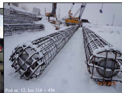
Pod nr. 12, km 318 + 456