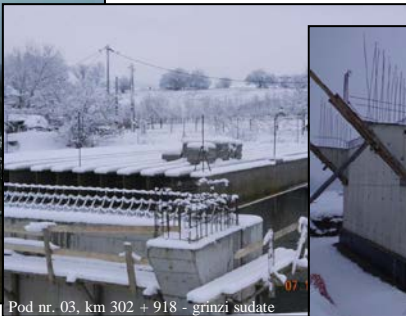
Pod nr. 03, km 302 + 918 - grinzi sudate