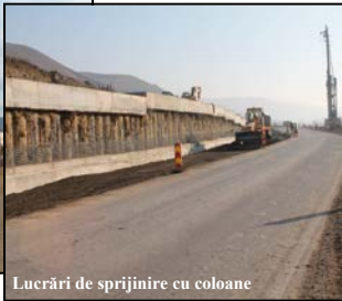
Lucrări de sprijinire cu coloane