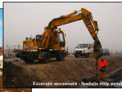
Excavație mecanizată - fundație stâlp metalic