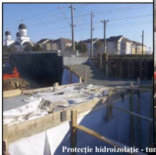
Protecție hidroizolație - tunel pietonal