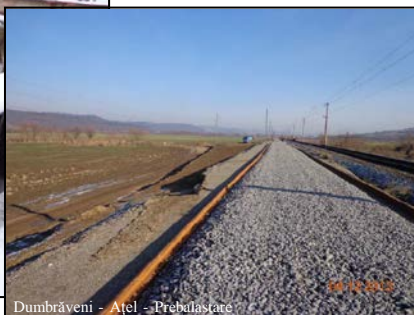
Dumbrăveni - Ațel - Prebalastare