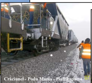
Crăciunel - Podu Mureș - Platră spartă