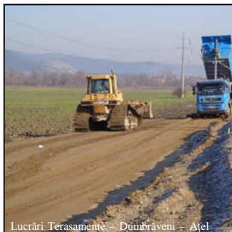
Lucrări Terasamente – Dumbrăveni – Ațel