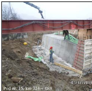
Pod nr. 15, km 324 + 088