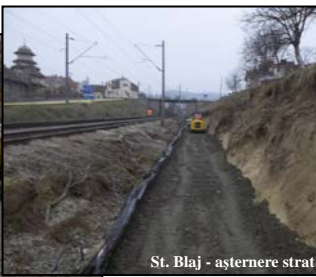
St. Blaj - așternere strat de balast