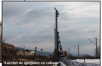
Lucrări de sprijinire cu coloane