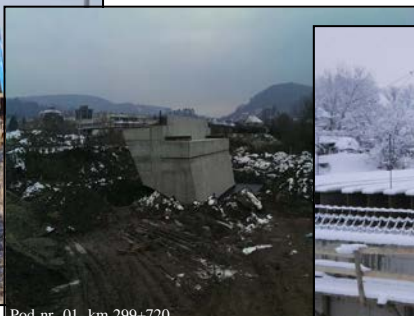
Pod nr. 01, km 299+720