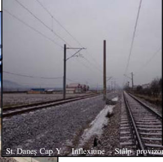
St. Daneș Cap Y - Inflexiune - Stâlp provizoriu SCB