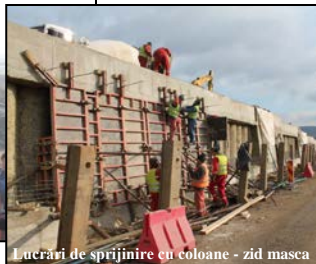
Lucrări de sprijinire cu coloane - zid masca