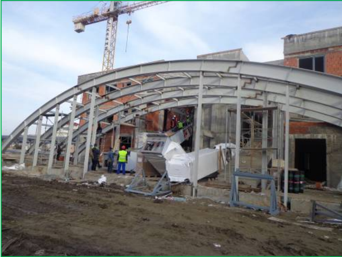
Corp A – Montare arce intrarea principală