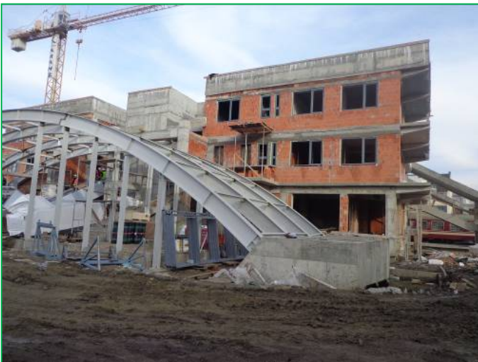
Corp A – Tâmplărie