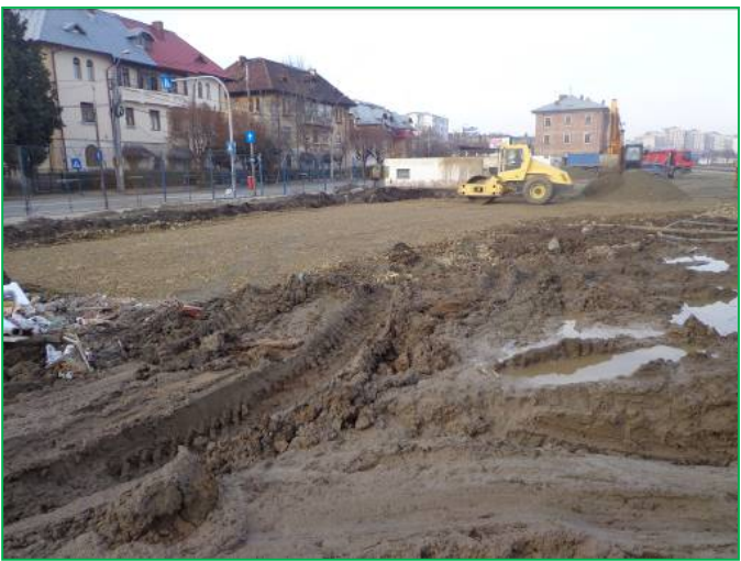
Parcare – Compactare umplutură balast Bd.Republicii