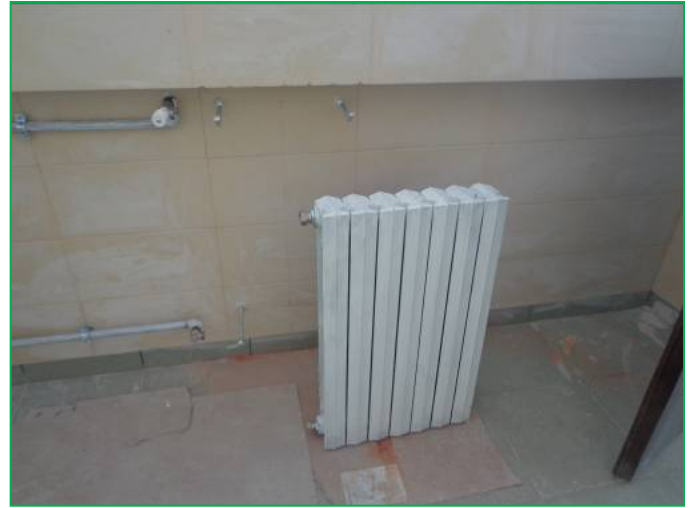
Corp C – vopsire radiatoare fontă