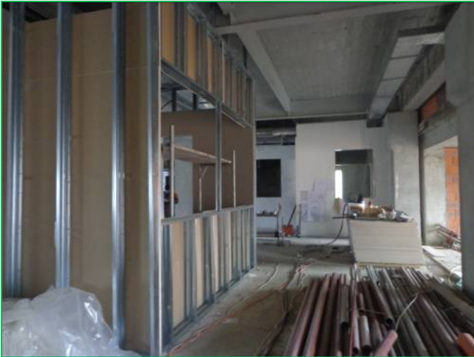
Corp B – Compartimentări gips carton