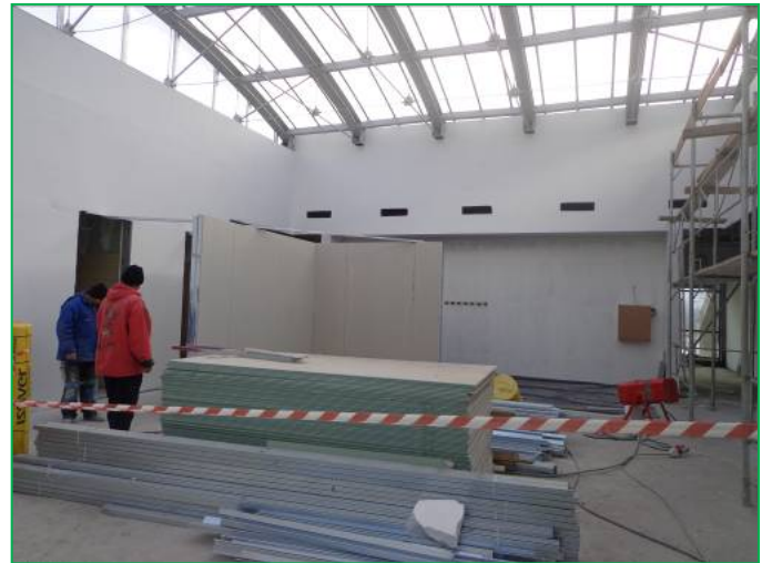
Corp B – Mascare grinzi metalice