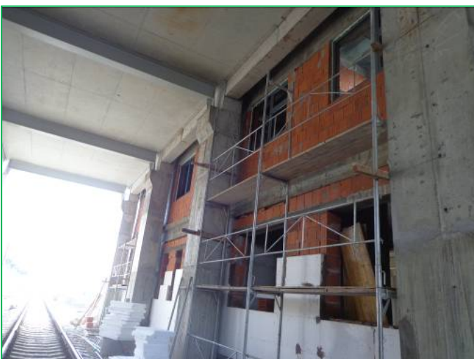
Corp B – Aplicare polistiren