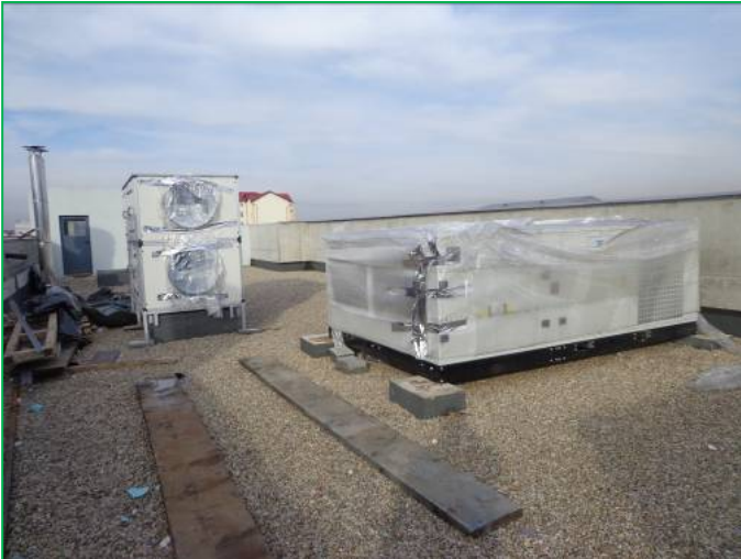
Corp C – Rooftop și recuperatoare de căldură