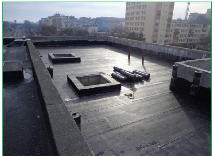
Corp A – Finalizare hidroizolație terasă