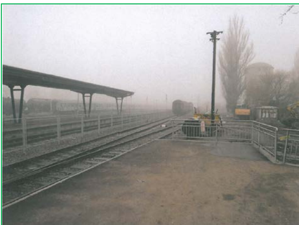
Finalizare montare balustrade la peroane