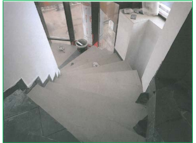
Placarea cu gresie a scării interioare, Corp A1