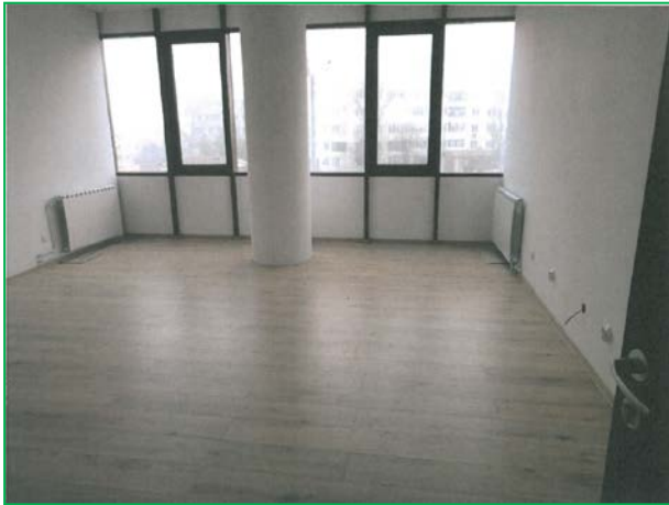
Montare parchet, instalații electrice și de climatizare