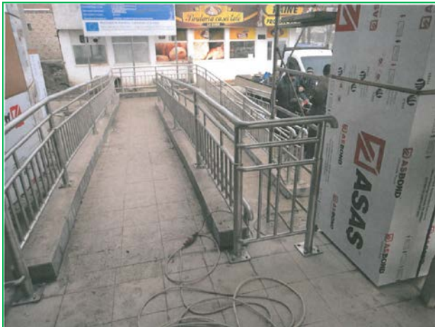
Rampă de acces