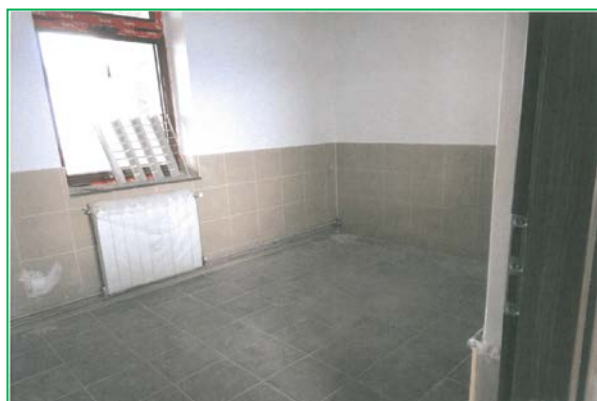
Lucrări de gresie și faianță Corp A1

* conform Raportului Lunar de Progres al Consultantului / decembrie 2014