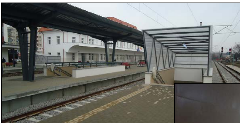
Pasajele subterane refăcute