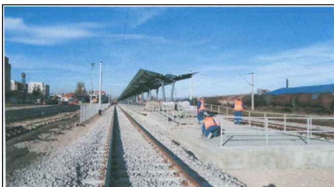
Lucrări pentru finalizarea execuției macazelor din cap. Y