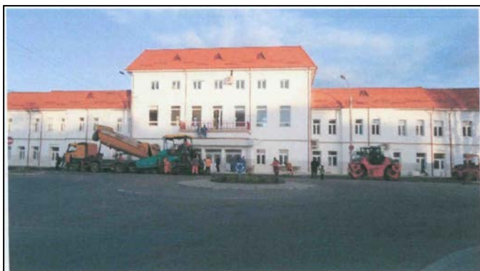
Lucrări pentru finalizarea amenajării sistemului rutier