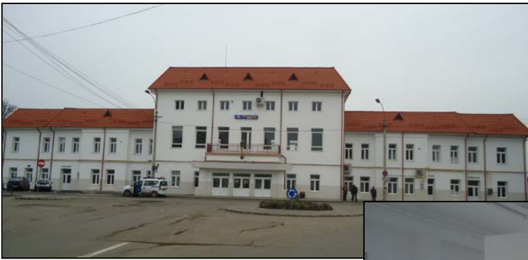
Clădirea de călători a Stația CF Sf. Gheorghe reabilitată și modernizată