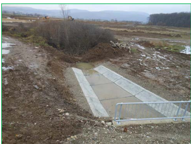
Vedere amenajare albie în aval