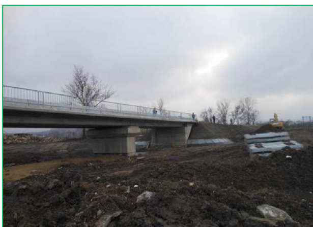
Elevație (deschiderea 6 și 7)