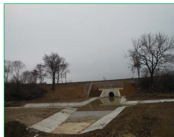
Vedere din amonte spre podeț - terasament profilat