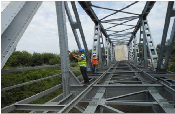
Măsurători straturi de vopsea (deschiderea 5)