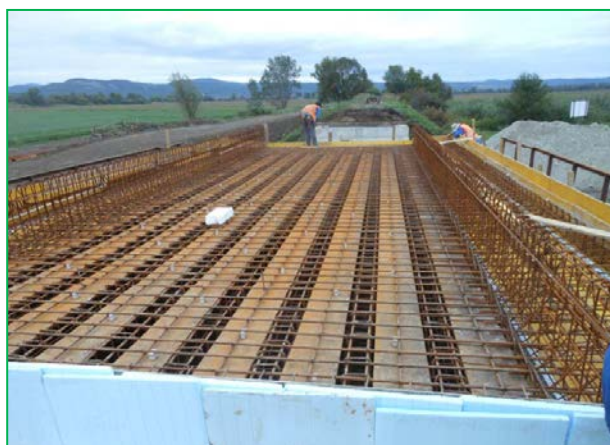
Vedere de sus – armare dală (deschiderea 2)