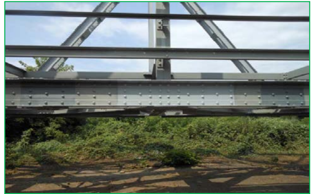
Detaliu sector etalon (cu cele trei straturi de protecție anticorozivă)