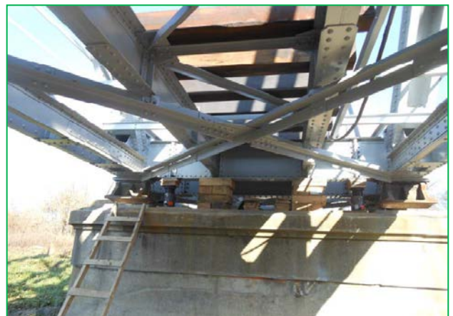
Ridicarea de pe reazeme a tablierului (deschiderea 5)