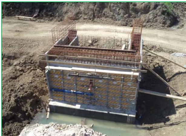
Elevație culeea C2