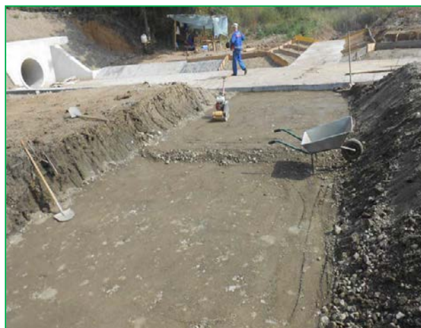
Detaliu amenajare albie amonte în lungul căii ferate