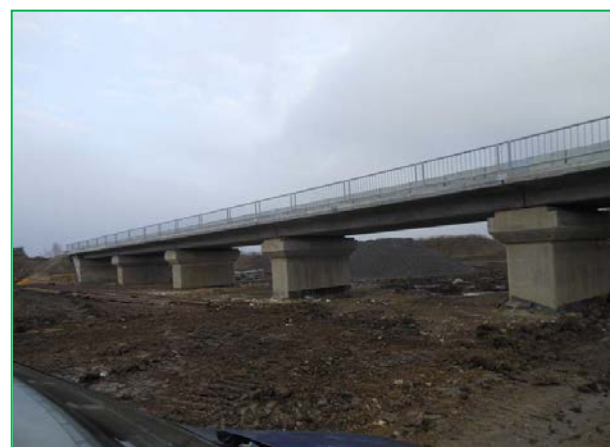
Elevație (deschiderea 1 ÷ 5)