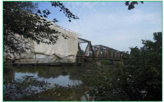
Montare schelă și cort - început sablare și grunduire (deschiderea 3)