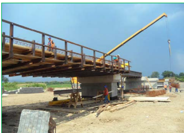
Schelă pentru cofraj - dala (deschiderea 6)