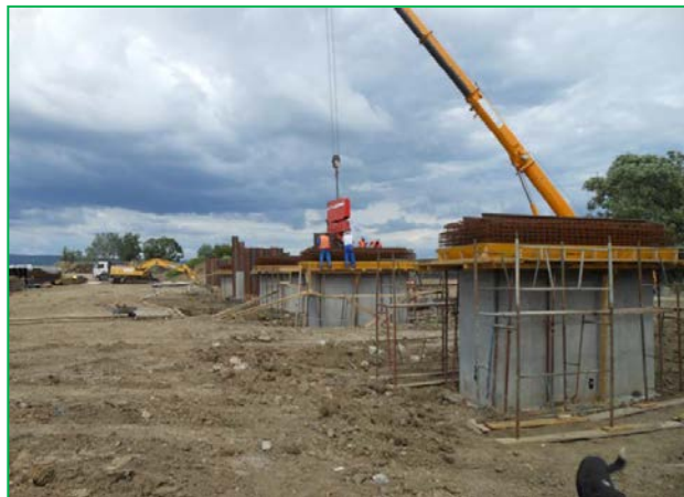
Vedere pile dinspre Lugoj – armare banchete