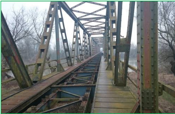
Vedere de ansamblu cu demontarea șinei și traverselor