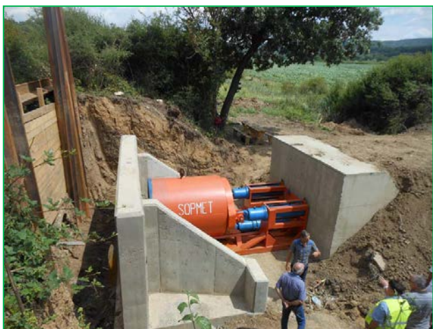
Montare scut în AMONTE pentru lansarea tuburilor prefabricate