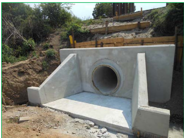
Vedere dinspre aval spre podeț