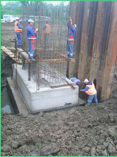
Armare pila P3