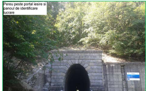
Pereu peste portal iesire si panoul de identificare lucrare