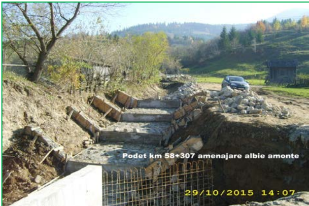
Podet km 58+307 amenajare albie amonte