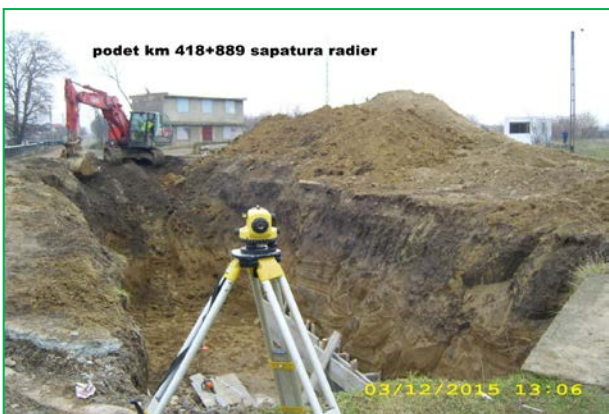
podet km 418+889 sapatura radier