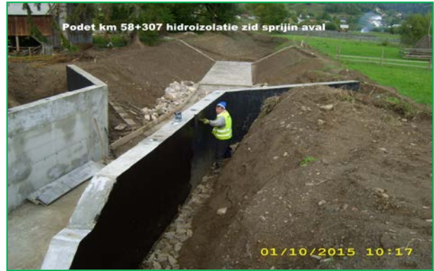
Podet km 58+307 hidroizolatie zid sprijin aval