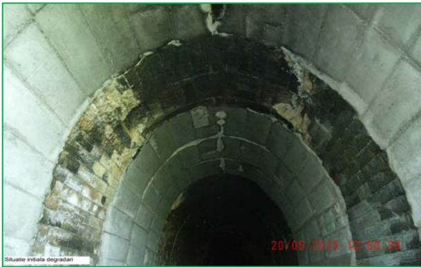
Situatie initiala degradari