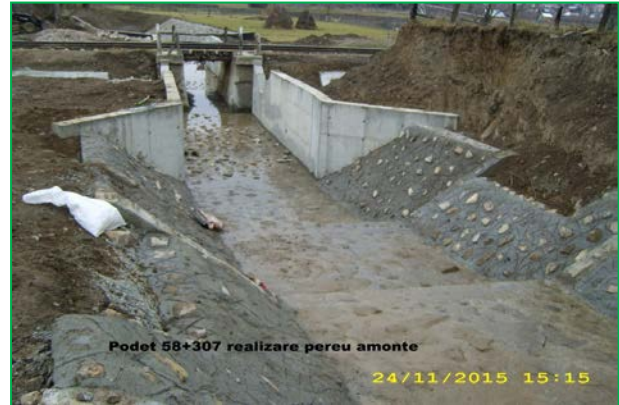
Podet 58+307 realizare peru amonte