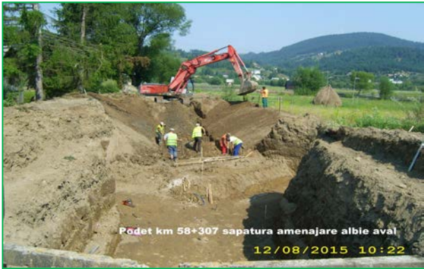
Podet km 58+307 sapatura amenajare albie aval 12/08/2015 10:22