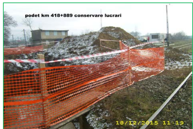
podet km 418+889 conservare lucrari