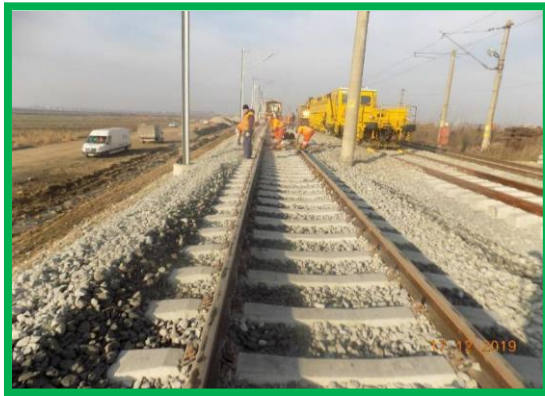
km 395+700 – buraj, sudură și montare JIL-uri