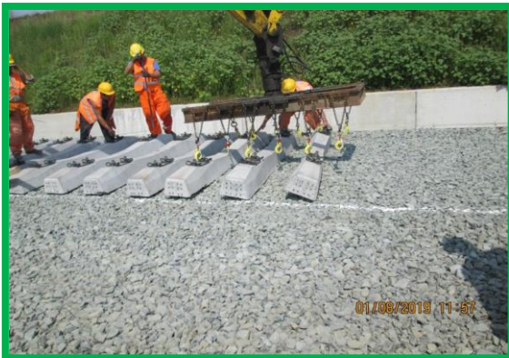
Montare suprastructura - km 454+840