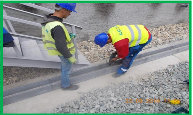
Orăștie – instalare canal de beton în tranșee tunel