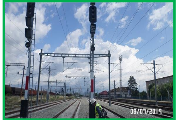
Coșlariu – instalare panouri cu LED