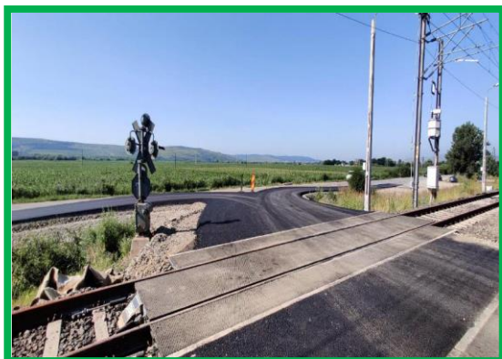
Trecere la nivel km 394+598