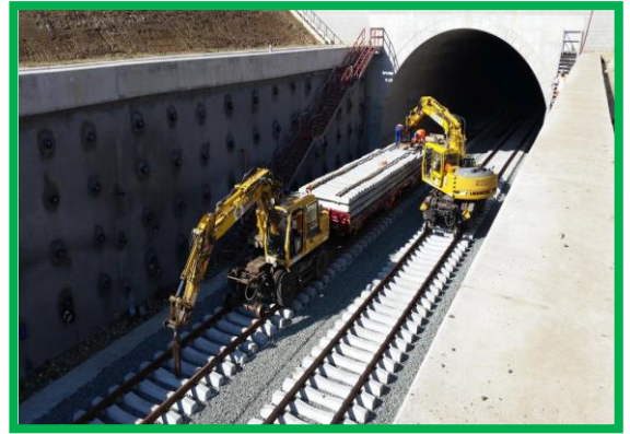
Montare cadru șină – traversă - zonă tunel Turdaș