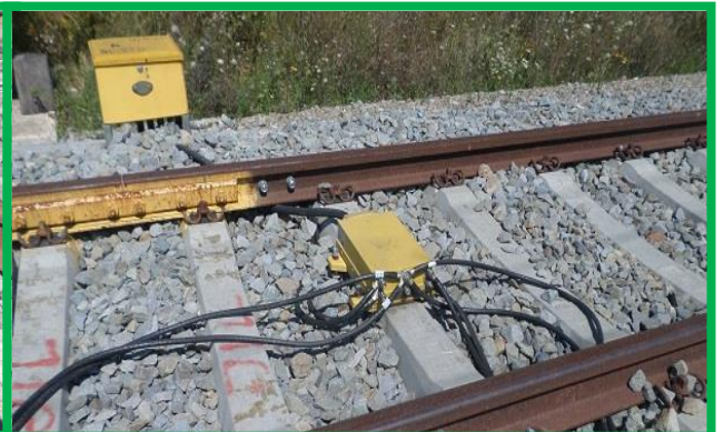
Alba Iulia – instalare funie specială și cutie aparataj, iulie