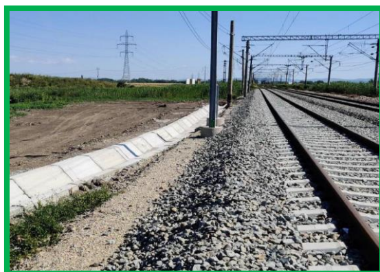
km 401+820 – execuție șanț monolit