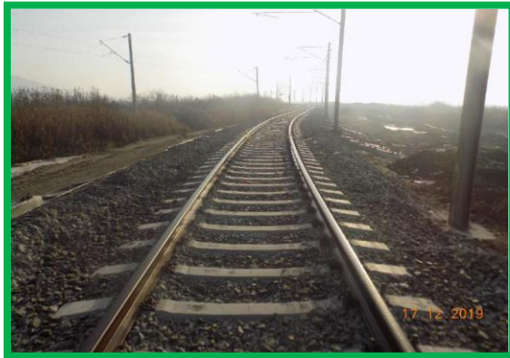
km 396+750 – execuție buraj