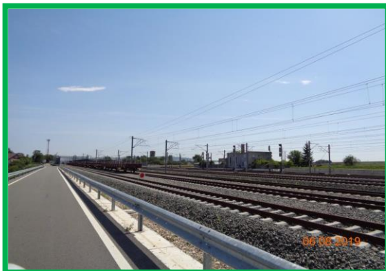
Stația Vințu de Jos - lucrări finalizate