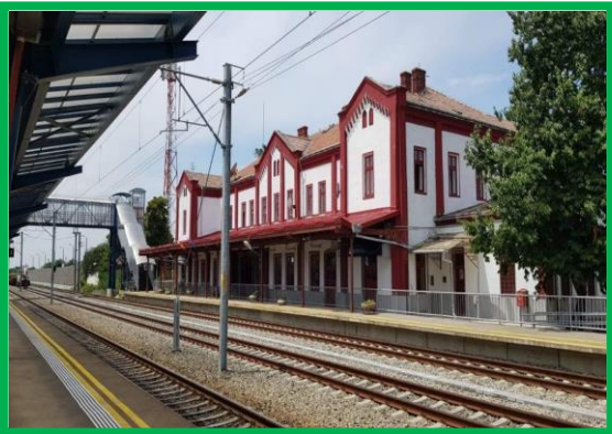
Stația Vințu de Jos