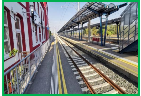
Stația CF Orăștie – marcaje podotactile peroane