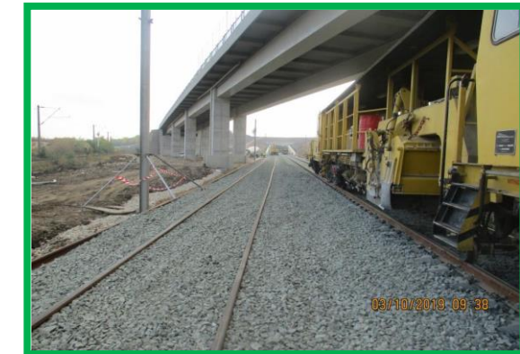
Buraj - km 457+450