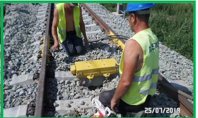
Coșlariu – instalare semnal pitic și bobină de joantă