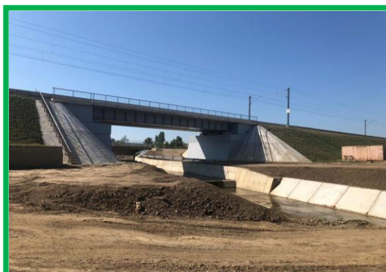
Pod km 431+974