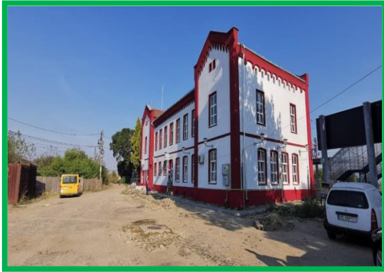
Stația CF Orăștie - clădire călători