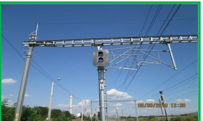
Sântimbru – instalare panouri cu LED