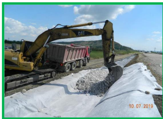
km 395+950 – execuție saltea de anrocamente