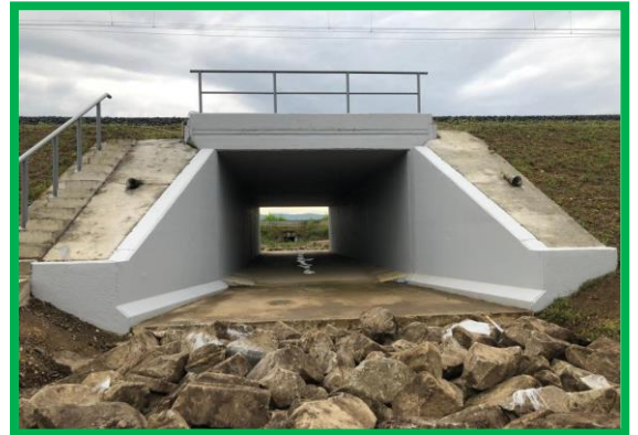
Impermeabilizarea suprafețelor – podeț km 433+389