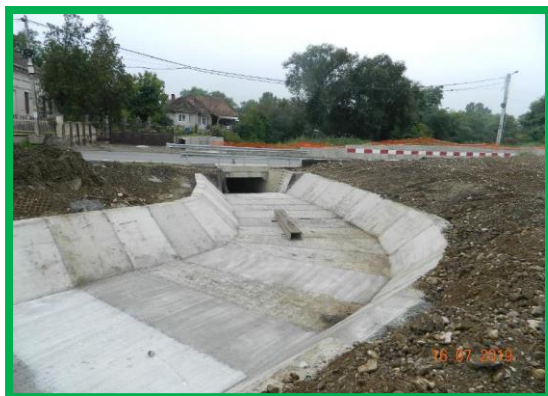
Poduț km 401+056 - amenajare albie aval