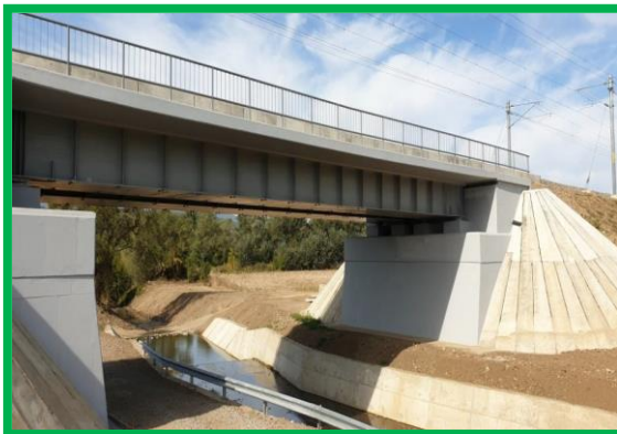
Amenajarea albie - pod km 431+974