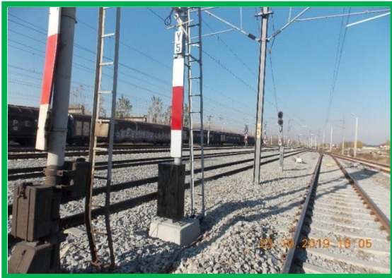
Bărbănt – sclivisire fundație semnal