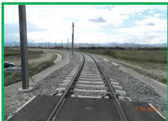
km 396+900 - piatră spartă și montare suprastructură