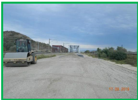
km 395+450 – așternere PSS