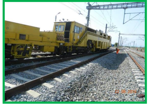
km 408+400 – așternere piatră spartă