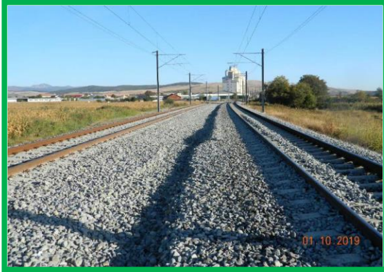
km 408+750 – așternere piatră spartă între linii