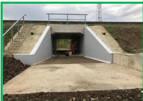
Impermeabilizarea suprafețelor – podeț km 434+270