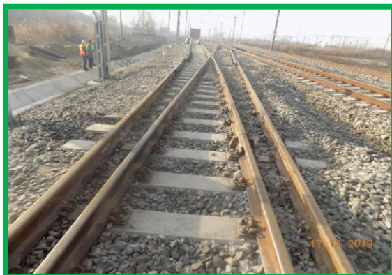
km 402+575 – execuție buraj și sudură