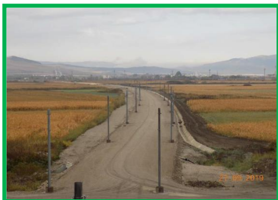
km 396+300 – așternere PSS și plantare stâlpi LC