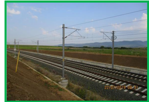
Profilare taluz - km 450+637 - 451+340