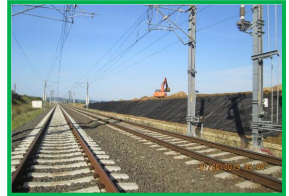
Montare georețea - km 452+980