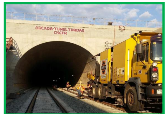
Lucrări de sudură electrică - zonă tunel Turdaș