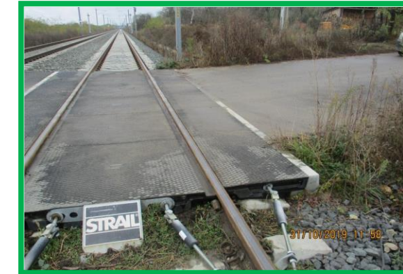
Trecere la nivel cu calea ferată - km 459+805