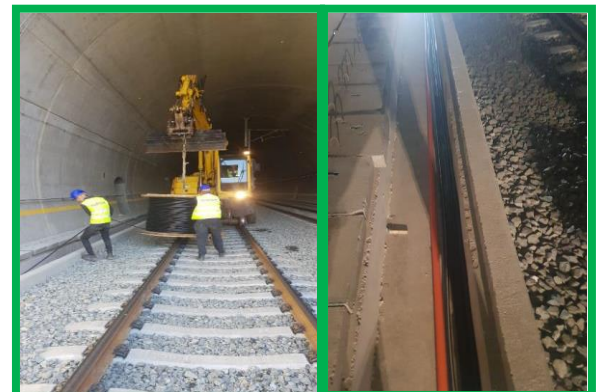
Orăștie – instalare cabluri în canal beton