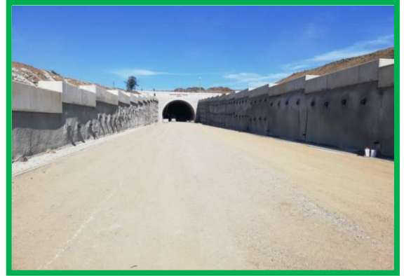
Tranșee Turdaș –km 457+075 – 457+265