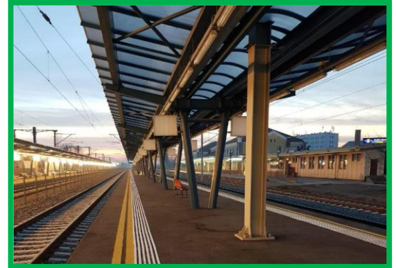
St. Alba-Iulia – realizare marcaje tactile