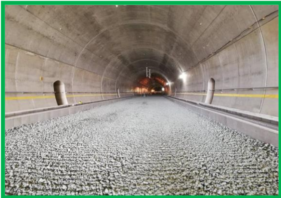
Tunel artificial - semnalizare - km 456+295 – 457+075