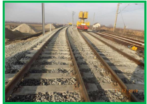
km 395+860 – buraj, sudură și montare JIL-uri