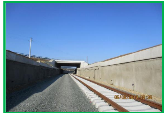
Montare cadru șină – traversă - km 455+450