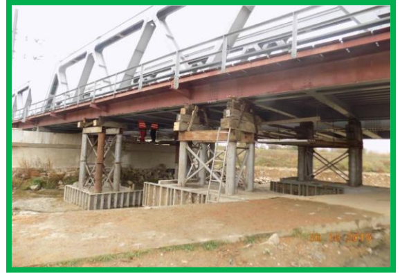
Pod km 409+395