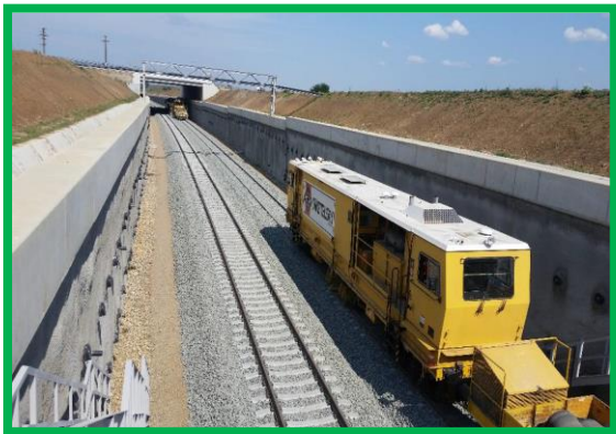
Buraj, profilare și stabilizare cale - zonă tunel Turdaș