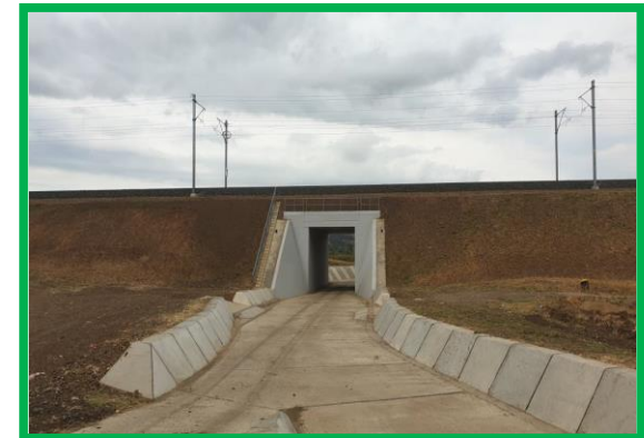
Poduț km 430+194