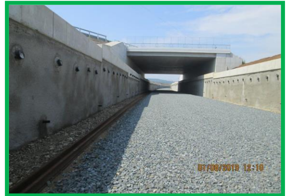
Așternere piatră spartă - km 455+500