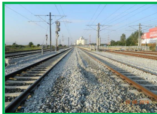
km 407+675 – așternere piatră spartă