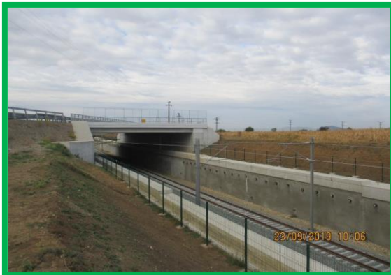
Gard de protecție - km 455+650