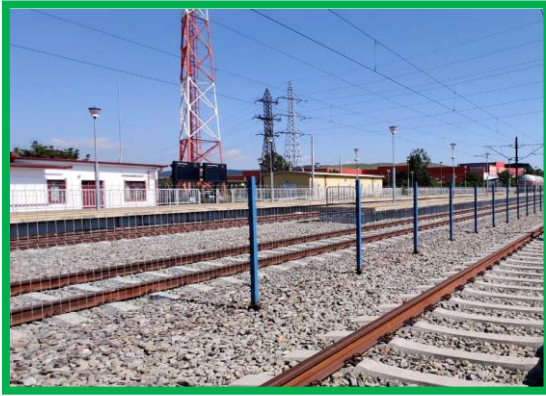
km 407+925 – montare gard între linii