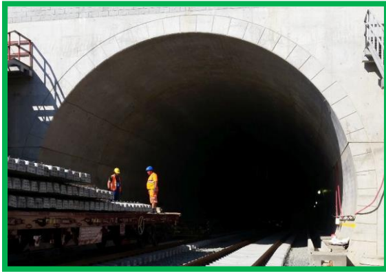
Lucrări de suprastructură - zonă tunel Turdaș