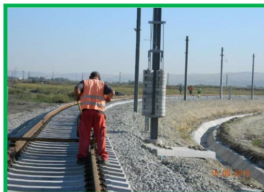
km 397+150 - piatră spartă și montare suprastructură