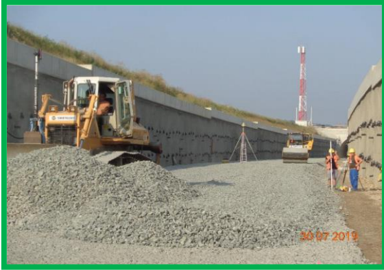
Orăștie – Simeria - lucrări la platforma de piatră