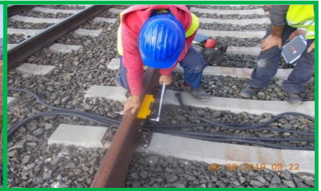
Vințu de Jos – instalare sistem de detectare a roților