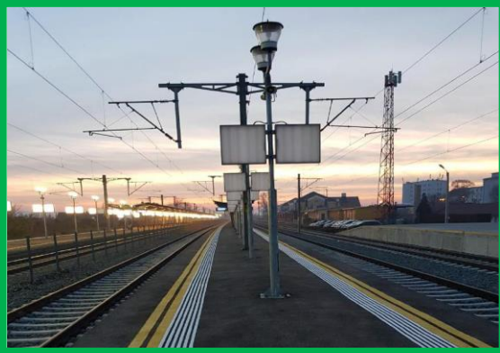
St. Alba-Iulia – realizare marcaje tactile