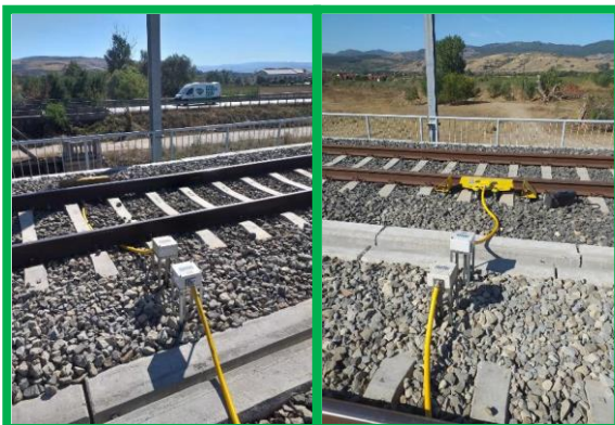
Vințu de Jos – instalare inductori