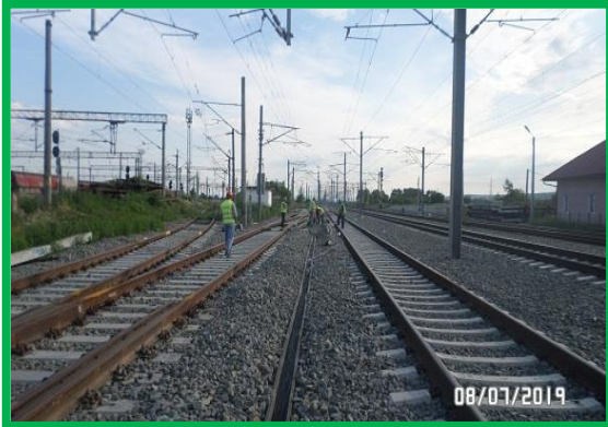
Coșlariu – instalare canal cablu