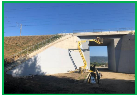
Impermeabilizarea suprafețelor văzute - poduț 430+713