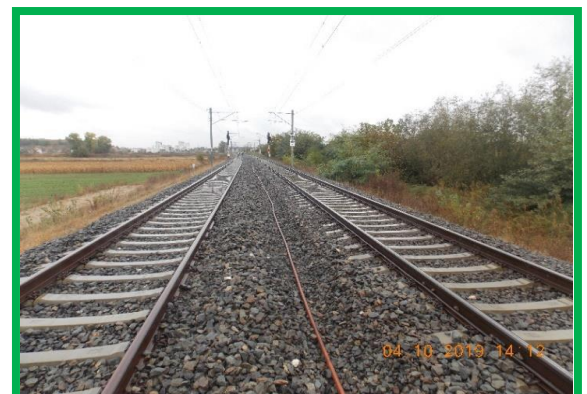
Alba Iulia – instalare cabluri în duct