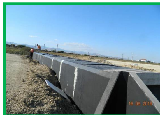
Poduț km 397+539 – hidroizolație și execuție umplură