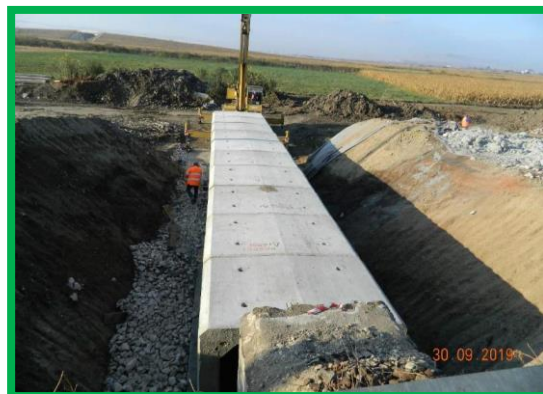
Podet km 396+132