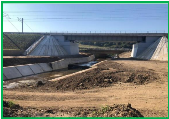
Scurgerea apelor - pod km 431+974