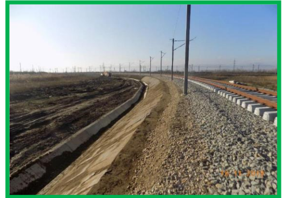
km 396+950 – profilare și așternere vegetal pe taluz