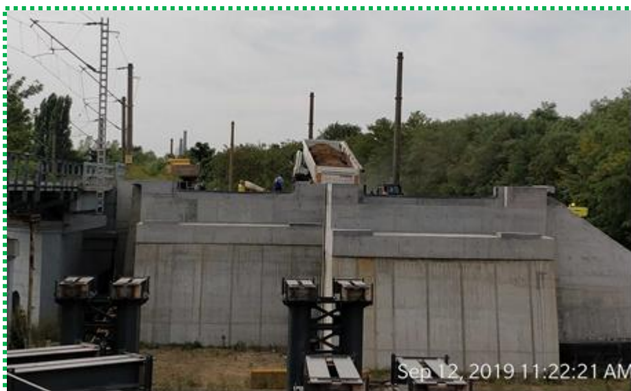
Execuție umpluturi în spatele culeelor – cap X