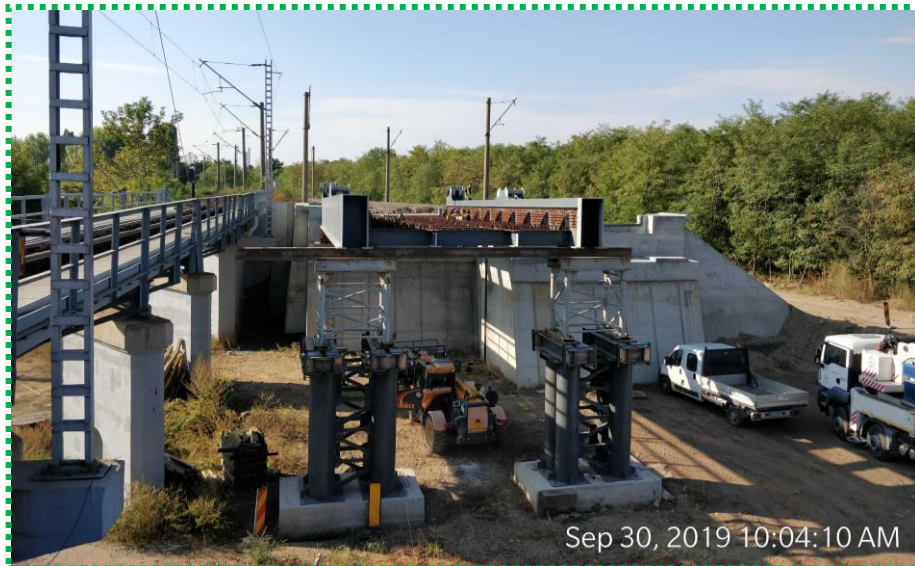
Montare subansambluri tablier Fir I