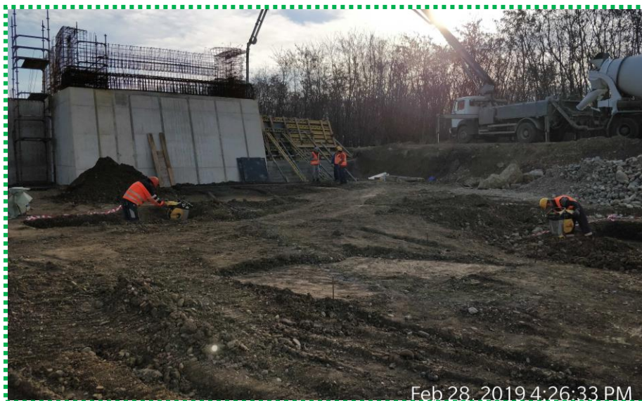
Turnare beton elevație A-1 – etapa I