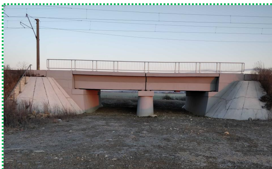
Vedere laterala tablier reabilitat