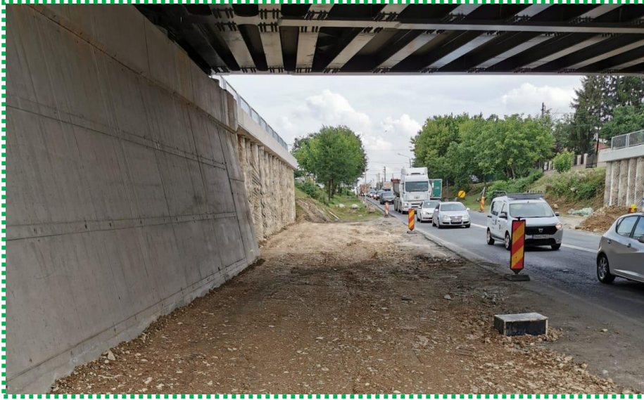
Impermeabilizare zona libera – strat balast