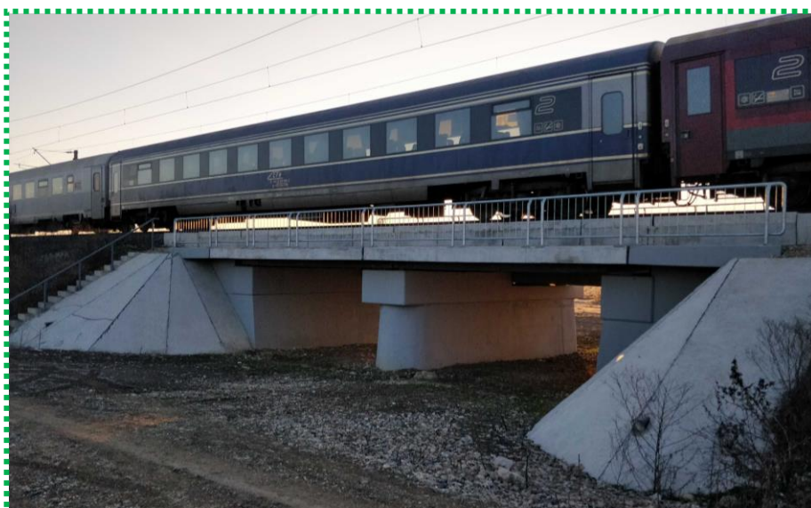
Vedere laterală Fir I - în exploatare

Pod km 21+888 linia de cale ferată BUCUREȘTI - VIDELE