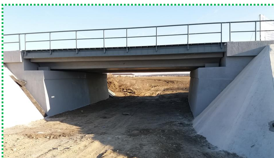
Tablier existent reabilitat și poziționat pe reazeme

Pod km 21+888 linia de cale ferată BUCUREȘTI - VIDELE