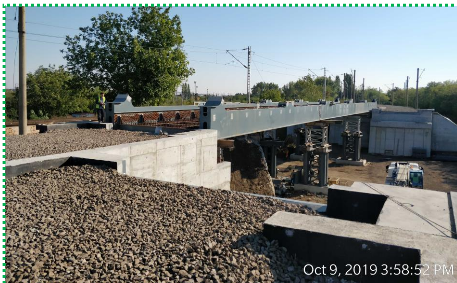
Parte inferioară tablier Fir I – montată