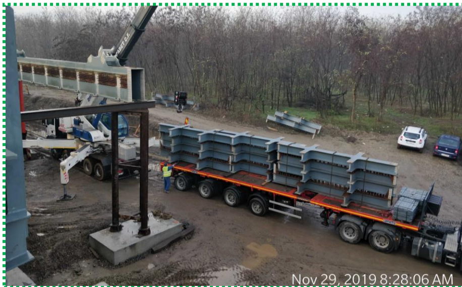
Antretoaze tablîer Fir II