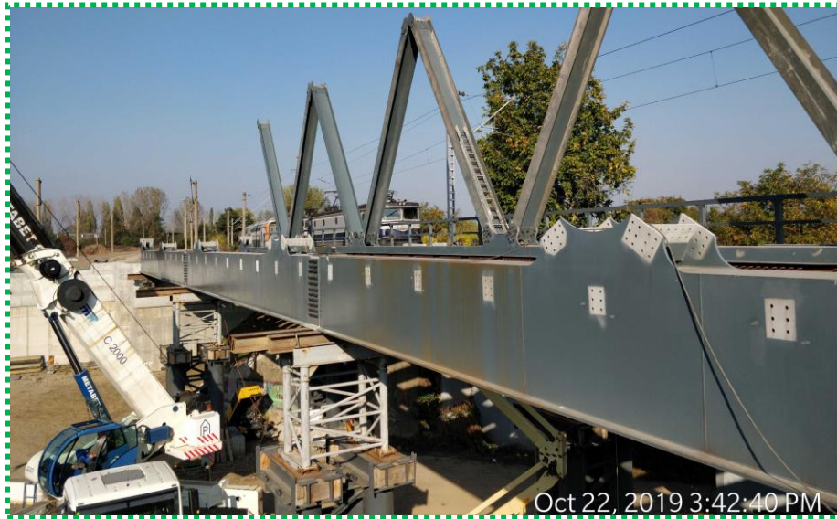
Montare subansambluri tablîer Fir I - diagonale