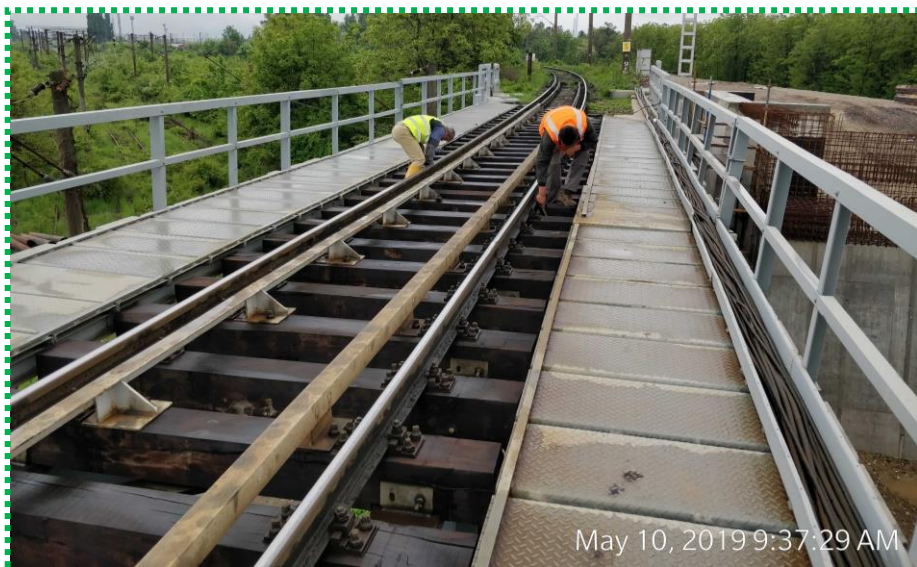
Monitorizare pod-verificare izolatori si prinderi joante