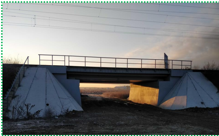
Tablier reabilitat Fir I – în exploatare