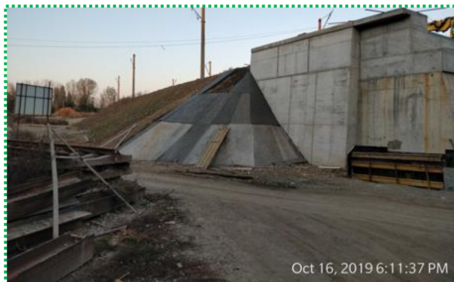
Execuție peruu din beton la sfert de con