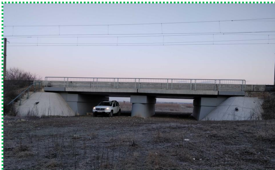
Vedere laterală Fir II – în exploatare