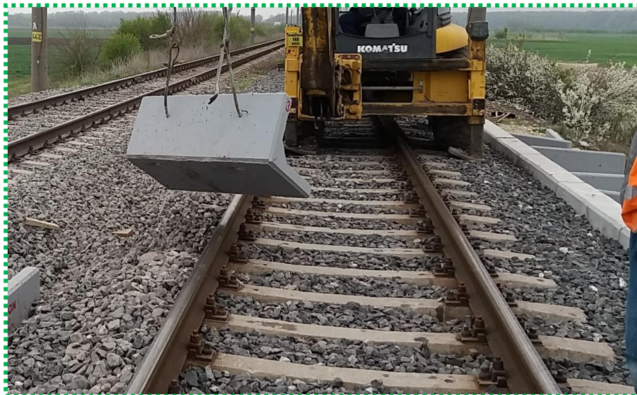
Montare prefabricate "L" la capetele podului