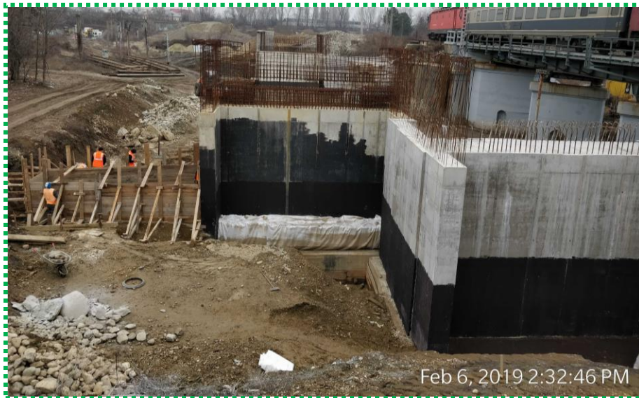
Cofrare radier aripa A-1