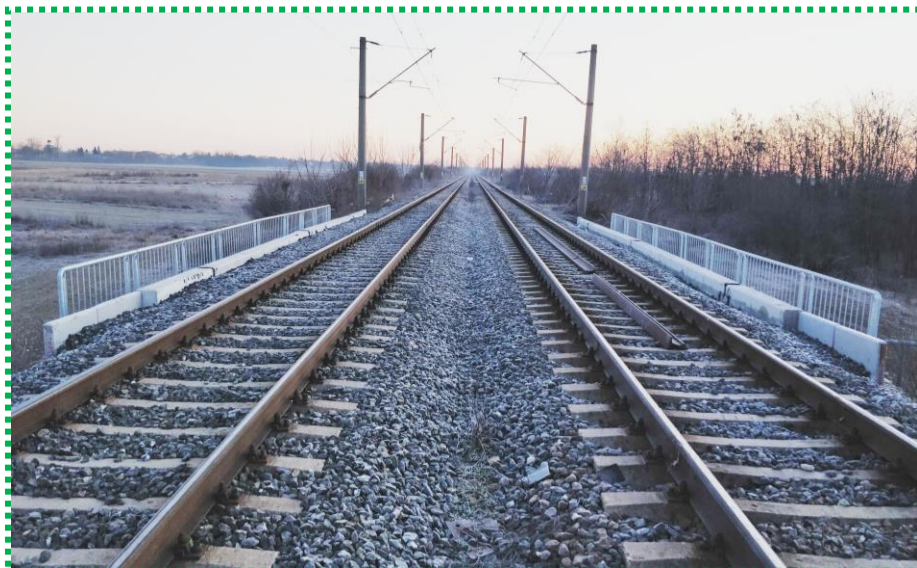
Suprastructură - în exploatare

Pod km 21+434 linia de cale ferată BUCUREȘTI – VIDELE