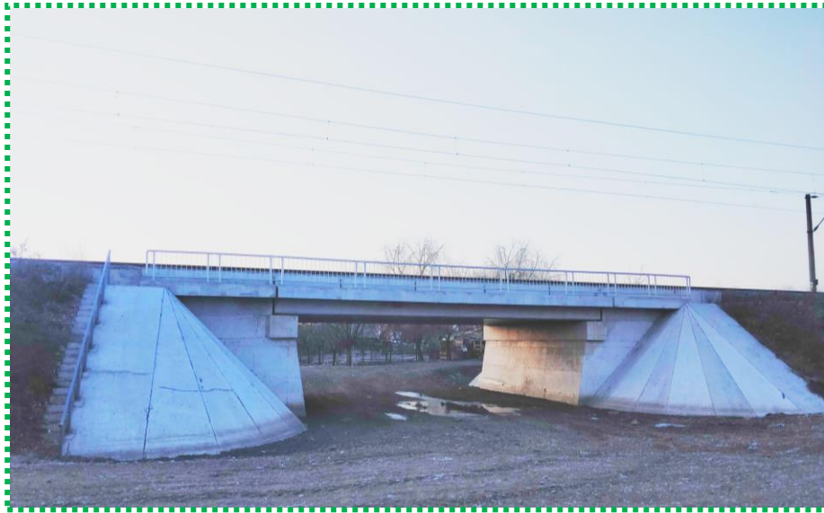
Vedere laterală Fir I – în exploatare