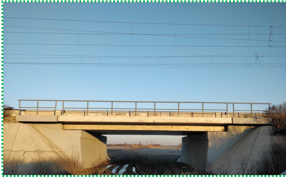
Vedere laterala tablier receptionat Fir II