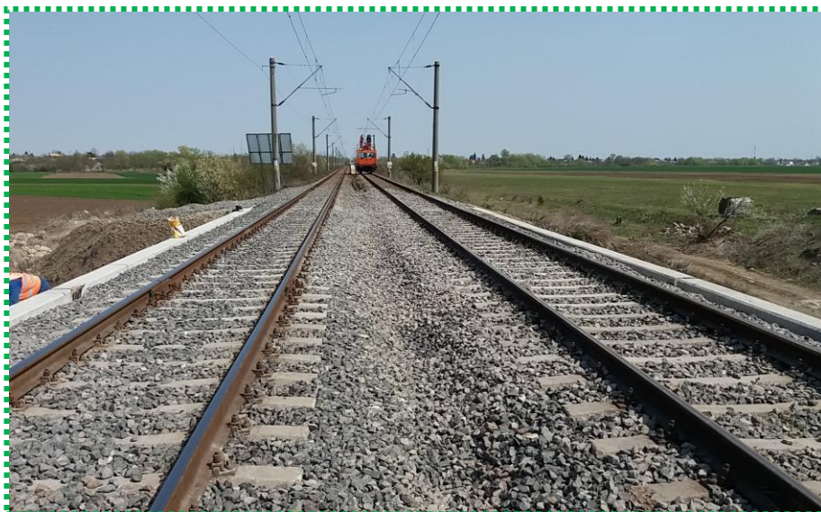
Verificare geometrie LC