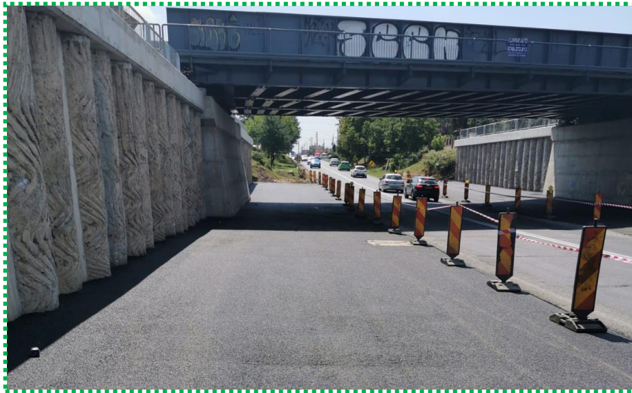
Impermeabilizare zona libera – strat beton asfaltic