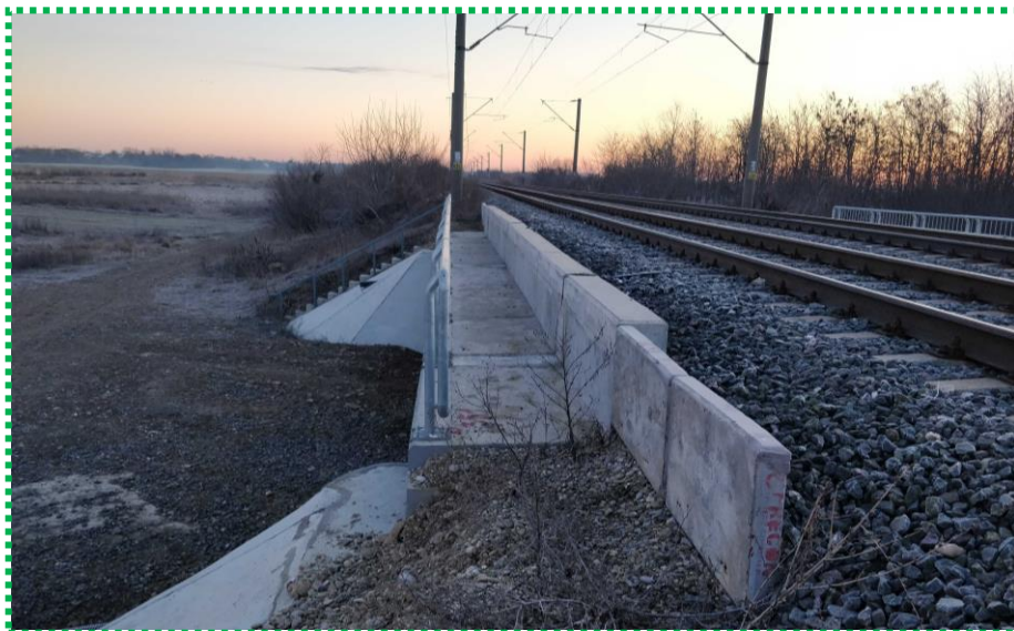
Suprastructură - în exploatare