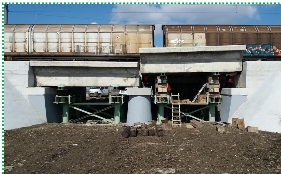
Tablier existent susținut pe palei pentru reparații

Pod km 21+434 linia de cale ferată BUCUREȘTI – VIDELE