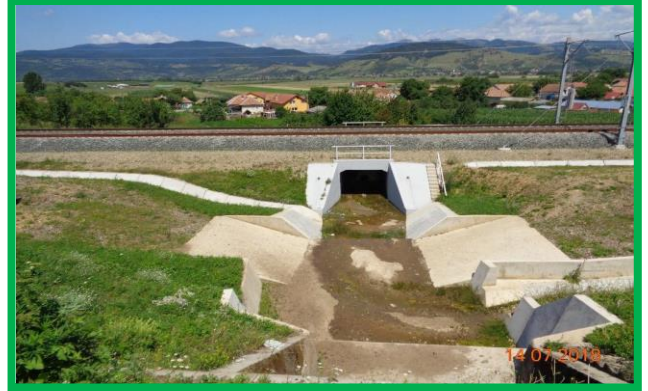
Vințu – Blandiana, podeț km 424+708 - Lucrări finalizate