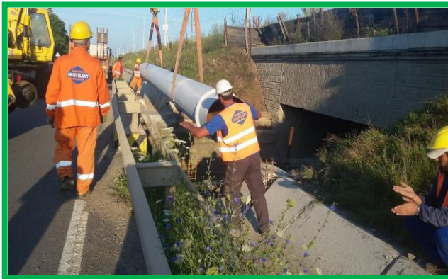
Stația Vințu de Jos - podeț km 423+221