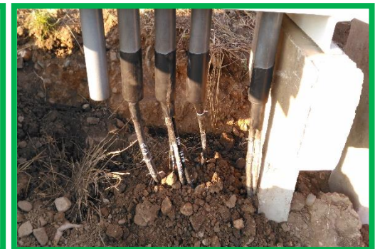
Șibot – instalare cabluri în dulap