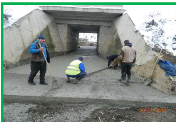
Podeț km 402+125 pr.– Amenajare albă