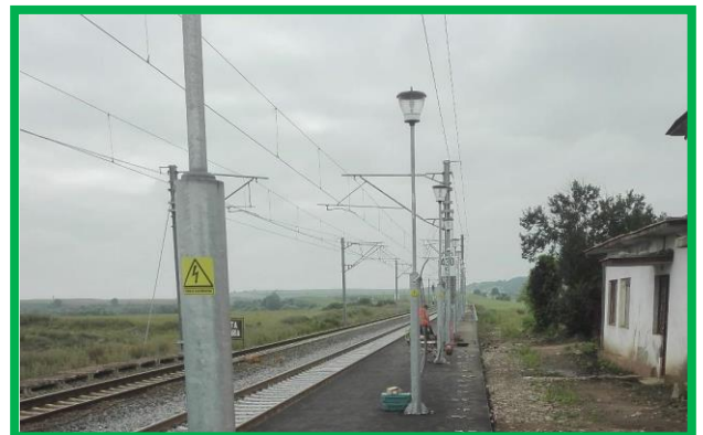
P.O. Tărtăria, fir II – Peron