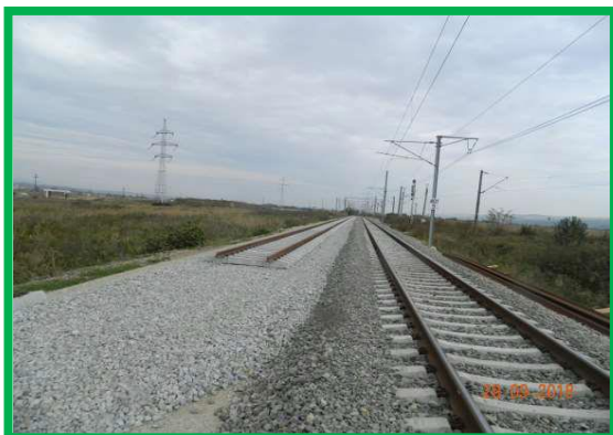
Pod km 401+900 ex. Fir 1 – Montare suprastructura