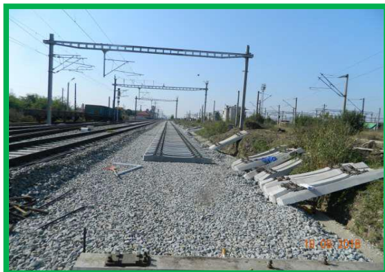
Km 402+800 ex. Fir 1 - Montare suprastructura Linia 3