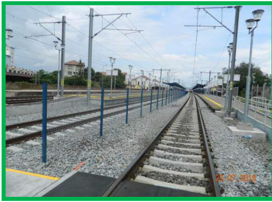
Stația Alba-Iulia – Realizare gard între liniile 3-4