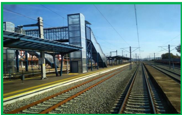
Stația Vințu de Jos, km 423+300 - Lucrări finalizate