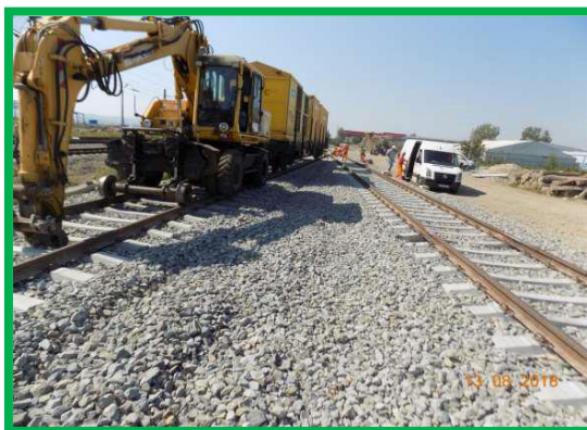
Stația Barabaș Liniile 9, 10, 11 – Sudura sine