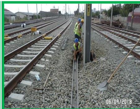
Alba Iulia – instalare fundație semnal pitic și canal beton