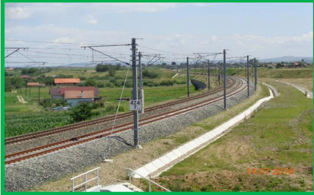
Interval Vințu – Blandiana, km 424+700 - Lucrări finalizate