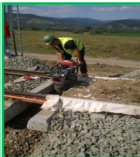
Blandiana – subtraversare dublă