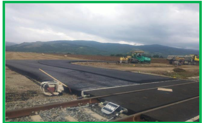
Șibot – Blandiana, km 429+014 - km 435+985 linia de contact