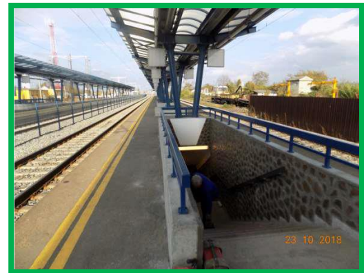
Stația Alba-Iulia – Amenajare scări tunel peron