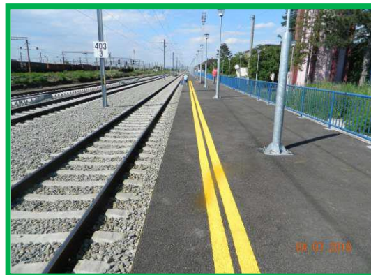
Staţia Coşlariu – Realizare marcaje Peron Principal