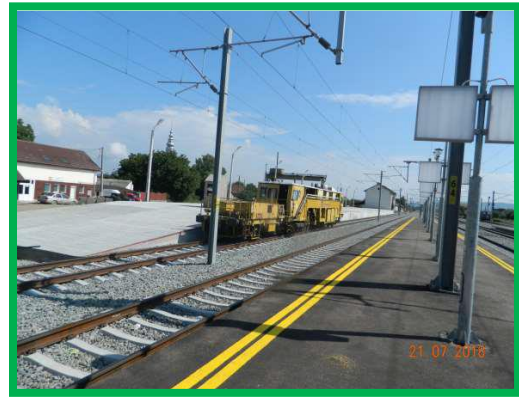
Stația Alba-Iulia – Realizare rampa și marcaje peron