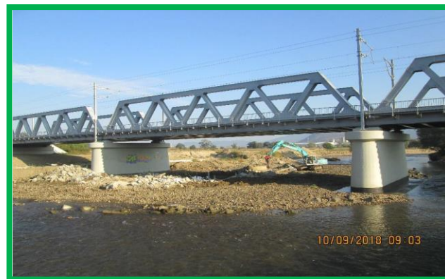
Km 462+900 - Amenajare dig