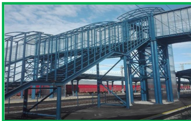
Stația Șibot – Pasarela pietonală