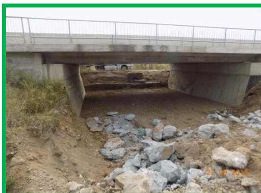
Pod km 410+727 pr. – Amenajare albă