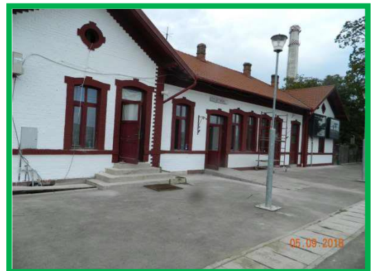
Stația Sântimbru – Reabilitare fațadă