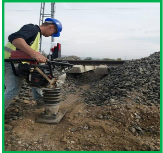
Bărăbaș – subtraversare și compactare