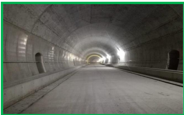
Km 456+739 – km 456+829 – Zona de tunel