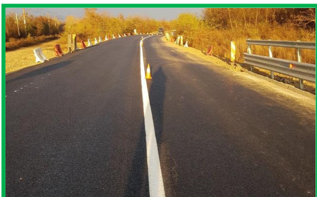
Rampă Orăștie, pasaj km 457+431