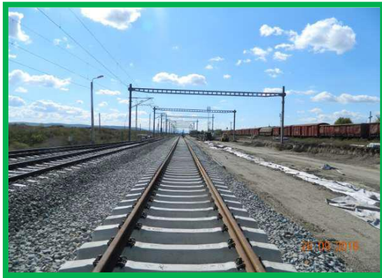
Km 403+850 ex. Fir 1 – Montare suprastructura Linia 3