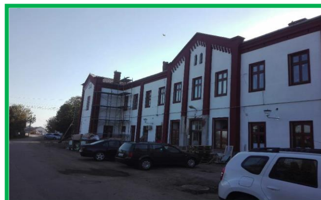
Stația Vințu de Jos - Clădire călători