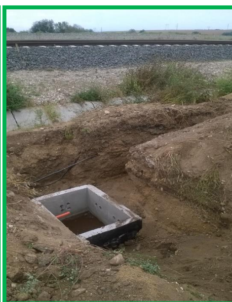
Vințu de Jos – instalare camerete