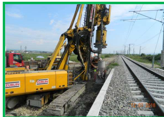
Pod km 402+000 ex. Fir 1 - Execuţie coloane fundaţie