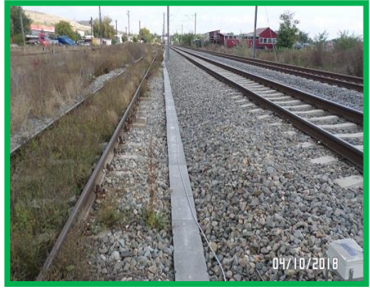
Bărăbaș – instalare cameretă și canal beton