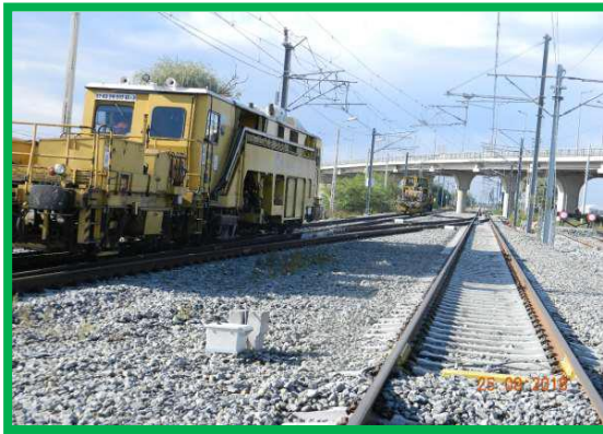
Km 413+050 pr. Fir 1 – Execuție buraj