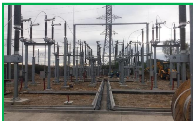
Substația de tracțiune, km 436+550