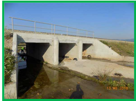
Alba-Iulia - Sibiu – Podeț km 0+634 pr.