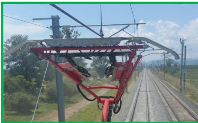
Trecere la nivel km 439+327,80