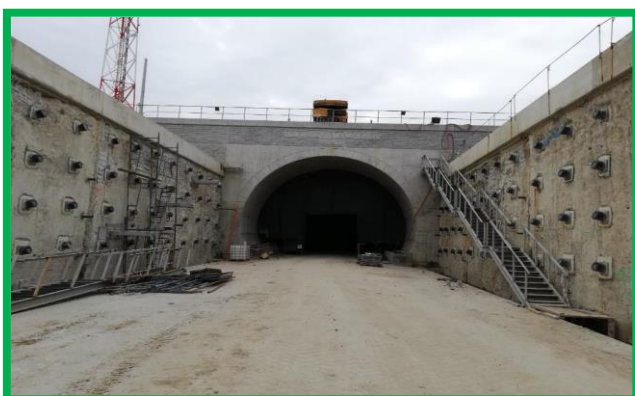
Tunel Turdaș – Portal intrare