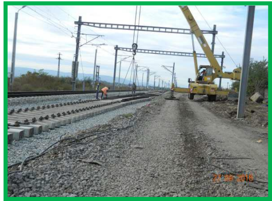
Km 404+100 ex. Fir 1 – Montare suprastructura si schimbătoare