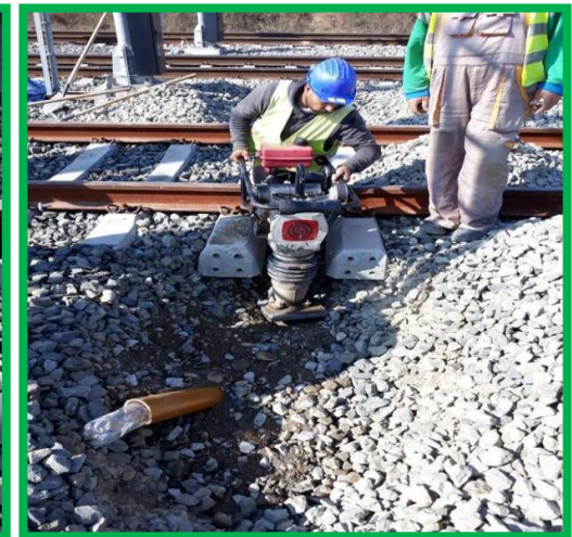
Blandiana – subtraversare și compactare