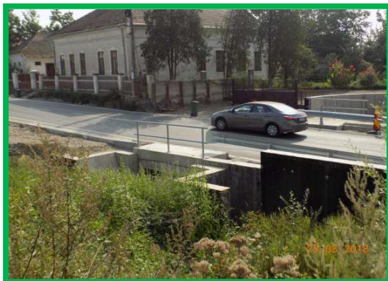
Pasaj km 401+247 pr. – Montare parapet rutier DJ 107B si balustradă