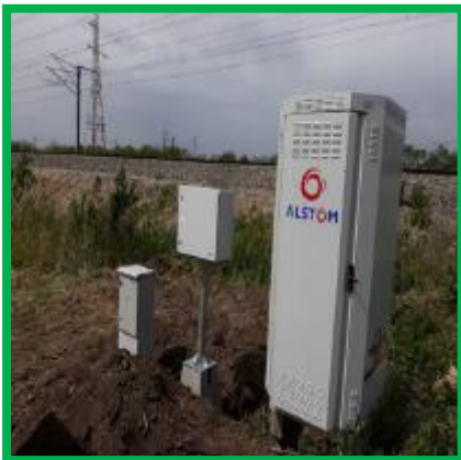
Coșlariu – instalare dulap LX