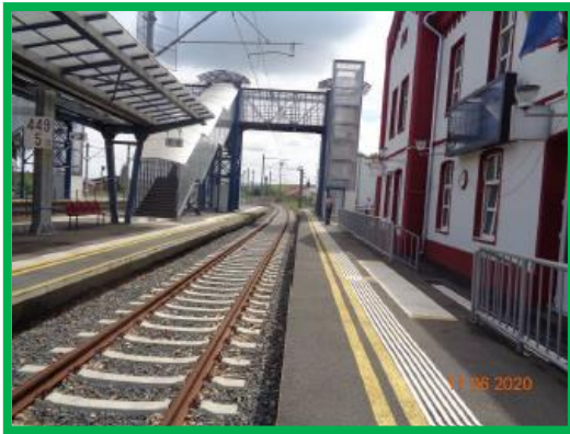
Statia Orastie / km 449+500