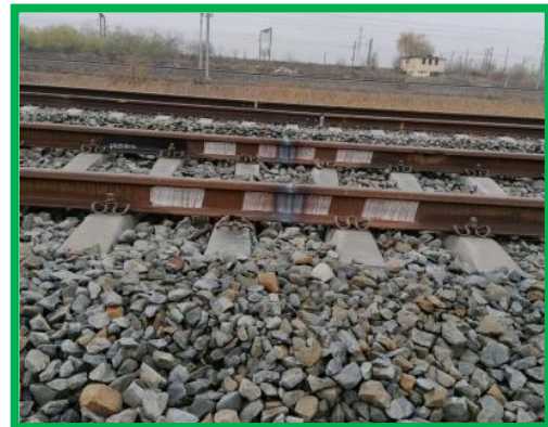
Var HM Podu Mures – Sudura