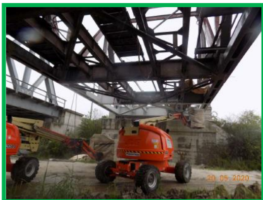
Pod km 396+222 HM Podu Mures