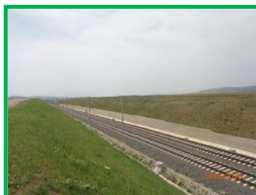
Interval Orastie – Simeria / varianta 5 de traseu nou