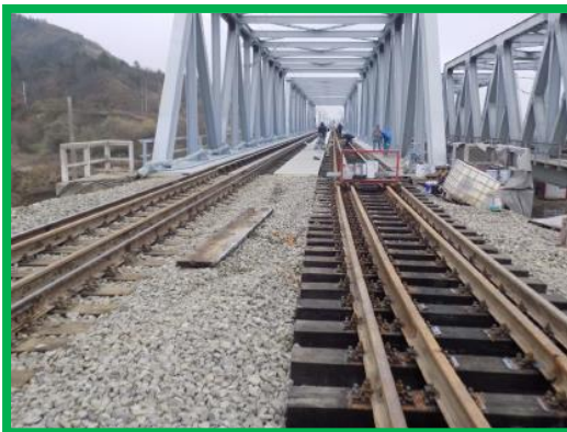
Pod km 395+222 HM Podu Mures