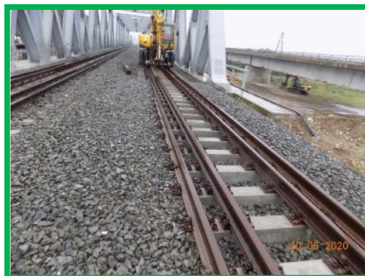
Pod km 396+200 Var Podu Mures – Coslariu