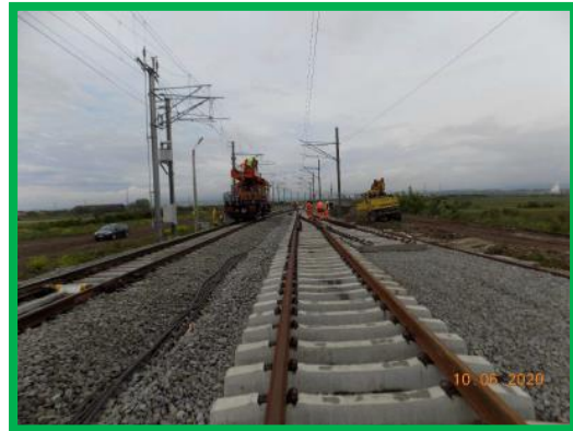
HM Podu Mures – Montare schimbator