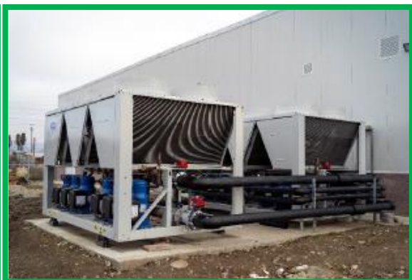
Simeria OCC – unități climatizare