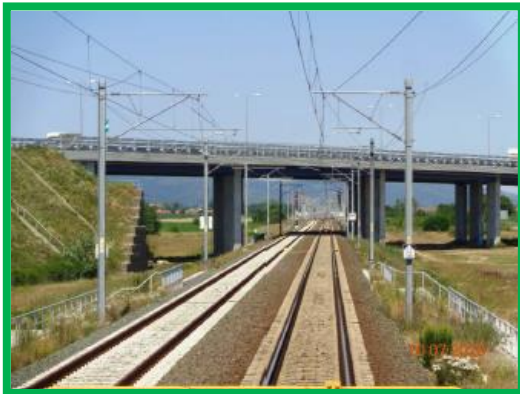
Statia Aurel Vlaicu / km 444+700