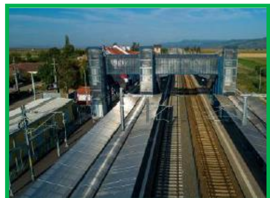
Statia Sibot aerial view zona peron