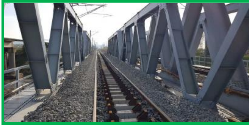
Pod km 399+706 St Coslariu