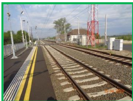
PO Simeria Veche