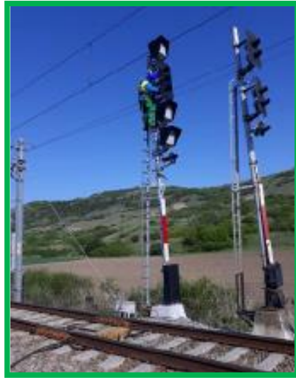
Podu Mureș – echipare semnale cu panouri LED