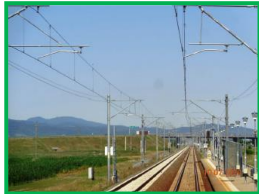
Punct de oprire Geogiu / km 445+300