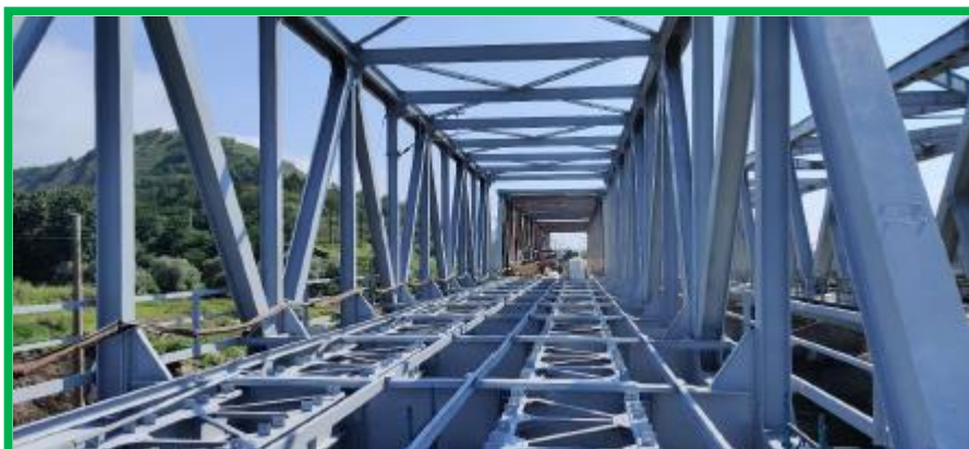
Pod km 396+222 HM Podu Mures