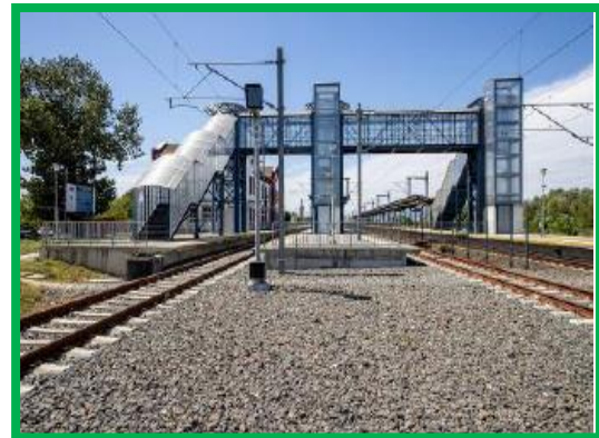
Orastie Pasarela 1