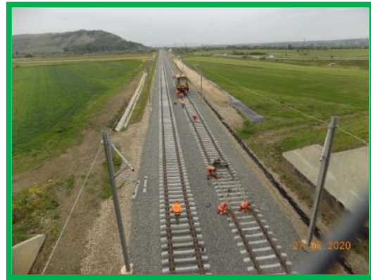
Km 396+200-397+500 Var Podu Mures Coslariu