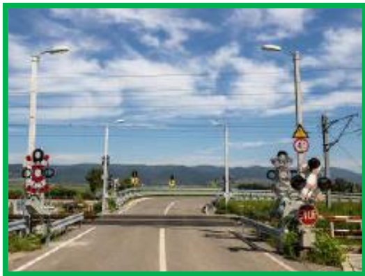
TN Turdas Cap X