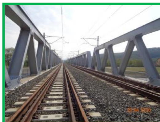
Interval Orastie - Simeria / Zona pod Strei / km 462+842