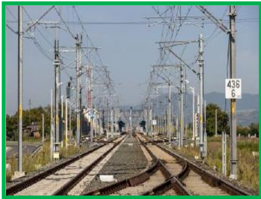
Statia Sibot Cap X