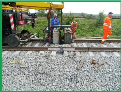
Sudura electrica Var Podu Mures Coslariu km 395+400