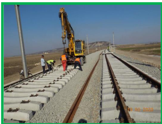
Km 397+075 – 395+500 Var. Podu Mureş – Coşlariu