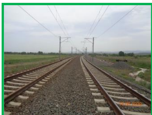
Statie Orastie, cap Y / Km 450+600