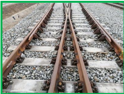
Suduri schimbator 107 HM Podu Mures