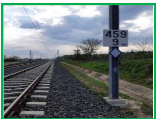
Interval Orastie – Simeria / km 459+900