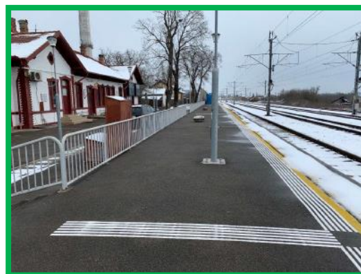
St. Santimbru: Marcaj pododactil