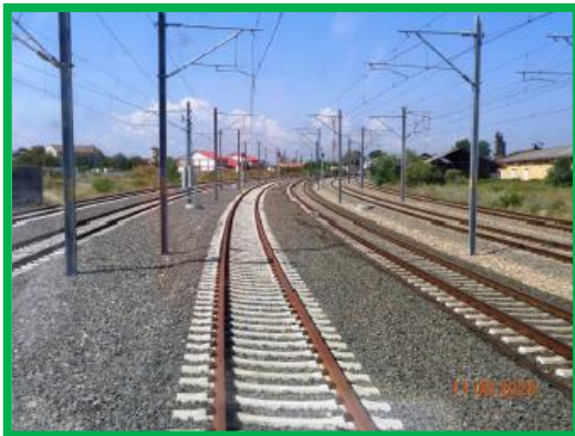
Statia Orastie / km 449+300