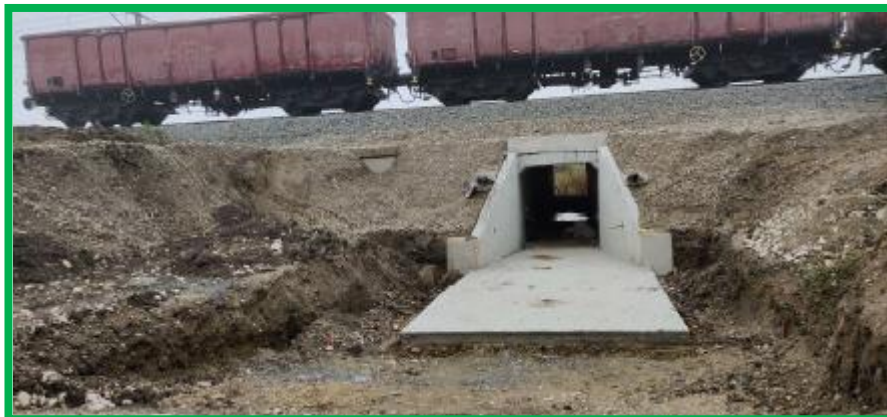
Podet km 396+132 HM Podu Mures