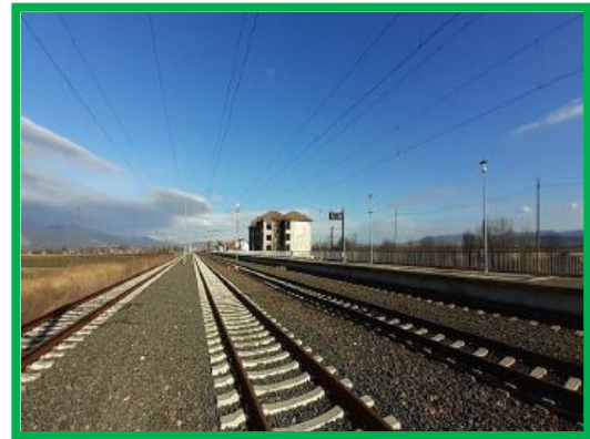
Statia Aurel Vlaicu / km 443+300