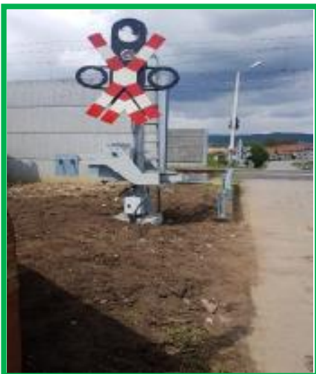
Orăștie – instalare semnal rutier TN Pricaz