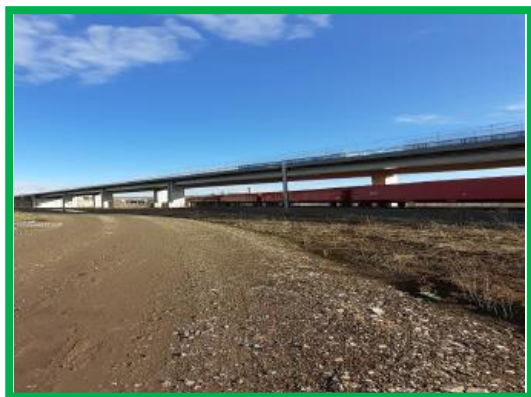
Pasaj superior peste liniile de cale ferata la km 457+431