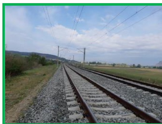
Interval Orastie – Simeria / km 460+300