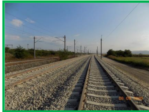
Km 398+120 - 398+600 Var Podu Mures - Coslariu