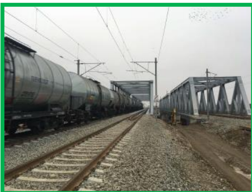
HM Podu Mures – Redeschidere circulatie FI