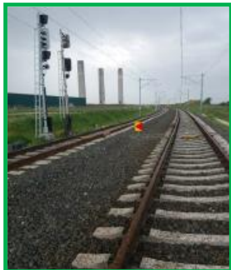
Orăștie – instalare reper semnal pe stânga