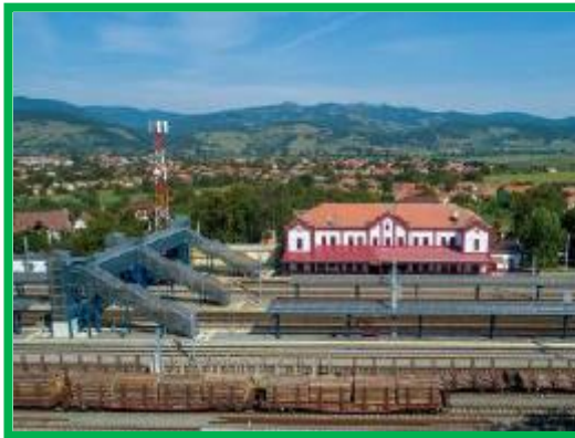
Vintu de Jos aerial view