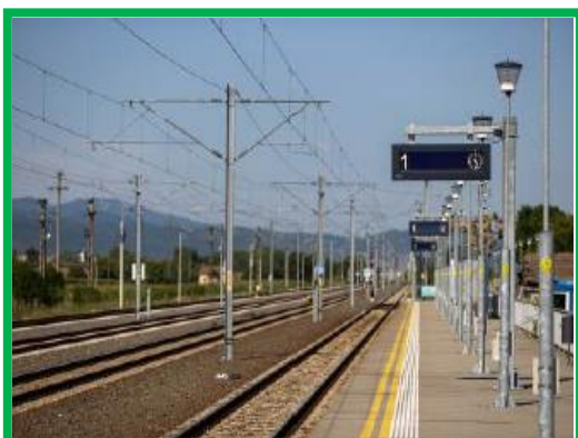
Panouri informare si iluminat peron Aurel Vlaicu