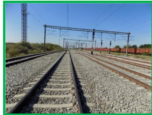
Km 402+675-404+200 St Coslariu