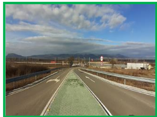
Turdas - ramura pasaj km 457+431