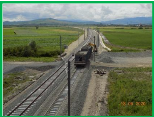
Km 395+600-397+500 FIR I Var Podu Mures – Coslariu