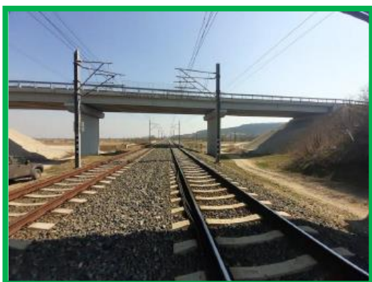
Interval Orastie - Simeria / km 462+500