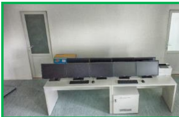
Simeria OCC – post bază CMI