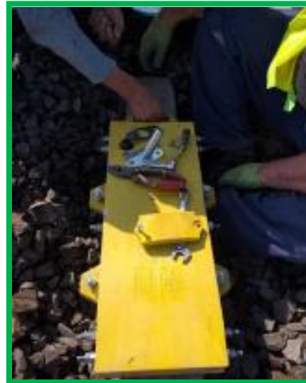
Vințu de Jos – instalare bobină de joantă