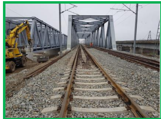
Pod km 395+200 Var Podu Mures Coslariu