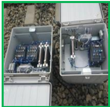
Vințu de Jos – echipare pichet CDC