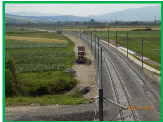
Km 396+300-396+550 Profilare drum tehnologic