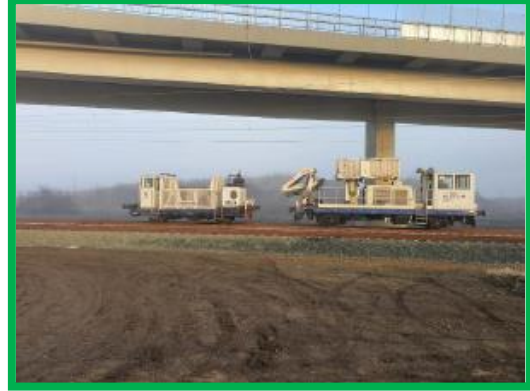
Pregătirea utilajelor în vederea verificării finale