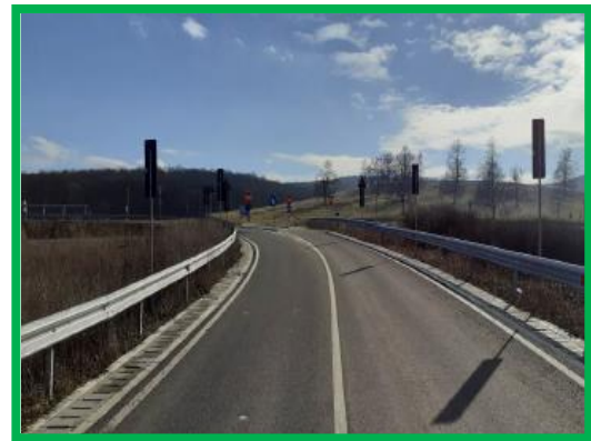
Turdas - ramura pasaj km 457+431