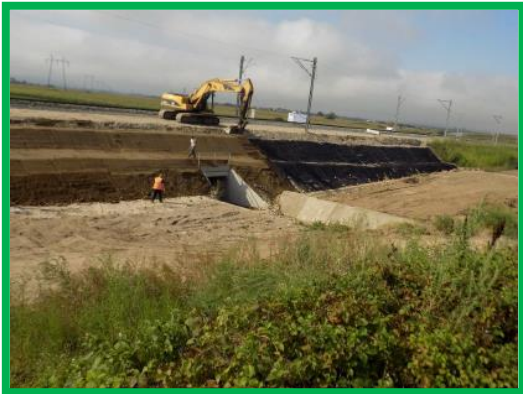
Km 395+450-395+650 FIR I Var Podu Mures - Coslariu