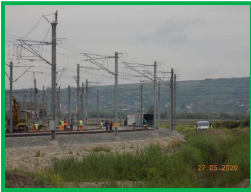
Km 396+570-396+894 HM Podu Mures