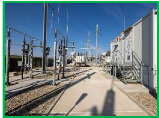
STE Sibot zona 25kV