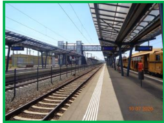
Statia Sibot / km 437+200