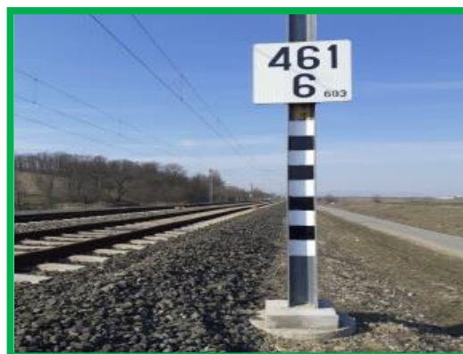
Interval Orastie – Simeria / km 461+600