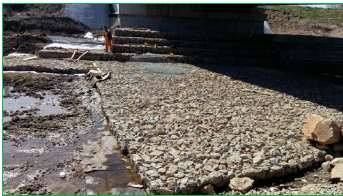
Pod km pr 409+395.64