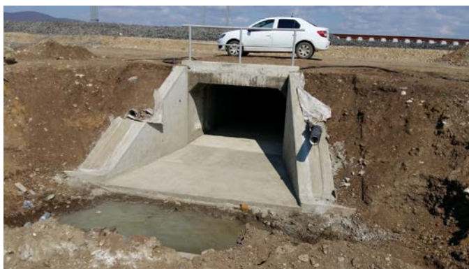
Podet km pr 450+262.61