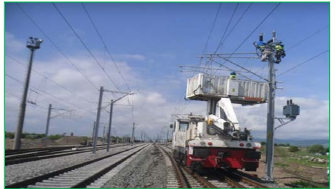
Interval Șibot – Aurel Vlaicu - Montare separator