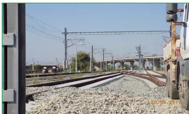
SL52 Alba Iulia