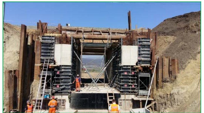
Podet km pr 430+194.31