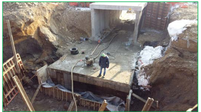
Podet km 411+897.50