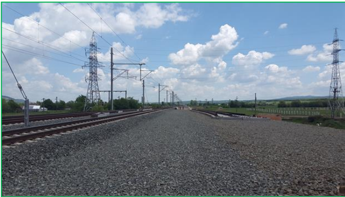
Interval Blandiana – Șibot