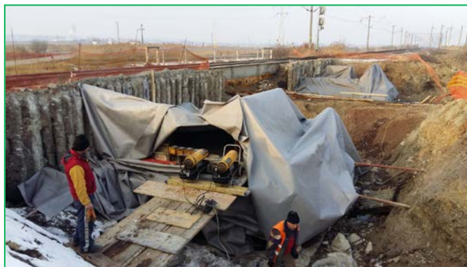
Pod km 402+000