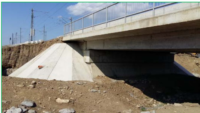
Pod km pr 449+891.23