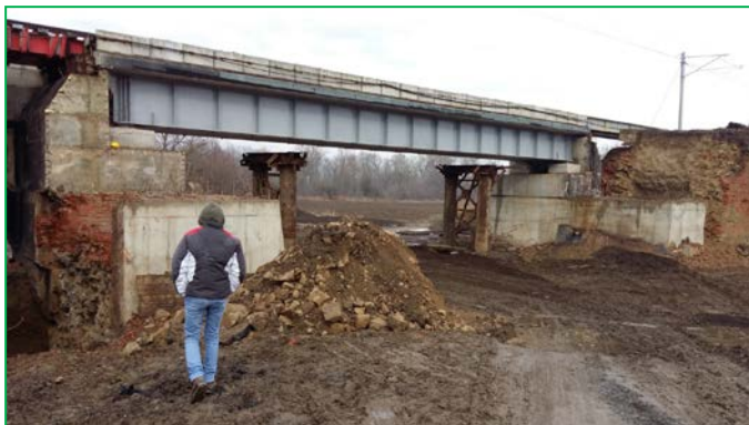
Pod km pr 431+974.62