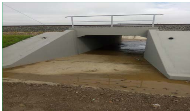
Podet km 446+185