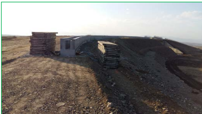
Pasaj superior km 396+200