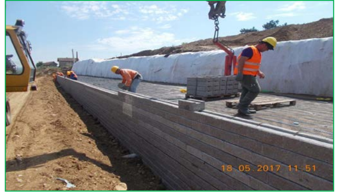
Interval Vințu de Jos - Blandiana, lucrări de montare a blocheților