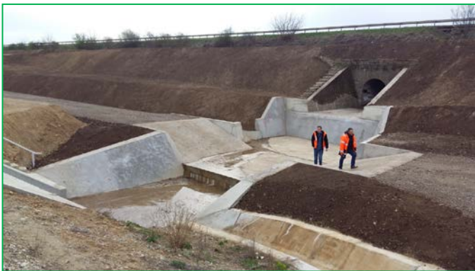
Podet km pr 424+708.47