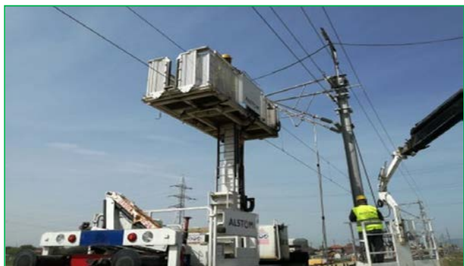
Substația de Tracțiune Șibot