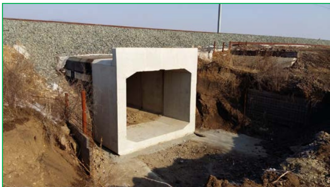
Podet km pr 434+270.29