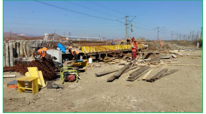
Pod km 402+000