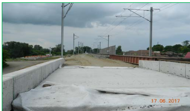
TR47001 Coșlariu - Sântimbru