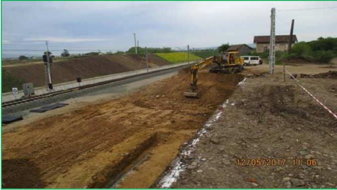
Interval Vințu de Jos - Blandiana, lucrări de excavații