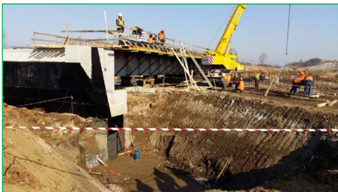
Pod km pr 454+718.00