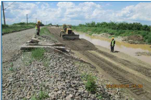
PAULIS – GHIOROC – mai