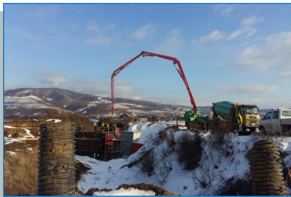
Betonare elevatie culeea Curtici pod km 606 + 953 – ianuarie