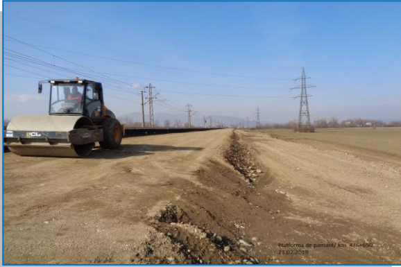
Km 476+650 platformă de pământ – februarie