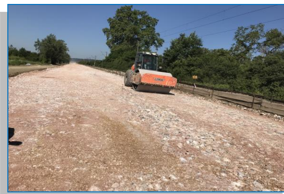
km 530+260 umplutură extindere rambleu - iunie