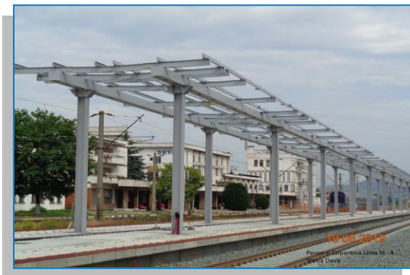
Stația Deva – peron și copertină Linia III – iunie