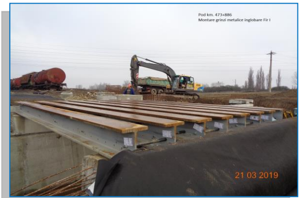
Pod km 473+886 montare grinzi metalice - martie