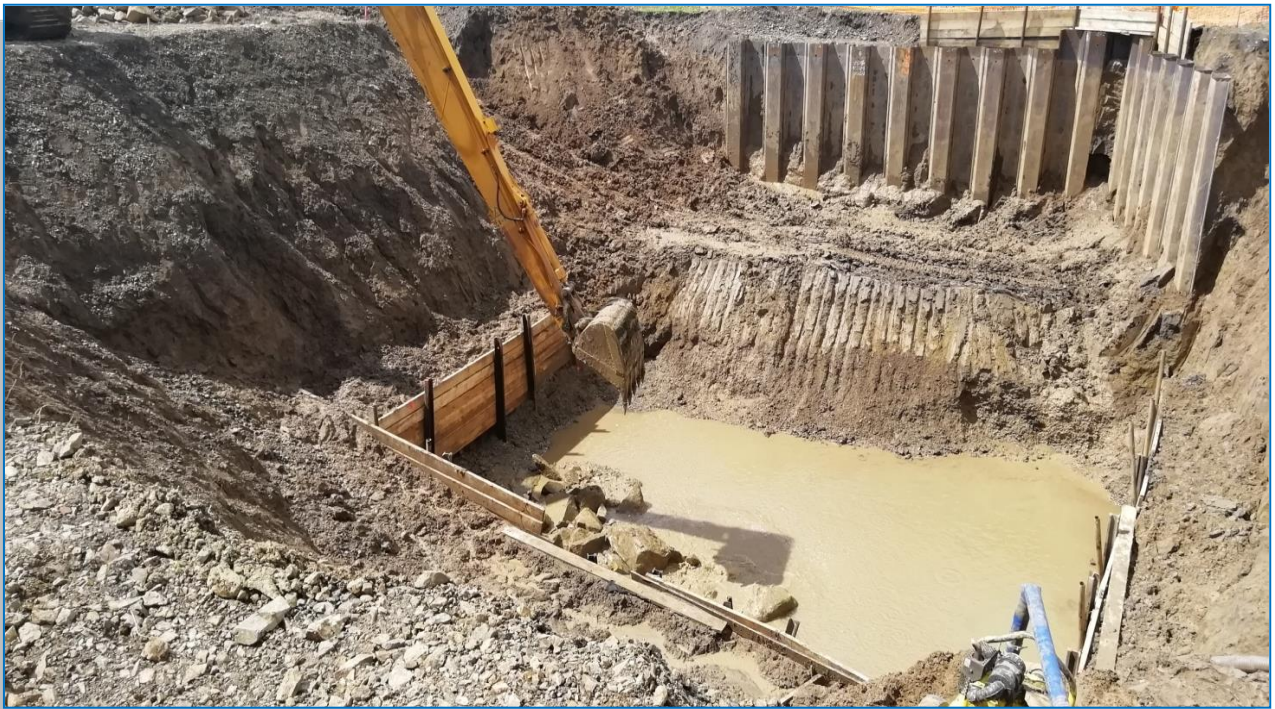
Pasaj superior km 566+212 - iunie