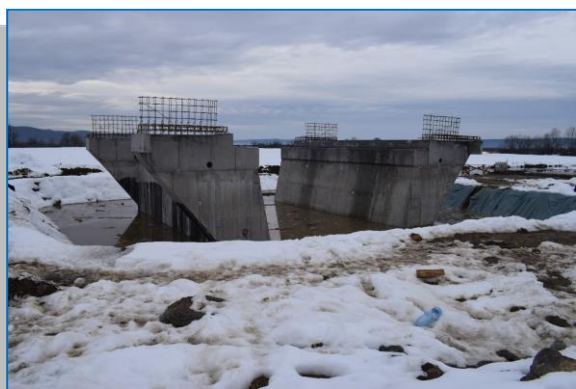
Pod GMIB Km 577+165 – ianuarie