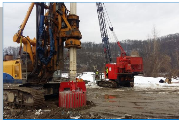
Pilot pod km 575 + 486 P1-8 - ianuarie