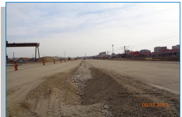
Stația Deva – platforma căii – PSS - martie