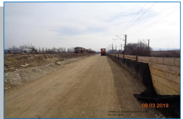
km 473+800 umplutură cu material granular – martie