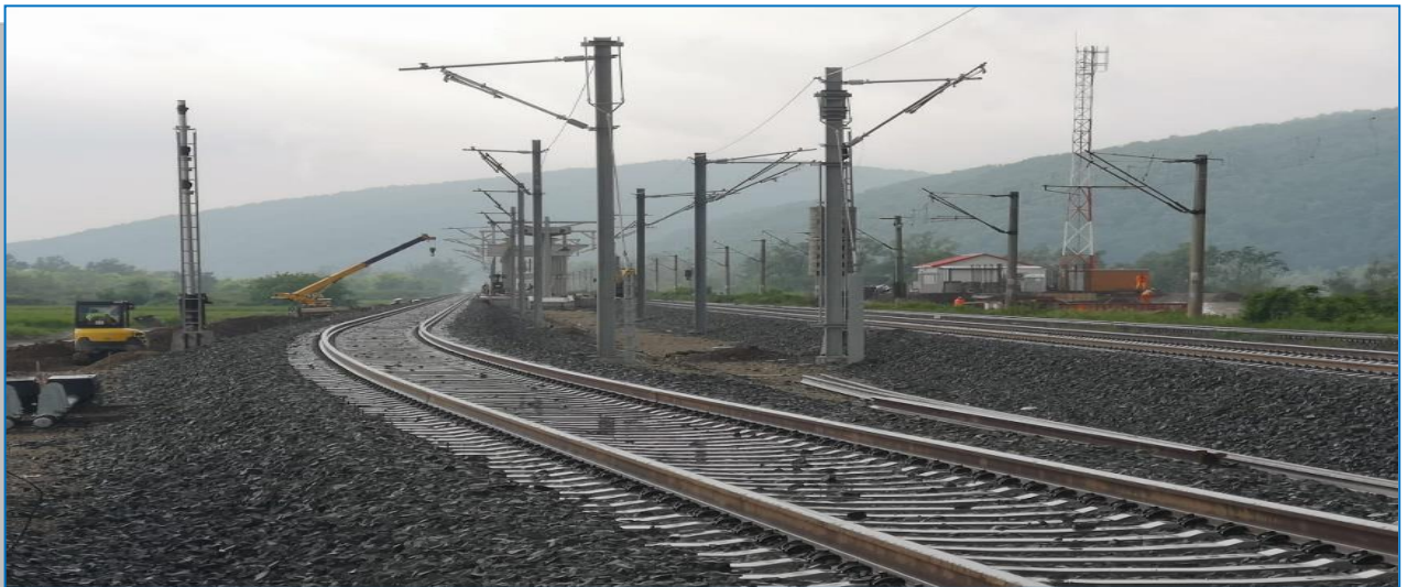
Stația Bârzava – mai