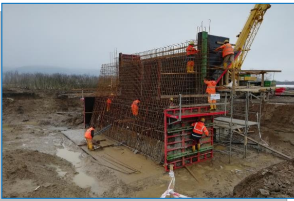
Pod km 559 +017 - armare și cofrare elevație culee – februarie