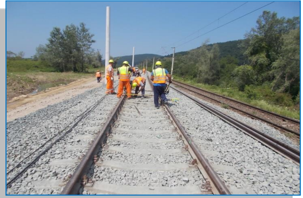
Stația Bârzava Nouă – suprastructură - iunie