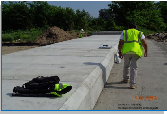
Podul km 496+332 matare rosturi între prefabricate – iunie