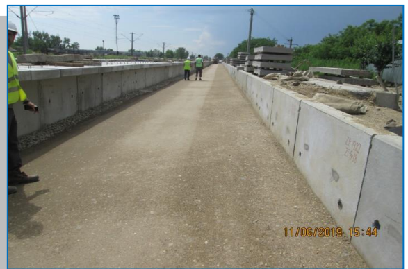
Stația Păuliș - iunie