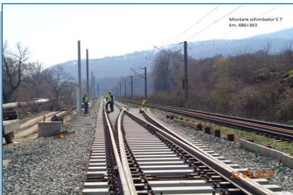
Km 486+363 montare schimbător – martie