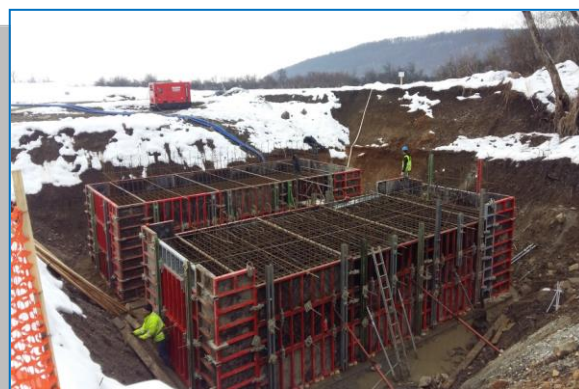
Armare radier pod km 581 + 158 – ianuarie