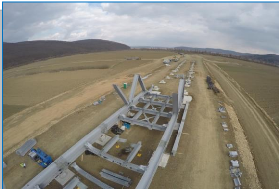
BARZAVA – MILOVA – tablier metalic pod peste Mureş - martie