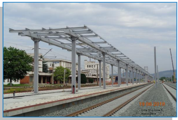
Stația Deva – Linia IV și Linia 5 - iunie