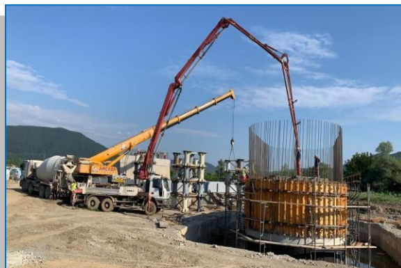
Pod km 517+440 betonare elevație - iunie