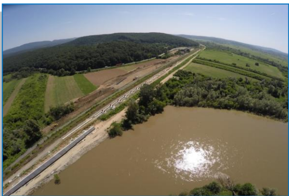
Stația Milova – iunie