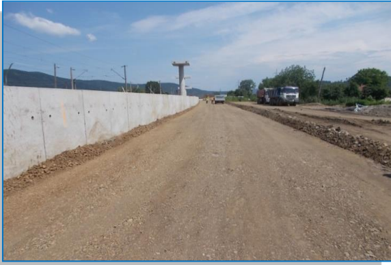
Stația Săvârșin – terasamente – iunie