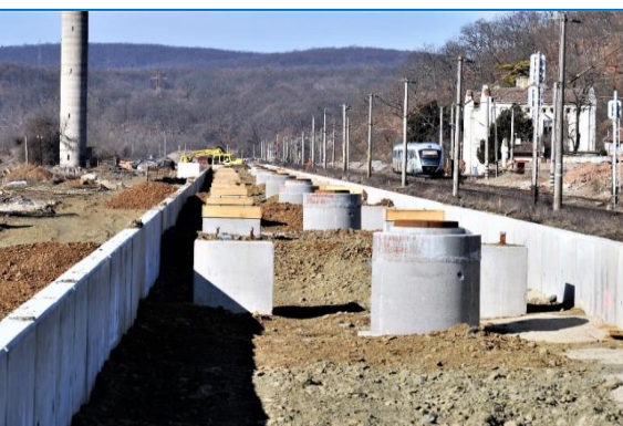
Stația Săvârșin – peron – martie