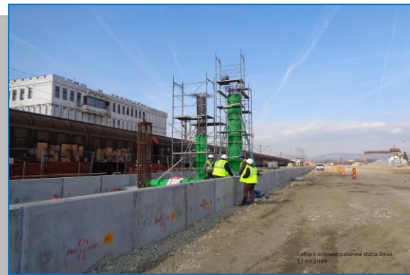
Stația Deva – cofrare coloane pasarelă – martie