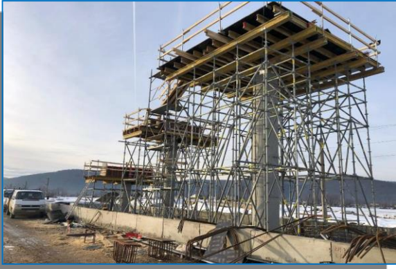
Stafia Barzava – pasarela pietonala – ianuarie