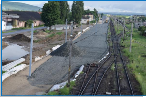
Stația Ghioroc – mai