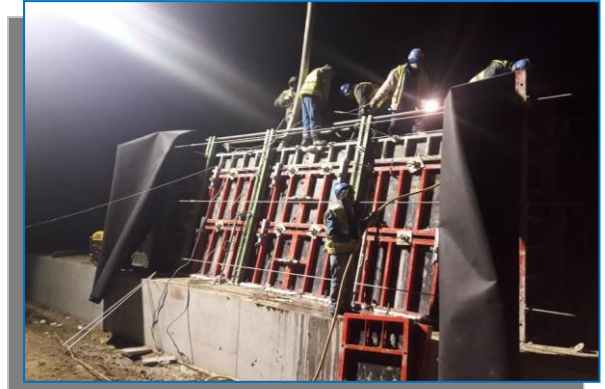
Varadia – Savarsin – execuție zid de sprijin - ianuarie