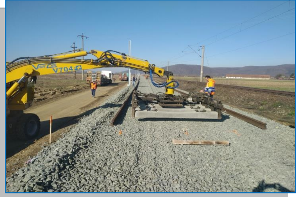
Suprastructura BARZAVA - aprilie