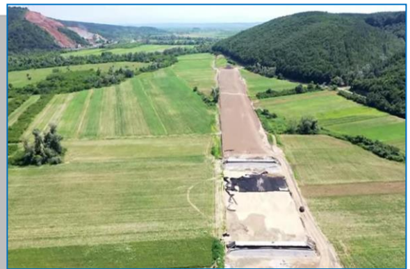
Bârzava - Văradia km 561+500 – vedere general - iunie