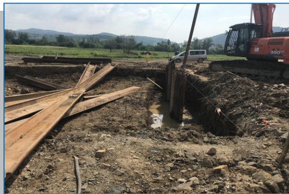
Pod km 525+295 introducere palplanșe metalice - iunie