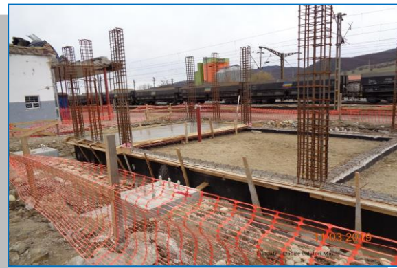
Stația Mintia – fundații clădire călători – martie