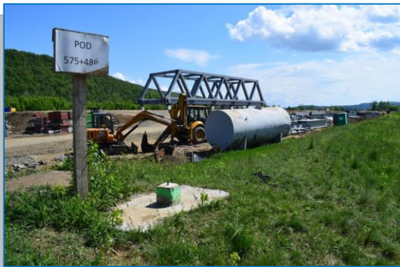
Pod km 575+486 – aprilie