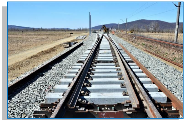
Stația Bârzava - februarie