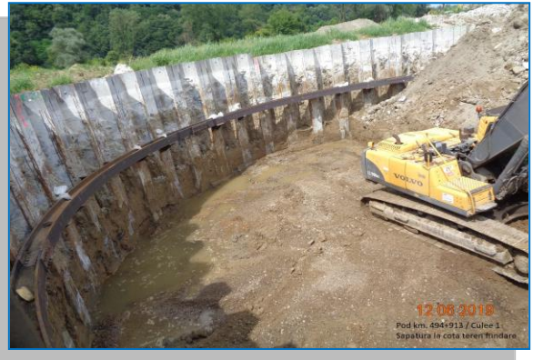
Pod km 494+913 – culee, săpătură la cota teren fundare - iunie