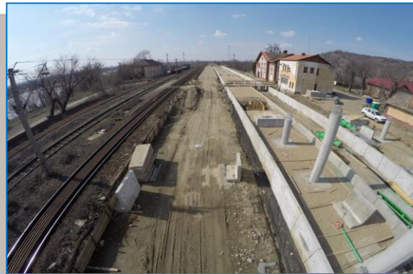
STATIA PAULIS - martie