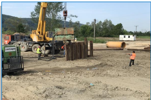
Pasaj superior km 531+320 introducere palplanșe metalice – iunie