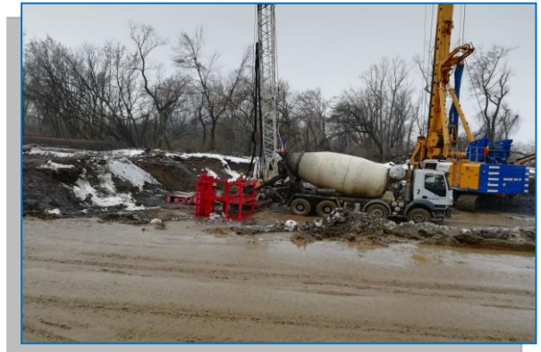
Pod 2 Km 564+514 - turnare coloană la pila P4 - ianuarie