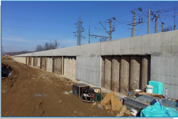
Masca piloti Radna – februarie