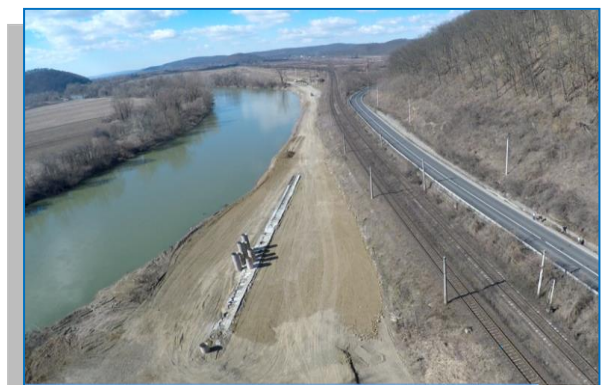
Săvârșin – Ilteu - Platforma zid de sprijin 538+200 - martie