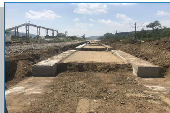
Stația Ilteu – fundație peron - iunie