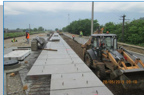
Stația Păuliș - mai