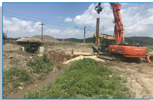
Pod km 517+799 introducere palplanșe metalice – iunie