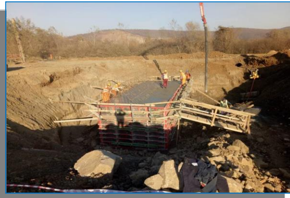
Barzava – Varadia – pod km 559+200 – ianuarie