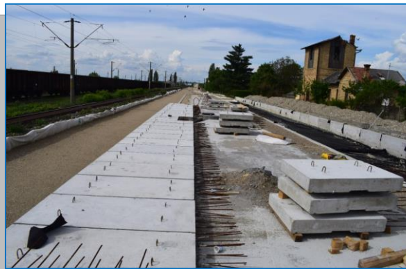
STATIA GHIOROC - aprilie