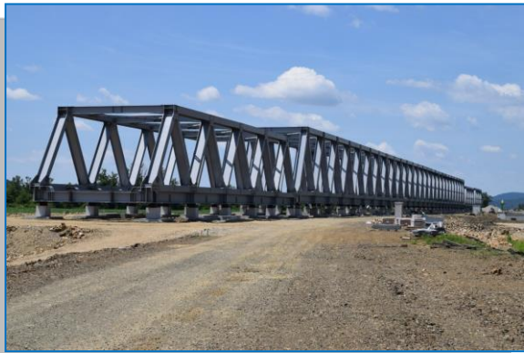
BARZAVA – MILOVA – tablier metalic pod peste Mureș - iunie