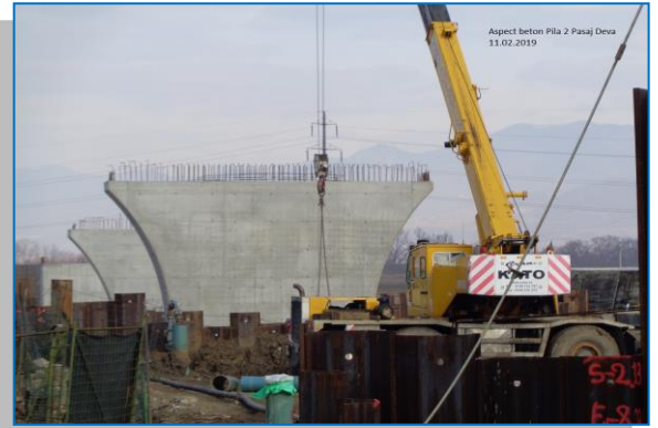
Pasaj Deva – Pila 2 - februarie