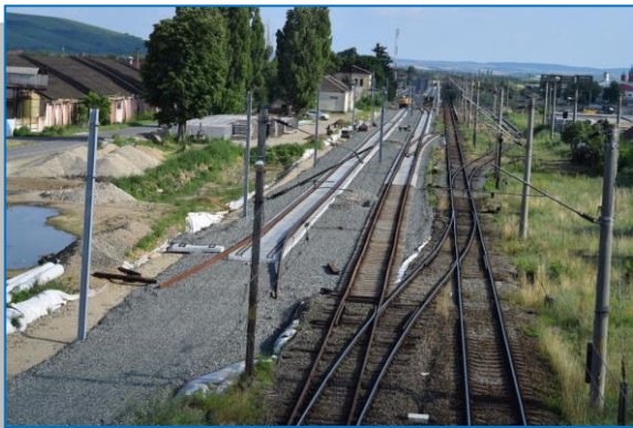
Stația Ghioroc - iunie