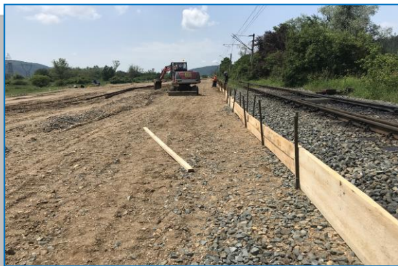
Km 531+350 – sprijiniri în lungul liniei – iunie