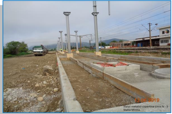
Stația Mintia – stâlpi metalici copertină - iunie