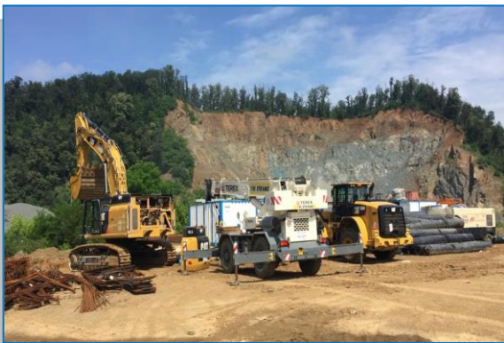
Mobilizare tunel – iunie