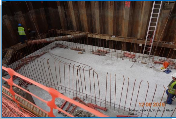
Pod km 494+913 fundație pila 6 – iunie