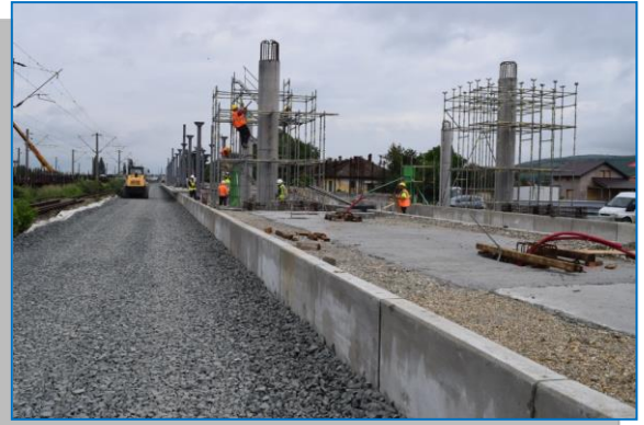
Stația Ghioroc – mai