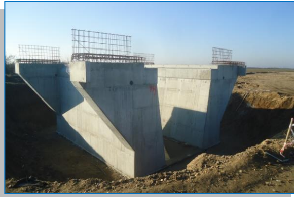
Ghioroc-km 614 - februarie