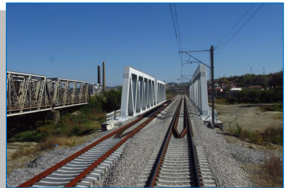
Copșa Mică - Micăsasa