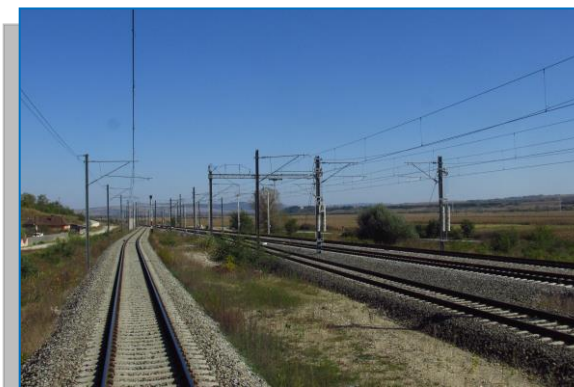
Crăciunel – Podu Mureș – final secțiune Sighișoara - Coșlariu