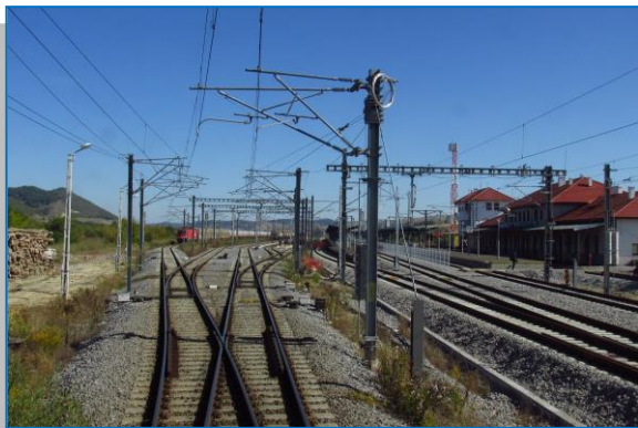
Stația Copșa Mică