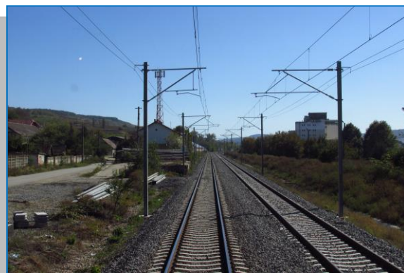
Interval Valea Lungă – Blaj