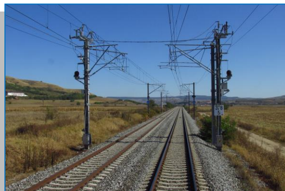
Interval Blaj – Crăciunel