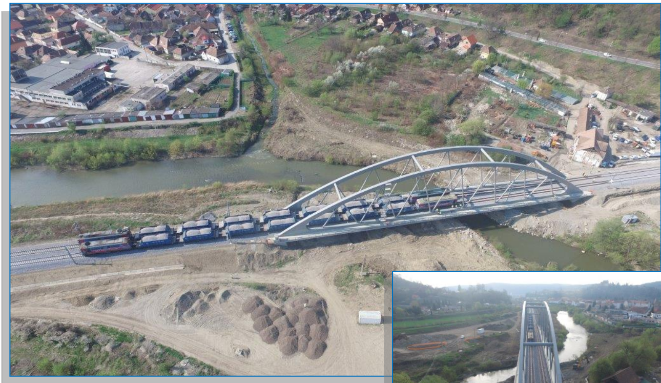
Sighişoara – Daneş – Pod 1 – încărcare cu convoi de probă