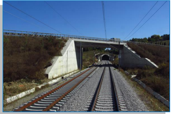
Sighișoara – Daneș – Tunel Daneș