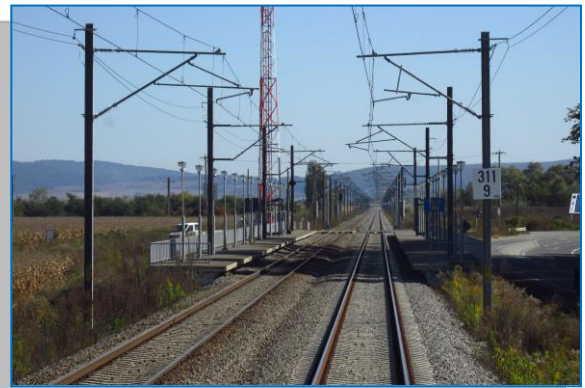
Daneș – Dumbrăveni – PO Luna