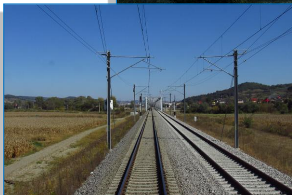
Mediaș – Copșa Mică