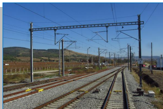
Stația Crăciunel Cap X