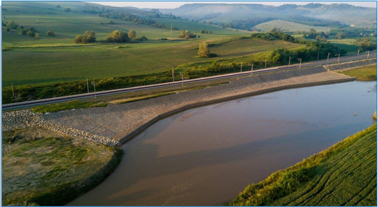
Mediaș – Copșa Mică – apărare de mal