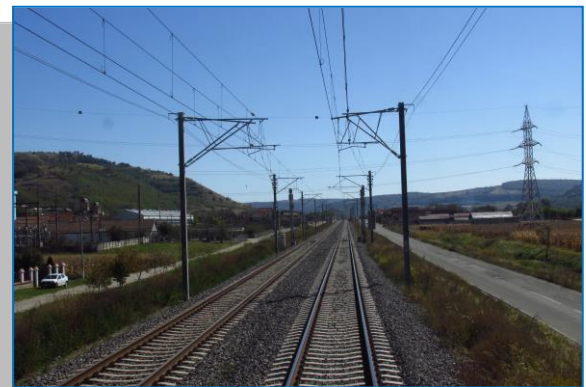
Micăsasa – Valea Lungă – zona PO Lunca