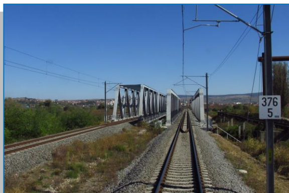
Blaj – Crăciunel – Pod nr.6