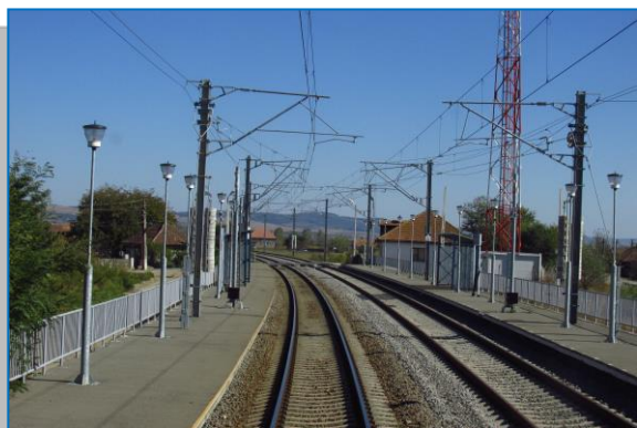
Crăciunel – Podu Mureș – PO Cistei