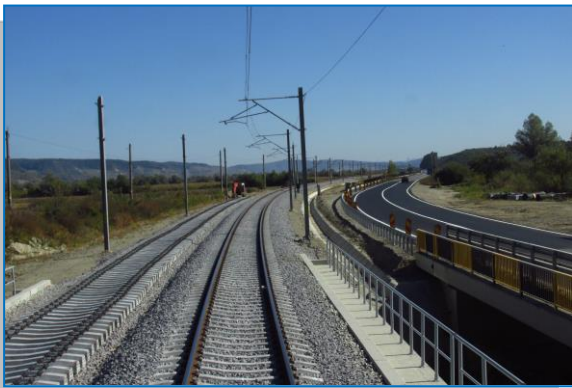
Daneș – Dumbrăveni – deviere DN 14