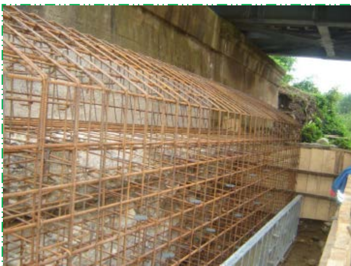
Armare fundație culee Petroșani