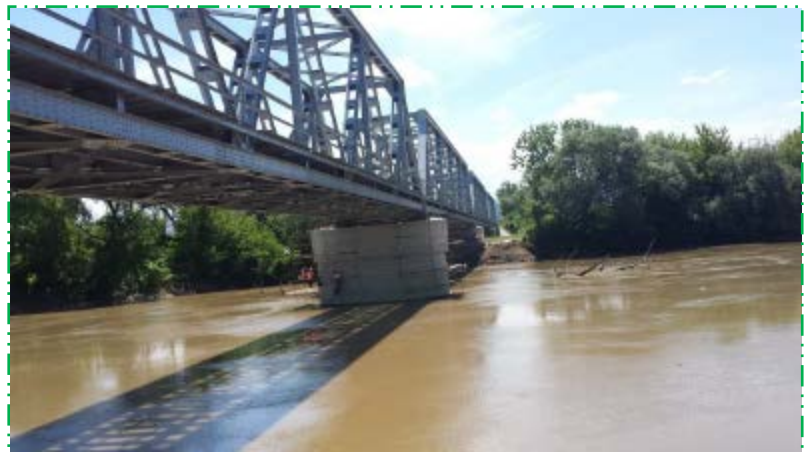
Aplicat amorsă și vopsea pentru impermeabilizare pila P2