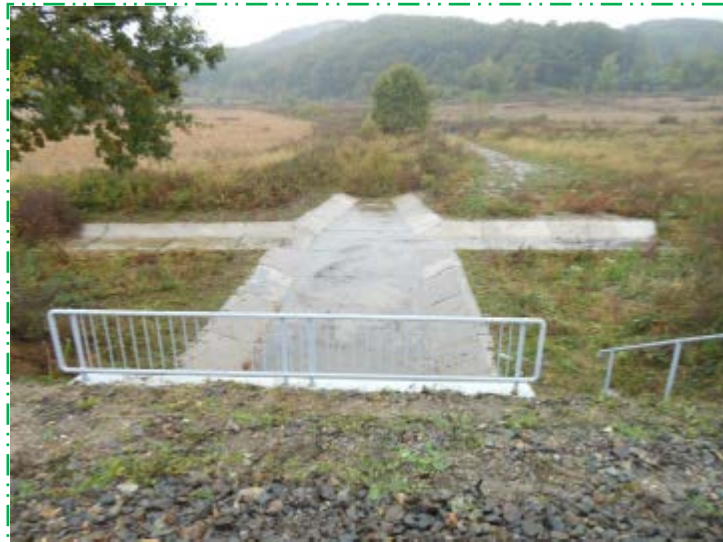
Detaliu trepte terasament în amonte