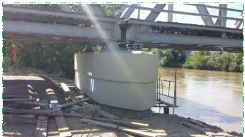
Aplicat amorsă și vopsea pentru impermeabilizare pila P3