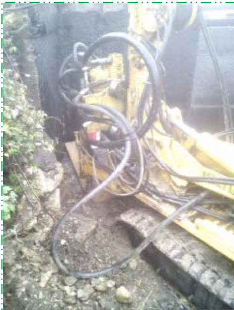
Injectarea terenului în zona fundațiilor