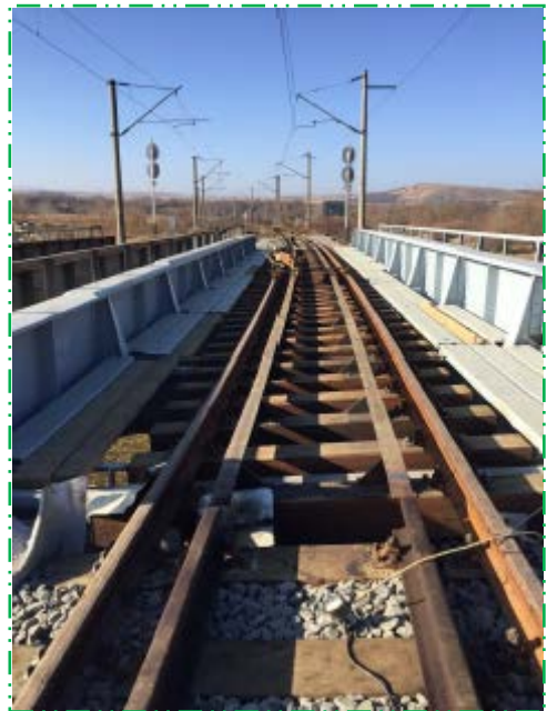
Montare șină și contrașină pe pod