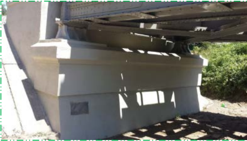
Aplicat strat vopsea pentru impermeabilizare culee C1