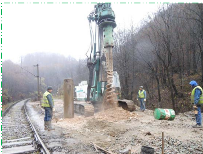
Scoatere material excavat