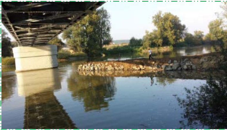
Dig deviere râu Mureș pentru protecția pilei P2