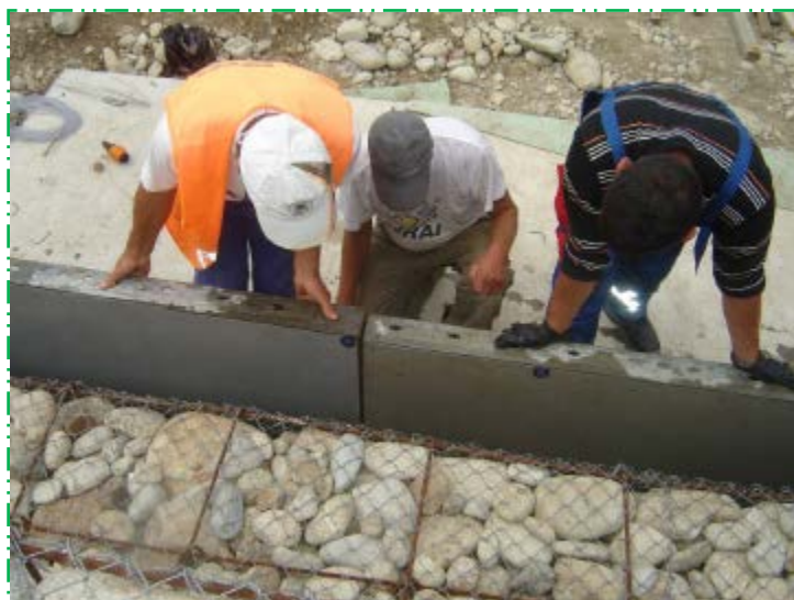
Cofrare protecție gabioane