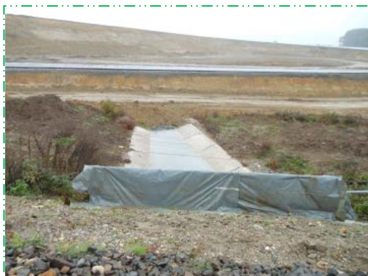
Vedere albie podeț spre aval