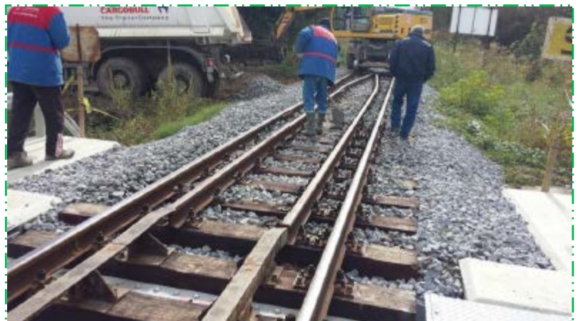
Aducerea liniei la parametrii prevăzuți în proiect