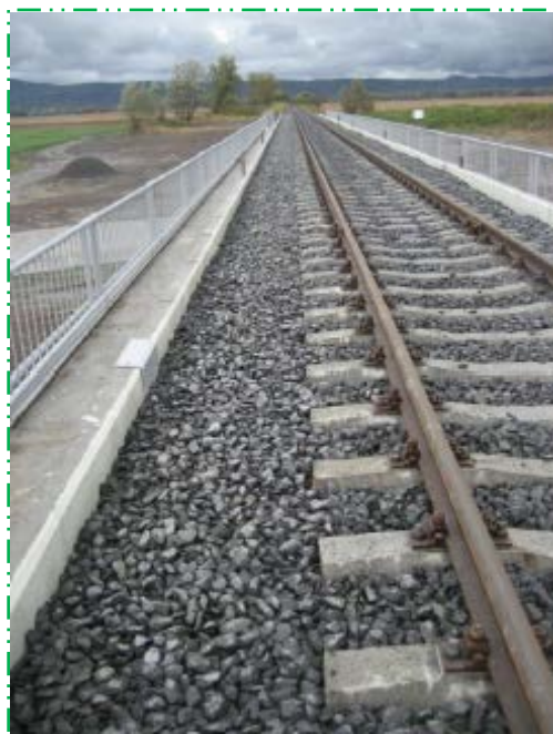
Burare și profilare linie, stabilizare linie