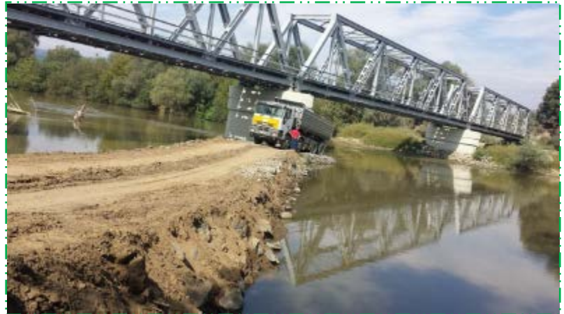
Protecție cu anrocamente pila P2