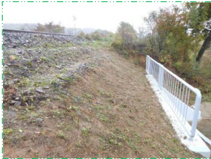
Vedere din amonte de podeț - în stânga căii ferate