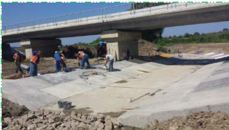
Betonare radier albie Mureșul Mort