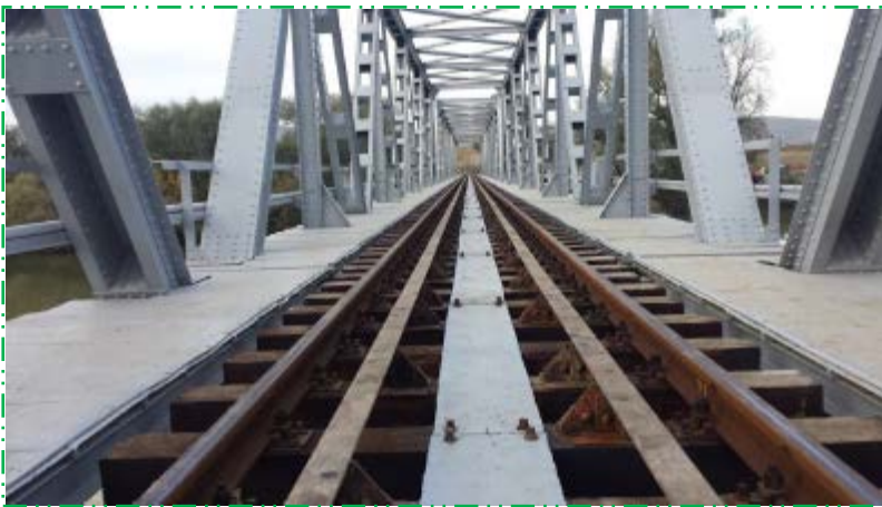
Montat platbandă prindere dulapi trotuar