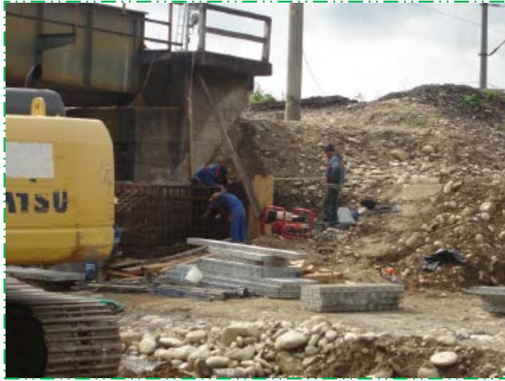
Armare fundație culee Simeria