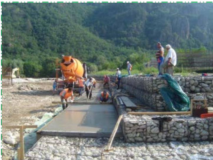
Cofrare și betonare protecție gabioane, treapta întâi, mal drept – aval