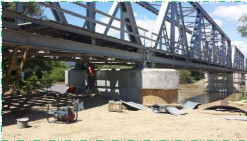
Decofrare cămășuială pila P3