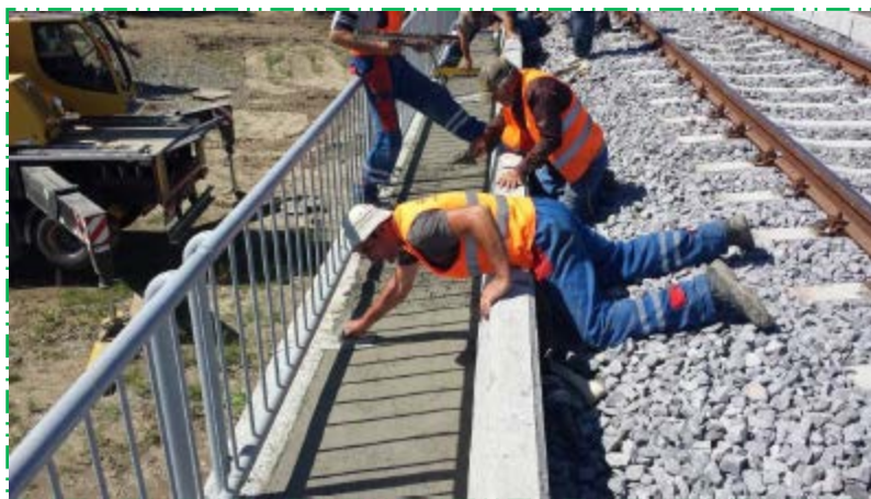
Turnare beton trotuar pod