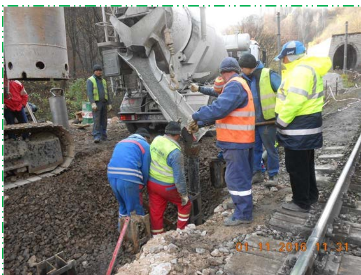
Betonare coloane forate în lungul Dublei II - culeea Simeria