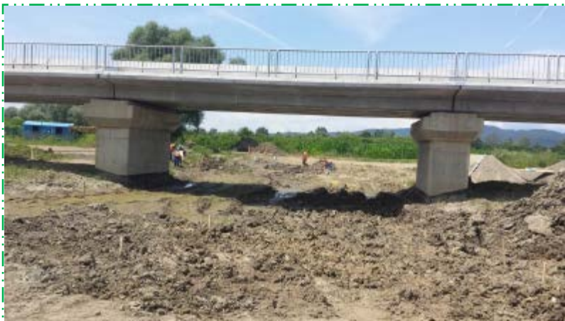
Decolmatare și profilare amenajare albie Mureșul Mort