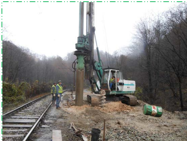
Forare coloane F600 în lungul Dublei II - culeea Simeria