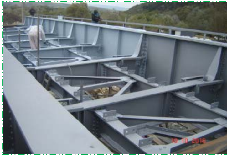
Vopsire tablier metalic