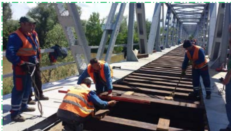
Chertare și montare traverse