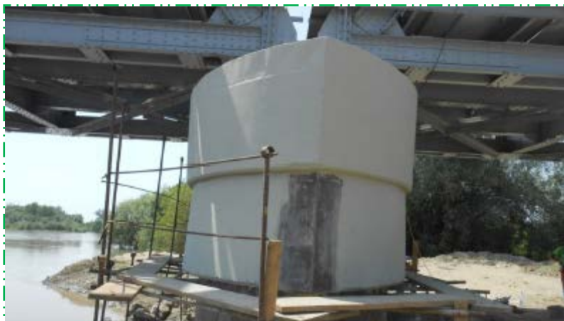
Aplicat amorsă și vopsea pentru impermeabilizare pila P1