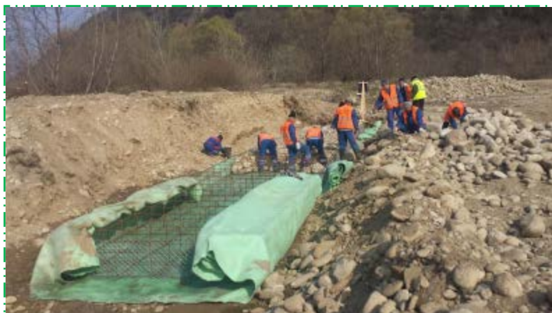
Așternere geotextil sub primul rând de gabioane, mal stâng aval