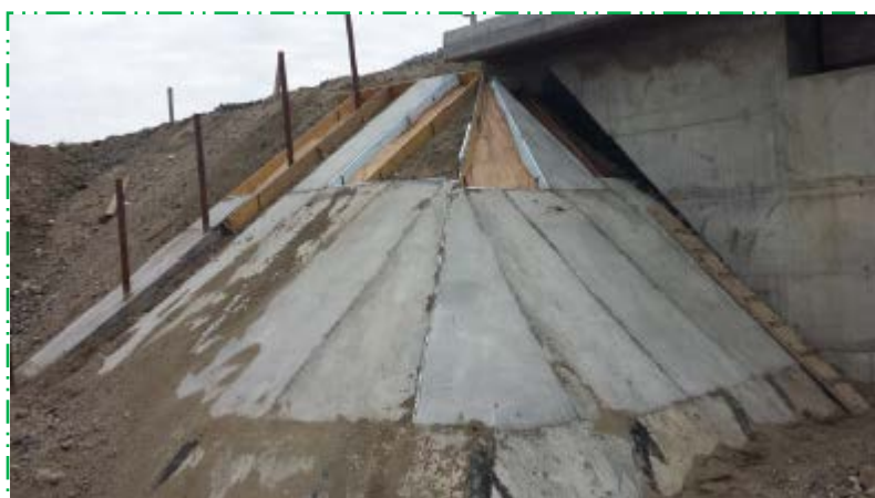
Betonare sfert con culee C1 amonte și aval