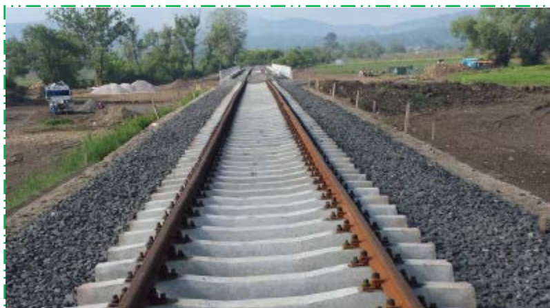
Montat traverse beton T13 și șină E49 cap X