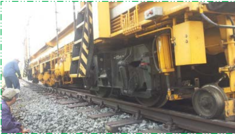
Burajul liniei și aducerea acesteia la parametri prevăzuți în proiect