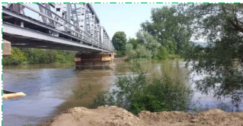
Montare cofraj și turnare beton cămășuială pila P2