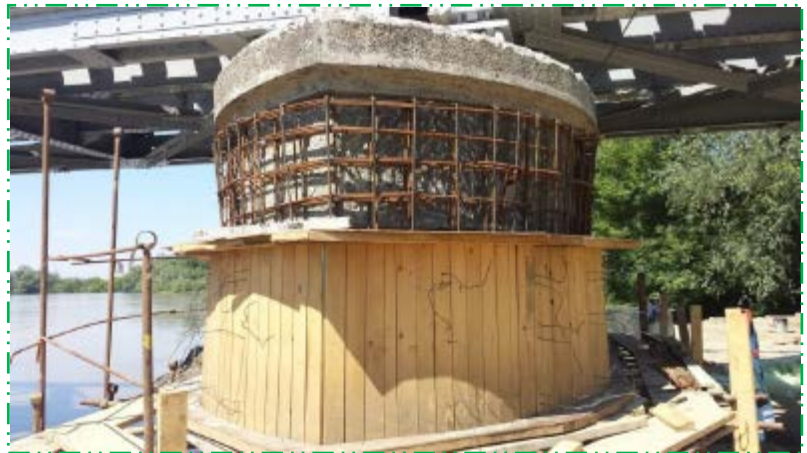
Montat cofraj pentru cămășuire pila P1