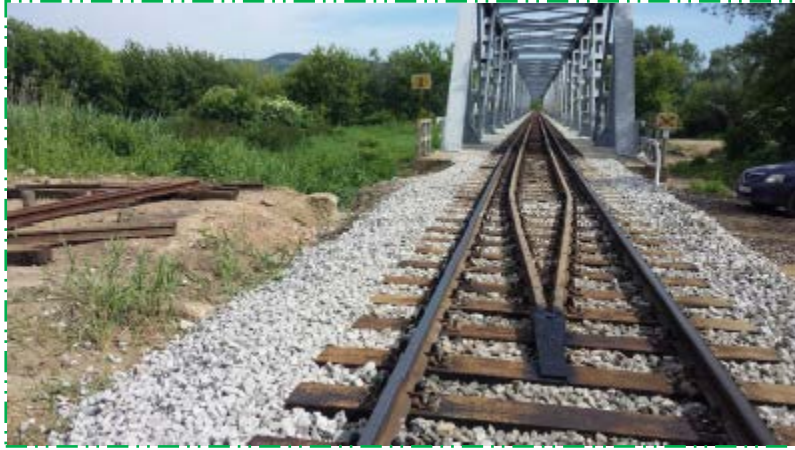
Montat contrașină pod