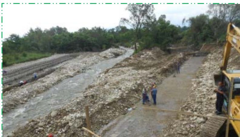
Săpătură fundație gabioane, mal stâng – amonte