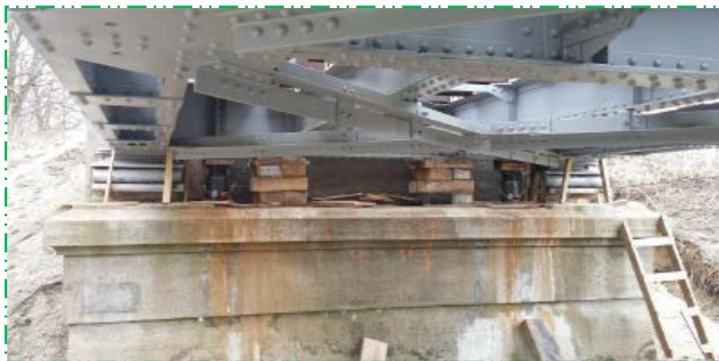
Ridicat tablier metalic