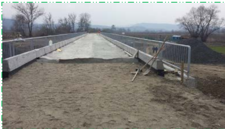
Șapă protecție opritori balast