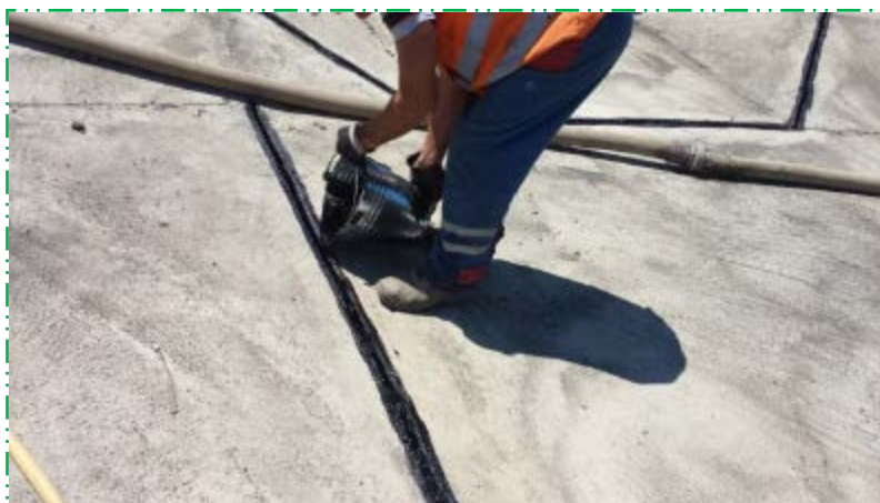
Realizare rosturi albie amonte