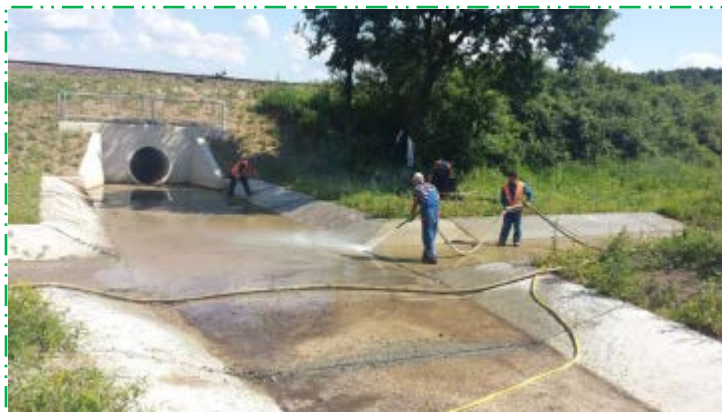
Curățat, spălat cu apă și suflat cu aer rosturi dilatație, amenajare albie amonte