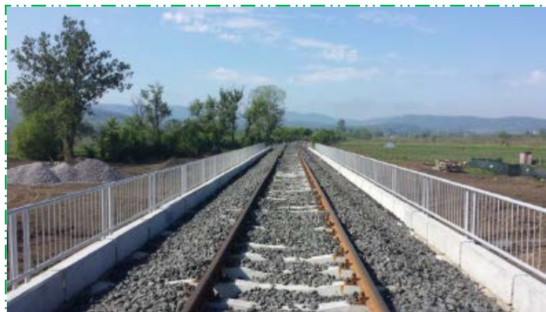
Burare piatră spartă capete traverse