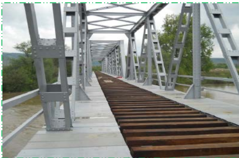
Montat platelaje trotuar