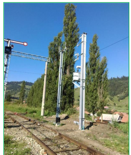
Stația CF Lunca de Sus