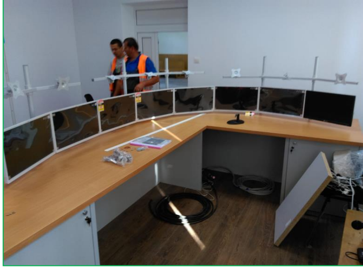
Stația CF Ghimeș