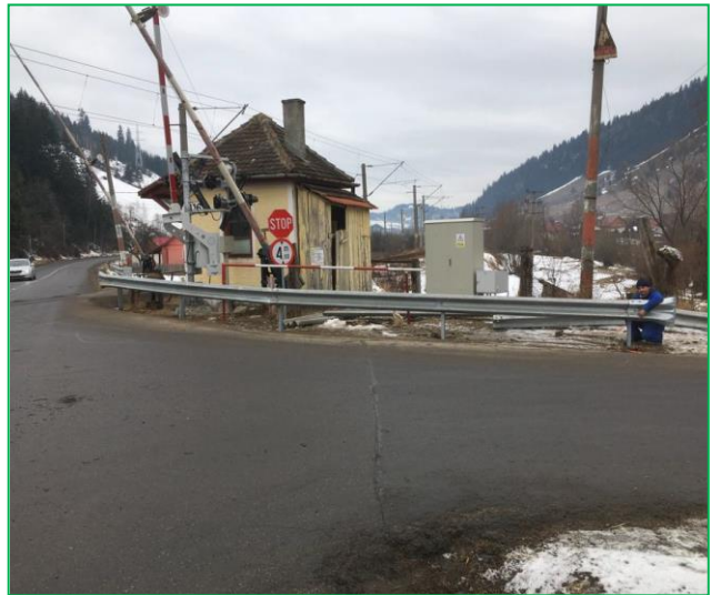
Stația CF Lunca de Mijloc