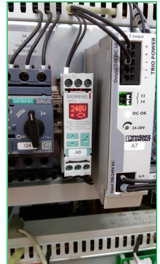
Stația CF Nădejdea