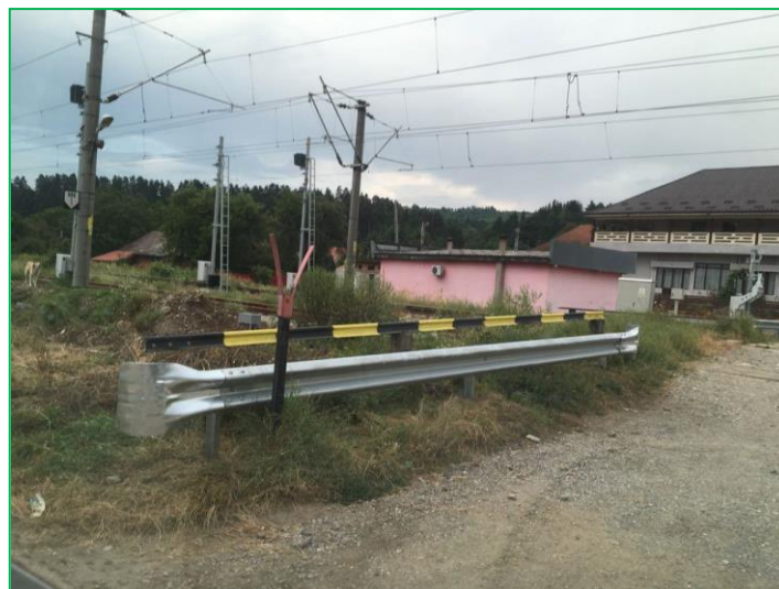
Stația CF Asau