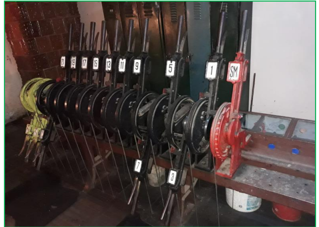
Stația CF Mihăileni