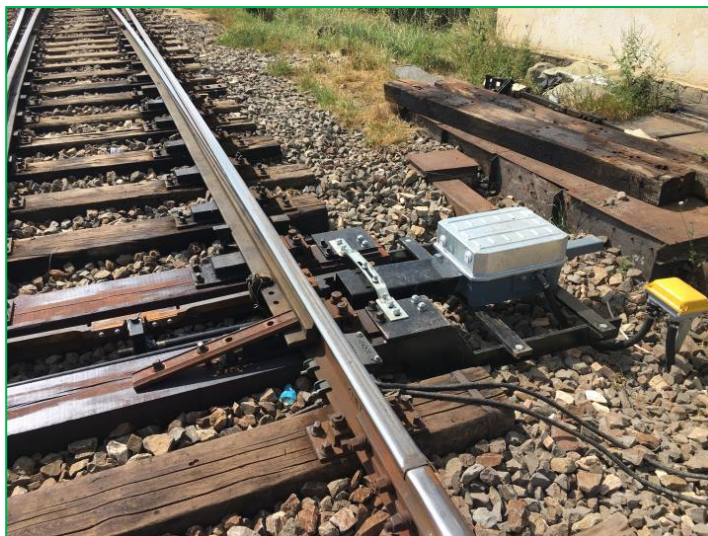
Stația CF Mihăileni