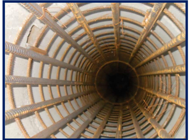
Execuție piloți forajți pentru fundație clădire container DCOS Brănești