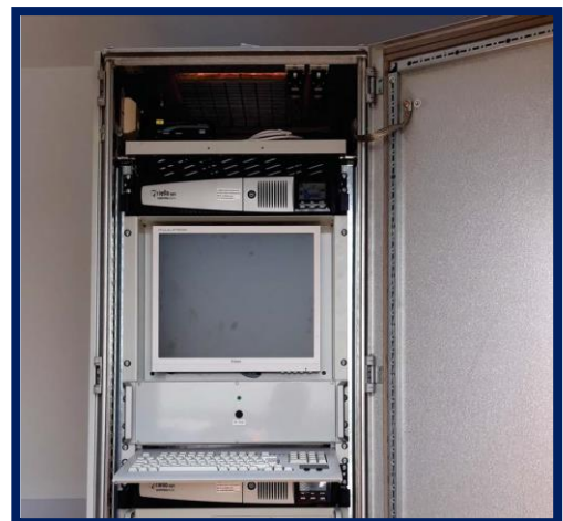
Echipment interior DCOS montat în clădirea container DCOS Grozăvești