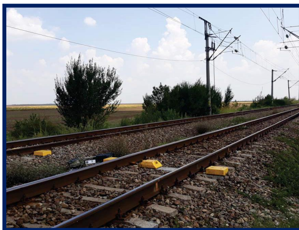
Teste la terminarea lucrărilor și verificări în vederea punerii în funcțiune DCOS Grozăvești