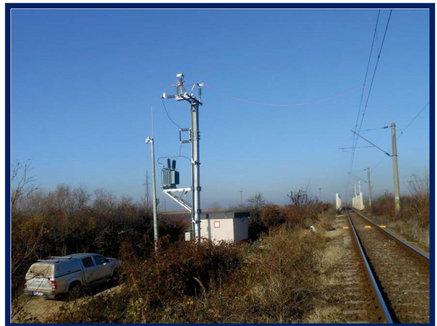
Teste la terminarea lucrărilor și verificări în vederea punerii în funcțiune DCOS Jabăr