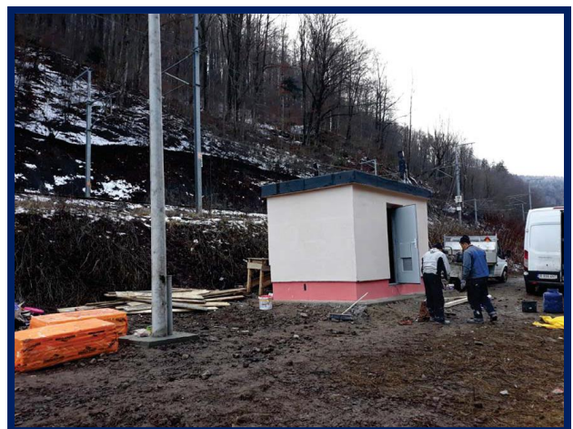
Instalații supraveghere video și clădire container aferent DCOS Valea Largă