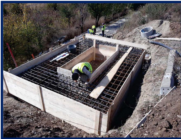
Execuție fundație clădire container DCOS Brănești