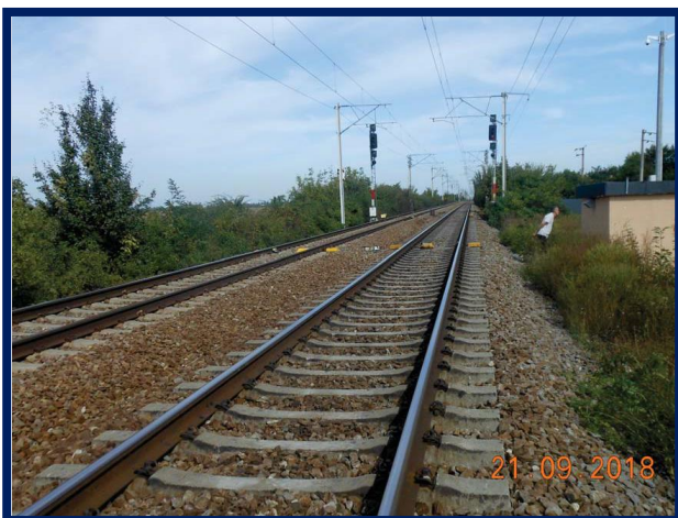
Echipamente DCOS de cale și clădire container – Crivina