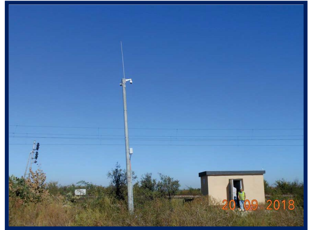
Teste la terminarea lucrărilor și verificări în vederea punerii în funcțiune DCOS Vadu Lat