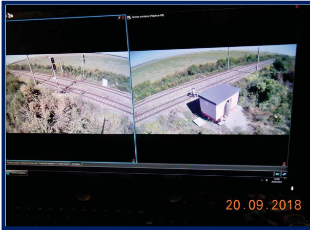
Supravegherea video din camera IDM aferentă DCOS Vadu Lat