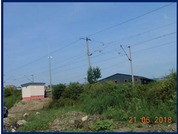
Teste la terminarea lucrărilor și verificări în vederea punerii în funcțiune DCOS Târgu Frumos