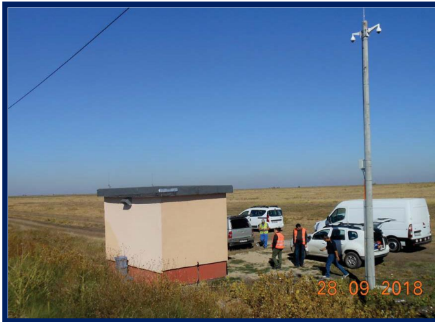
Teste la terminarea lucrărilor și verificări în vederea punerii în funcțiune DCOS Măldăeni