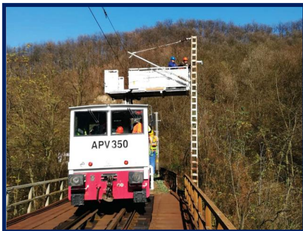
Montare elemente de prindere pentru cablul cu fibre optice aerian pe secția Teregova Caransebeș