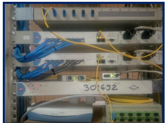
Echipe de telecomunicații în Repartitorul TTR Filiași aferente DCOS Răcari