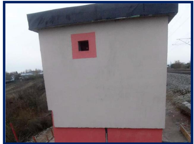
Finisaje exterioare clădire container – DCOS Brănești