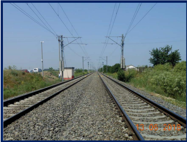
Teste la terminarea lucrărilor și verificări în vederea punerii în funcțiune DCOS Dragoș Vodă