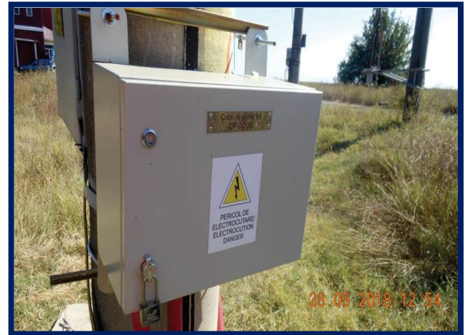
Tablou alimentare instala_ie DCOS din post de transformare al Stației Măldăeni aferente DCOS Măldăeni