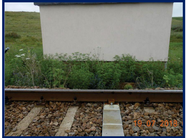
Finisaje exterioare clădire container și traversă specială senzori DCOS montată în cale aferent DCOS Vinga