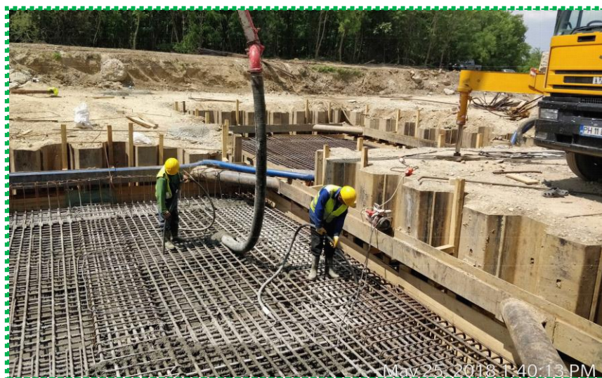
Turnare beton radier culee C1-I