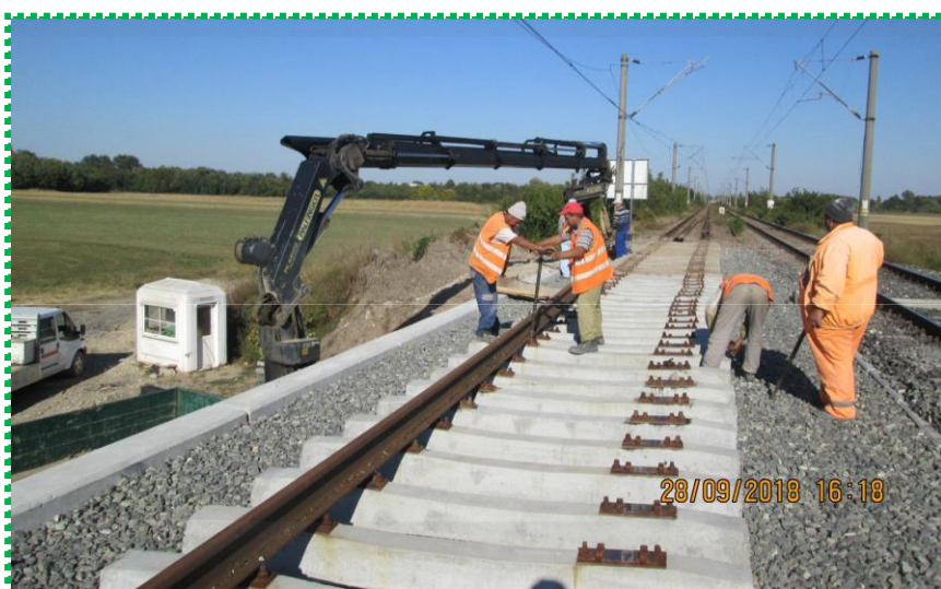
Montare cadru șină - traversă – Fir I