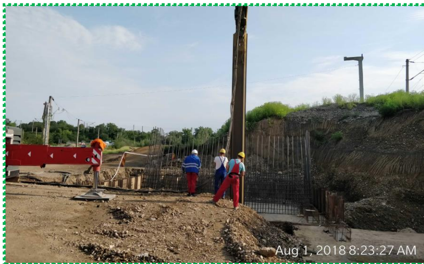
Extragere palplase radier culee C2-II