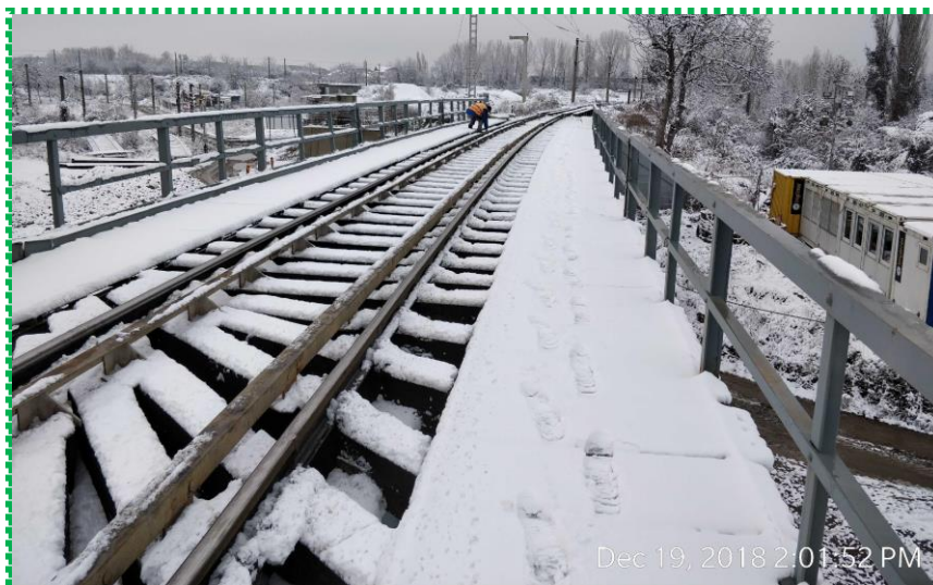
Monitorizare pod - verificare izolatori și prinderi joante