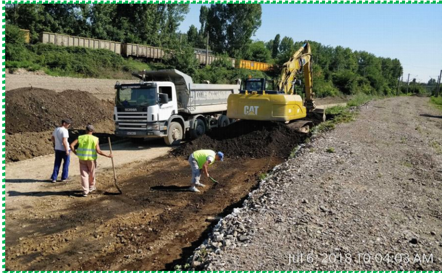
Săpătură trepte de înfrățire terasament – Fir II