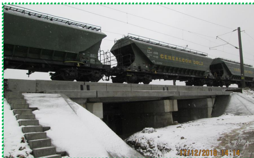
Redeschidere circulație feroviară - Fir I / 17.12.2018