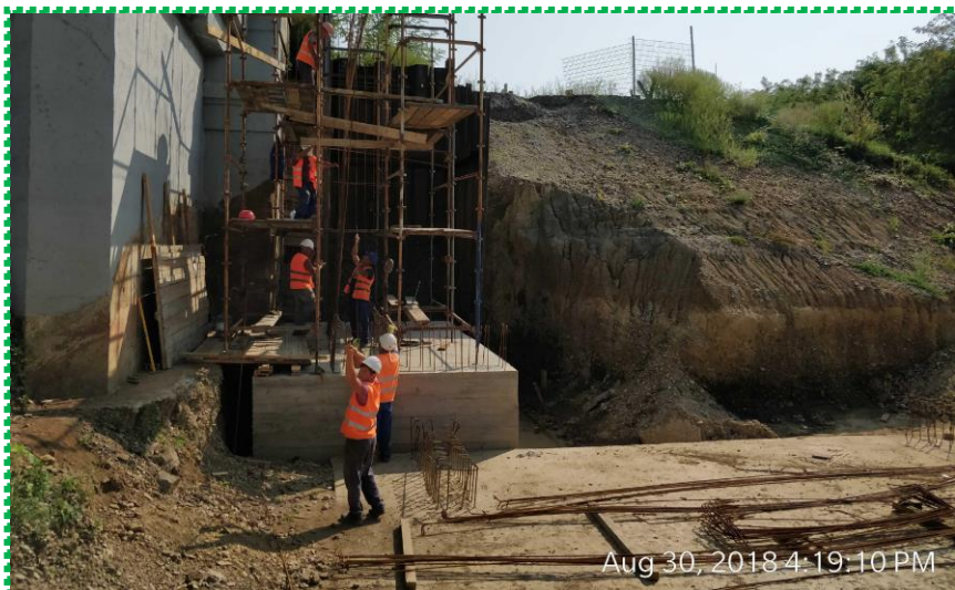
Montare armatură zid de sprijin Z-1