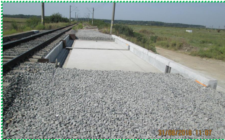
Așternere substrat piatră spartă terasament Fir I