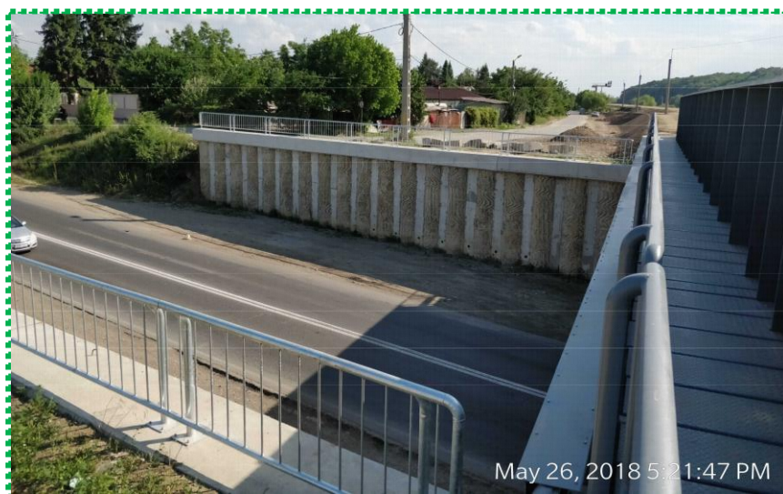
Montare parapet metalic în zona aripilor