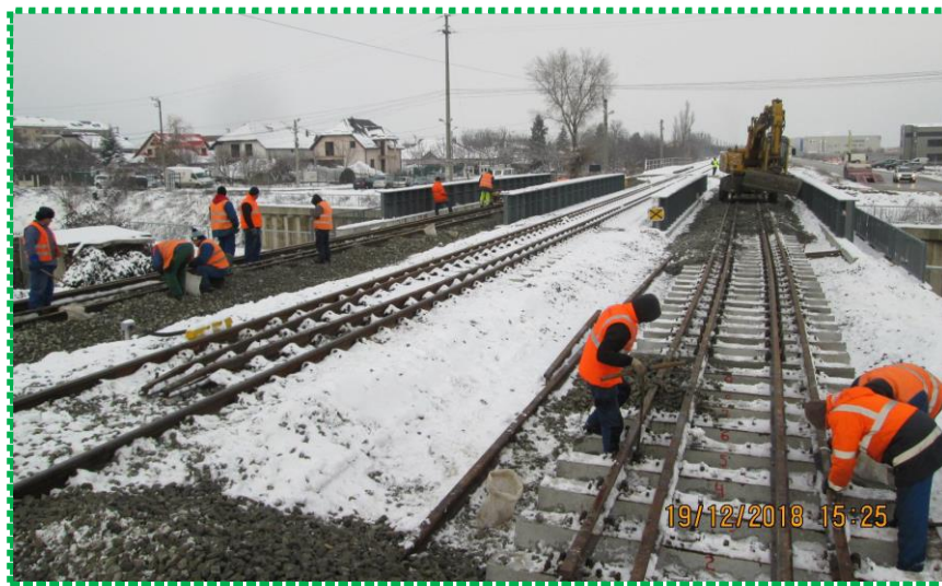
Prindere șină și completare prismă piatră spartă Linia I

Pod km 20+474 linia de cale ferată BUCUREȘTI - VIDELE