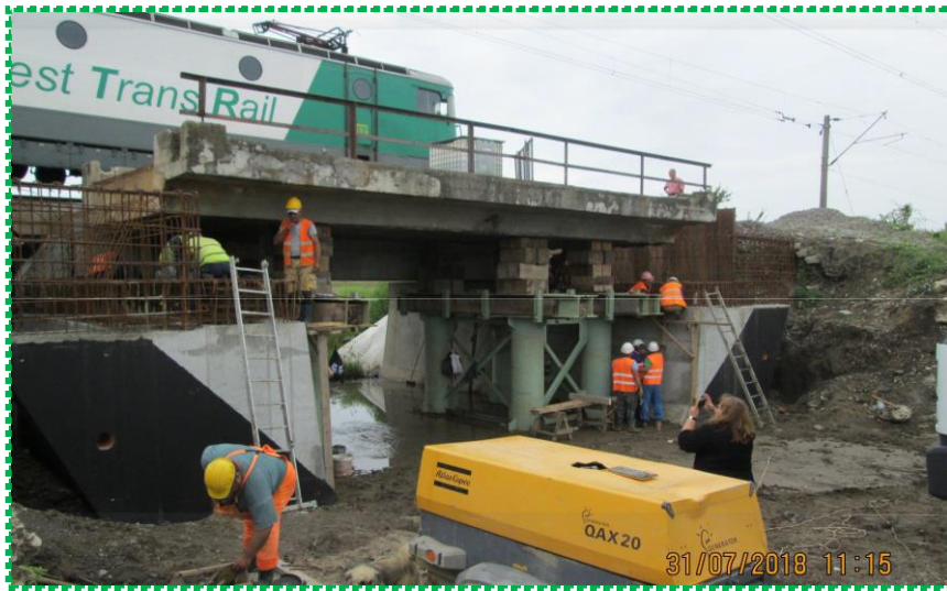
Montare armături banchete cuzineți culei - Fir I