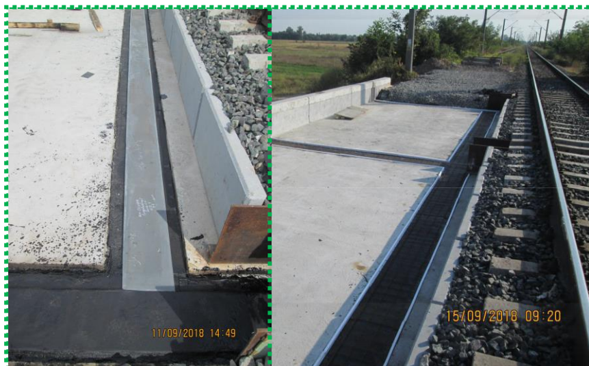
Execuție rost de dilatație – Montare tolă metalică și betonare dală beton