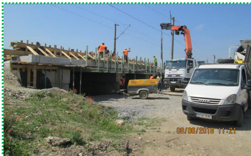
Cofrare opritori balast tablier - Fir I