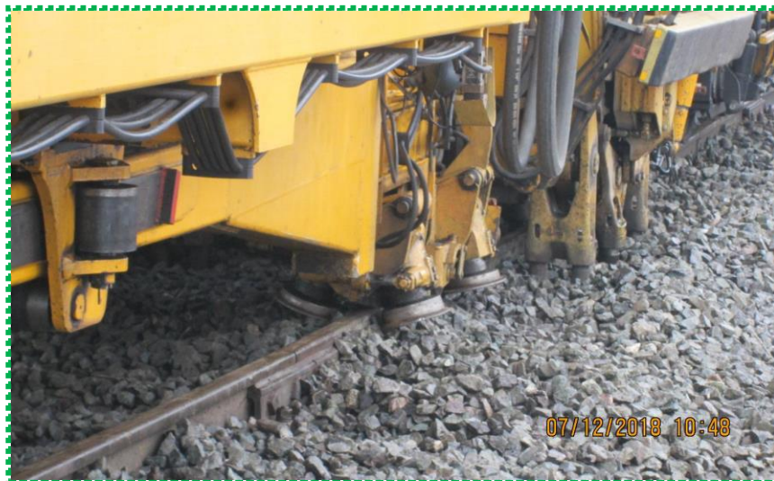
Efectuare buraj mecanizat