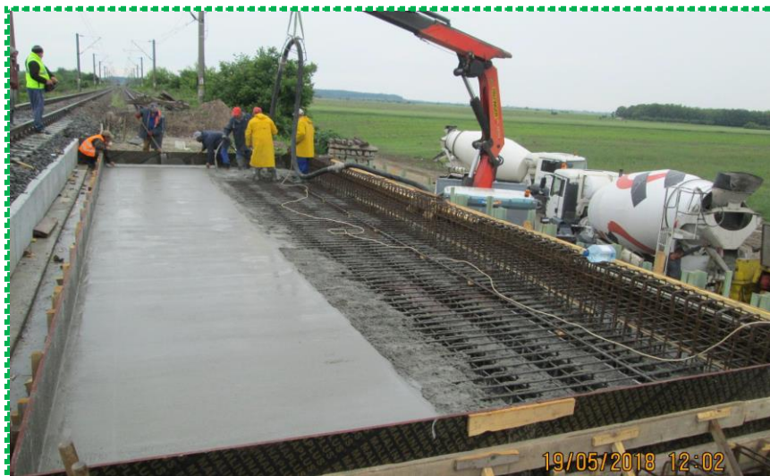
Turnare beton dala tablier – Fir I

Pod km 20+474 linia de cale ferată BUCUREȘTI - VIDELE