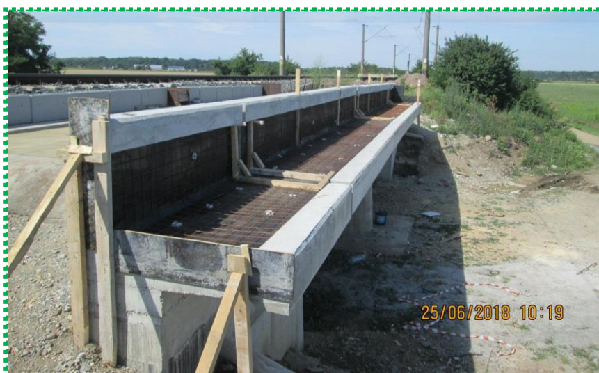
Plasă sudată turnare șapă protecție hidroizolație trotuar - Fir I