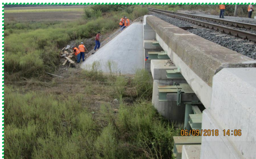
Execuție peruu betonat și scări acces – Fir II