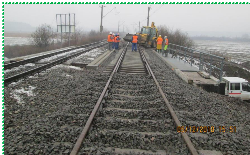
Montare suprastructură CF – Fir I