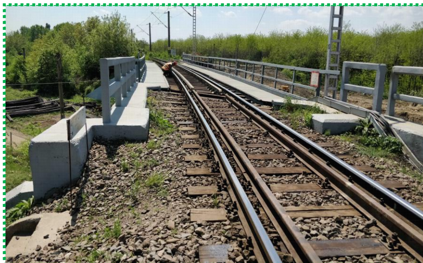
Monitorizare pod - verificare izolatori și prinderi joante