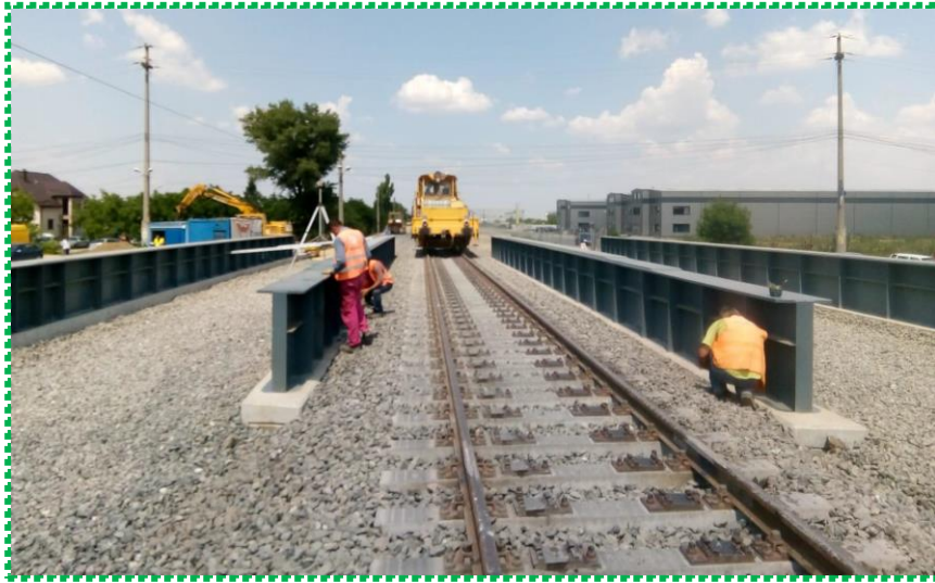
Montare suprastructura CF – Linia II Magistrala 700