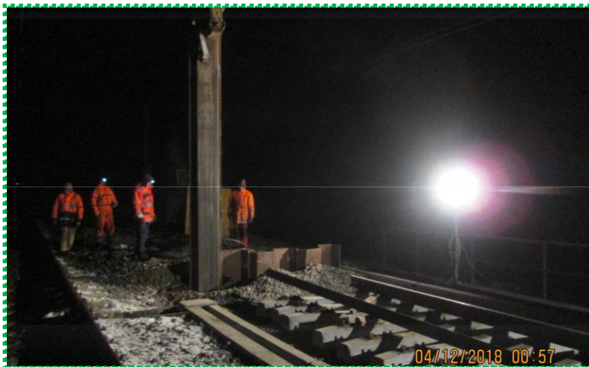
Extragere palplase in inchidere nocturna a circulatiei feroviare