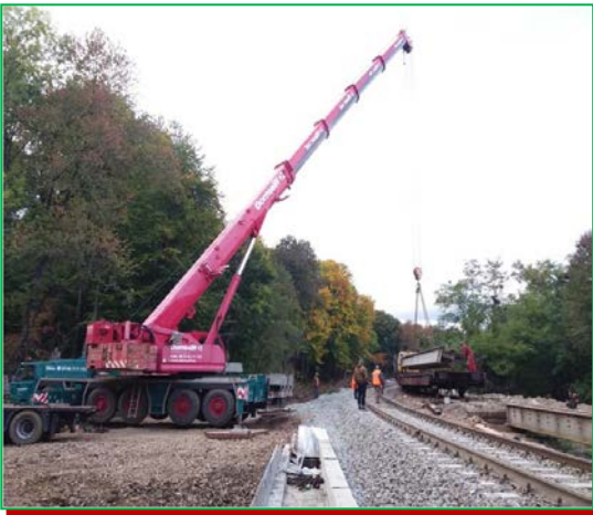
Scoaterea PP G18