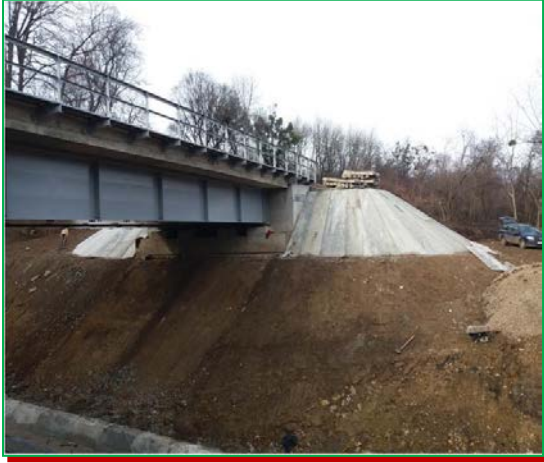
Sferturi de con