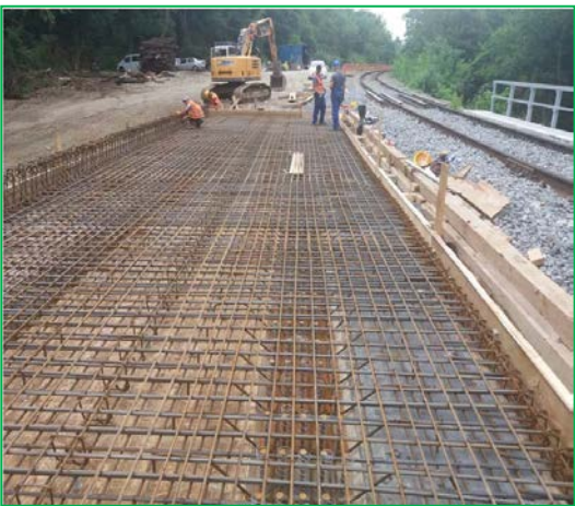
Armare tablier fir II