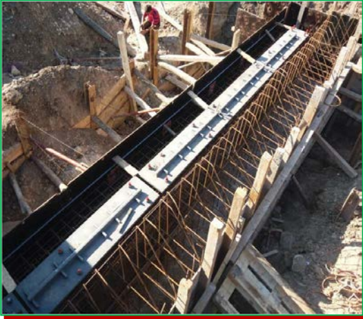
Finalizare Culeea Huedin