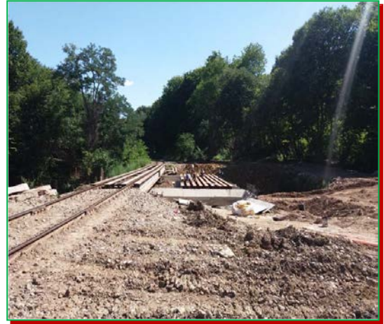
Așezarea grinzilor pe reazeme