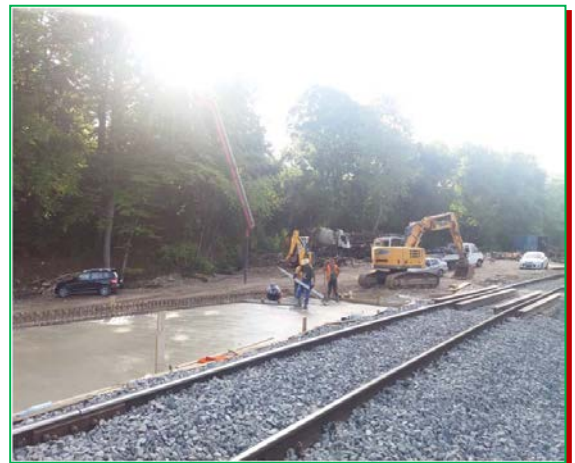
Betonare tablier Fir II