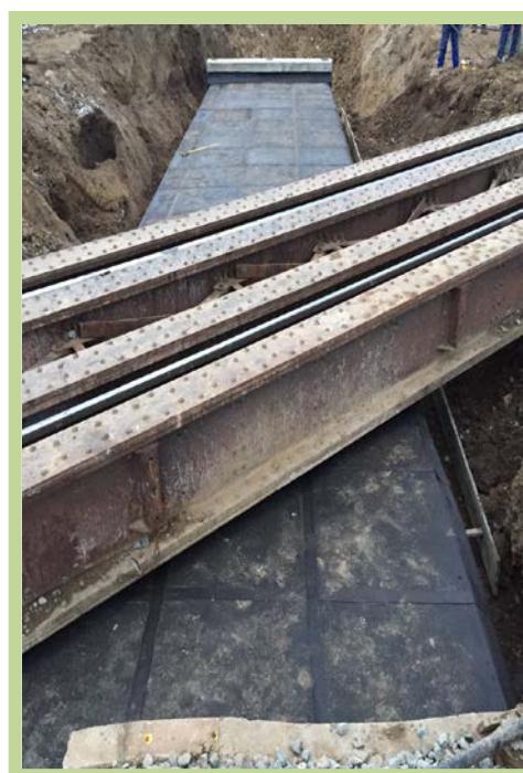
Podęţ km 439+450