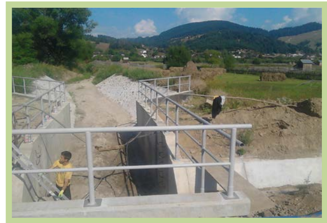
Podęţ km 101+311