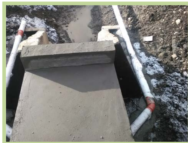
Podęţ km 418+889