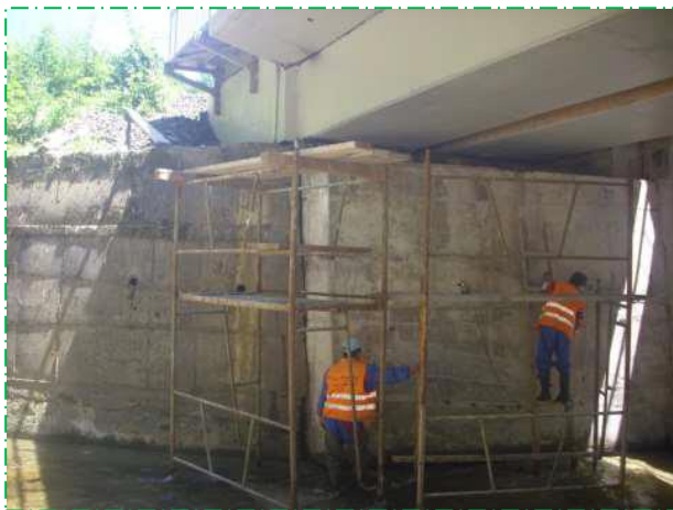
Reparații suprafețe beton culee Petroșani, pod fir I