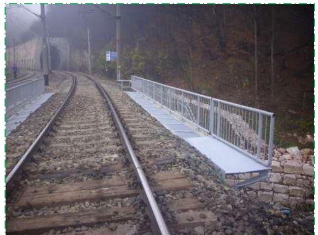
Finalizare lucrări reparații, pod fir I