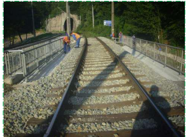
Reparații suprafețe beton consolă trotuar, pod fir I