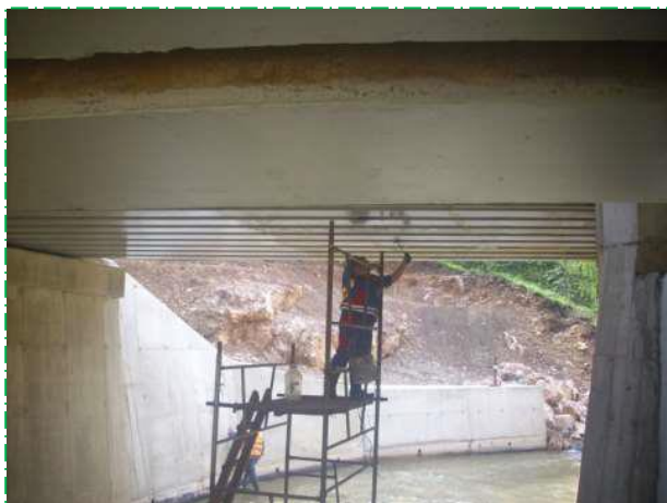
Reparații suprafețe beton suprastructură, pod fir I