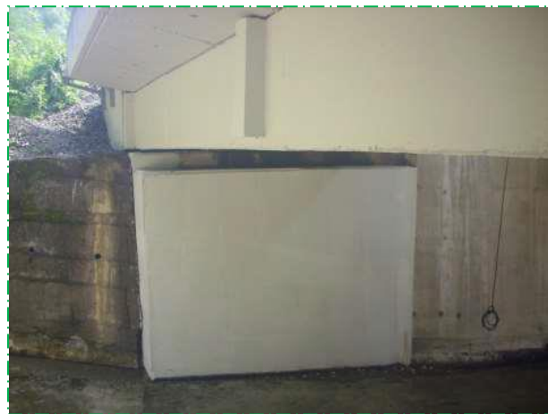
Impermeabilizare suprafețe beton culee Petroșani, pod fir I