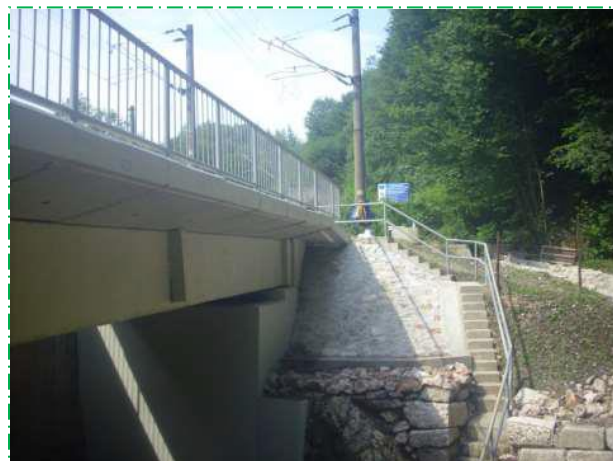
Finalizare reparații impermeabilizare și suprastructură