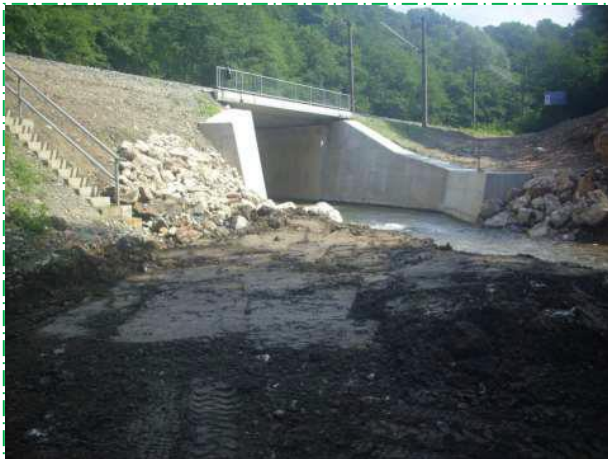
Realizare protecție culee Simeria amonte