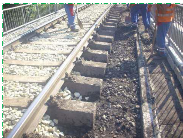
Decolmatare piatră spartă, pod fir I