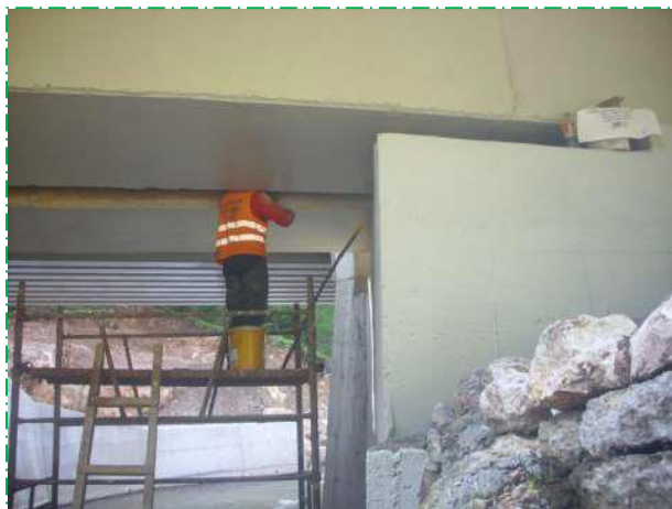
Finalizare reparații suprafețe beton, pod fir I