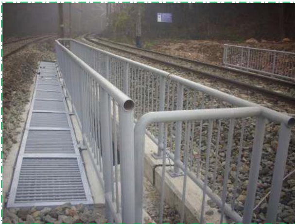
Montare grătare metalice trotuare, pod fir I