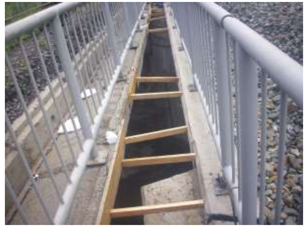
Reparații - culeea Simeria