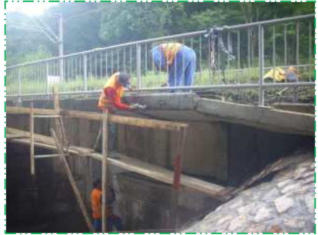
Reparații suprafețe de beton