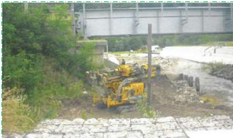
Studiu geotehnic culee Simeria