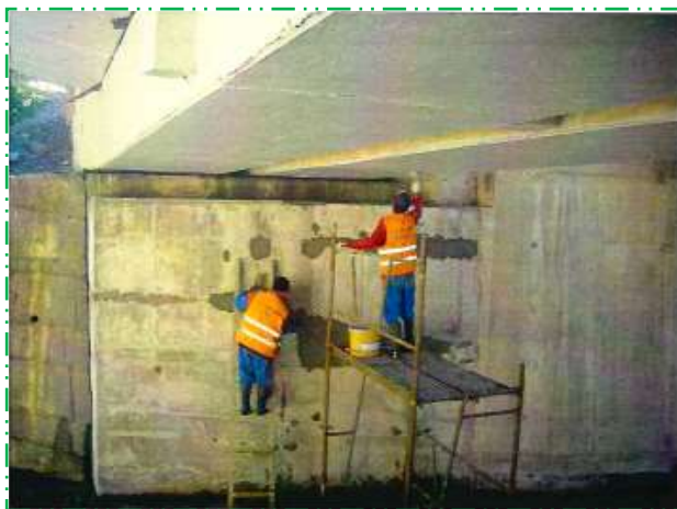
Vopsitorie suprafețe beton