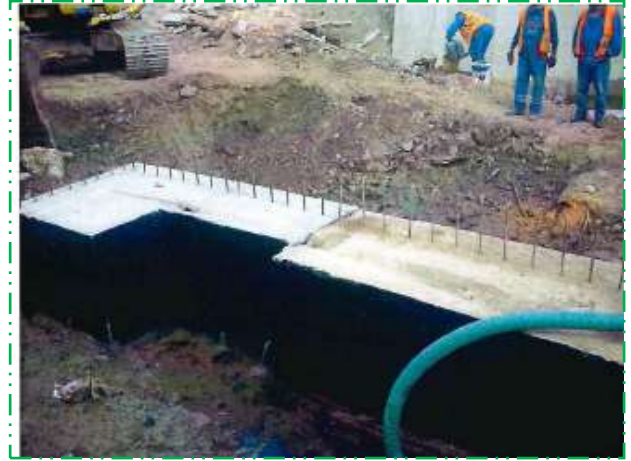
Cofrare, armare, turnare beton în banchetă dren tronson 4