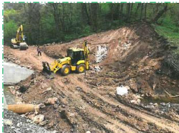
Defrișare versant mal drept, devierea apei de la baza versantului pe partea stângă a albiei