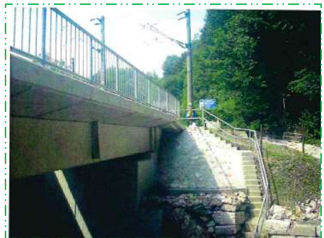
Protecție cu anrocamente sfert de con - culeea Simeria