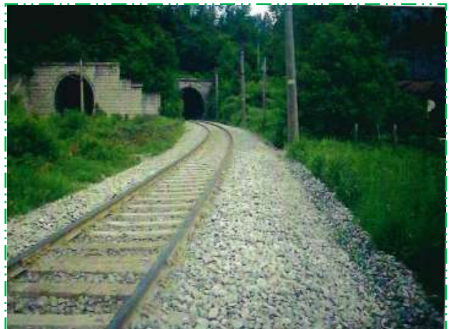
Desființare drum de acces și deschiderea circulației