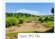
Type: JPG File Size: 85.7 KB Date modified: 31/01/2020 202106_Săpătură pentru platforma tehnologică coloane forate viaduct km 252+525