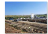
202107_Cofrare și armare grinda de coronament - consolidare Beia km 247+295 ÷ 247+633