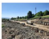
202106_Săpătură între coloane forate consolidare km 242+448 ÷ 242+929