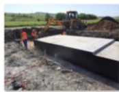
202106_Umpluturi compactate în stratul în jurul fundației podețului km 239+365