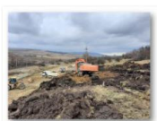
202102-Palos 1 km - 242+700 Profilare taluz Fir II_2

S1 Brasov - Cata: st. Brasov (LC, PI , EG), interval Bv-Stupini (LC, PI ), st Stupini (LC, PI), S3 Apata - Sighisoara: statia Cata (CC), int. Cata -Archita (CT, PV, PO, DR)