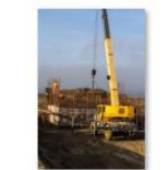
Stupini - Bod (12)