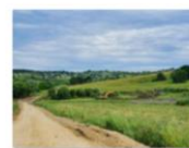
202106_Săpătură pentru platforma tehnologică coloane forate viaduct km 251+774