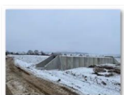
202102-Podeț km 271+233