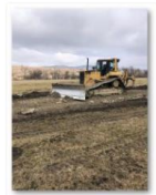
202102-Viaduct km 254+400 - Drum tehnologic_2