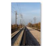
Stupini - Bod (16)