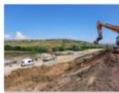
202107_Betonare și taluzare consolidare cu piloți Beia km 247+295 ÷ 247+633