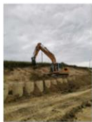
202106_Săpătură în ampriză, săpătură între piloți consolidare