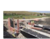
202107_Cofrare fundații aripi prefabricate podeț km 248+495