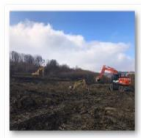
202102-Viaduct km 254+400 - Săpătură fără sprijiniri culee 1 și pila 1