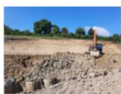
202106_Săpătură în ampriză, săpătură între piloți consolidare și taluzare km 242+448 ÷ 242+929