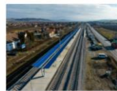
S3 Albesti (2)