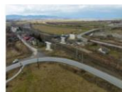
S1 Feldioara (1)