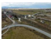
S1 Feldioara (1)