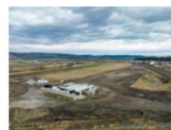
S1 Feldioara (2)