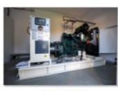
S3 Albesti (1)