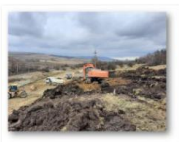
202102-Paloș 1 km – 242+700 Profilare taluz Fir II_2

S3 Apata - Sighisoara: statia Cata (CC), int. Cata -Archita (CT, PV, PO, DR)