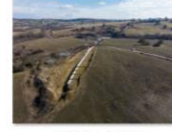
S3 Beia - Archita