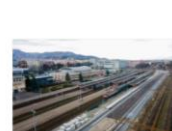
S1 st Brasov