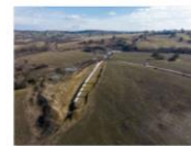
S3 Beia - Archita