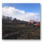
202102-Viaduct km 254+400 – Săpătură fără sprijiniri culee 1 și pila 1