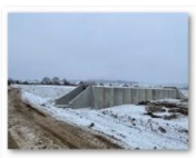
202102-Podeț km 271+233