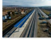
S3 Albesti (2)