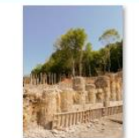
Pregatire ancore de test-1