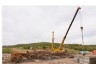
047_executie piloti portal P3 - tunel Homorod