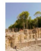
Pregatire ancore de test-1