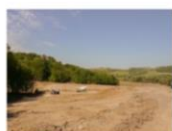
Livrare beton in santier