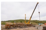
047_executie piloti portal P3 - tunel Homorod