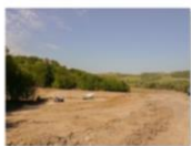
Livrare beton in santier