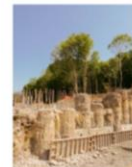
Pregatire ancore de test-1