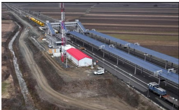
Stația Bârzava Nouă