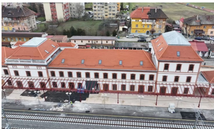
Stația CF Simeria