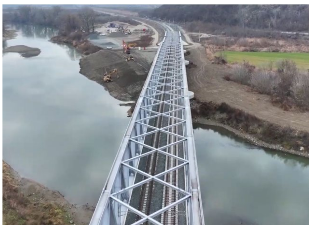
Pod peste râul Mureș – interval Mintia – Ilia