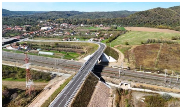
Pasaj superior Stația CF Săvârșin