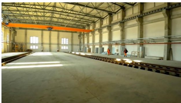
Hală de mentenanță Stația CF Săvârșin