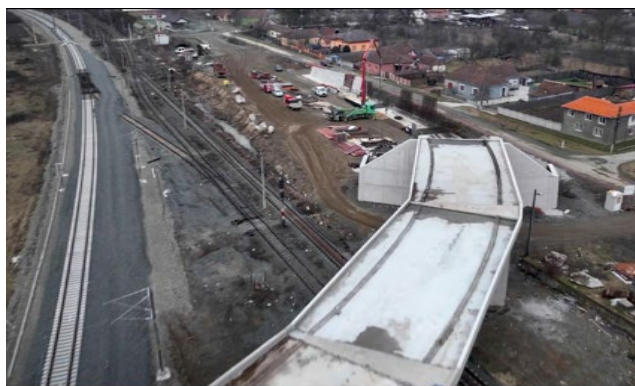
Pasaj superior Stația CF Bârzava Veche